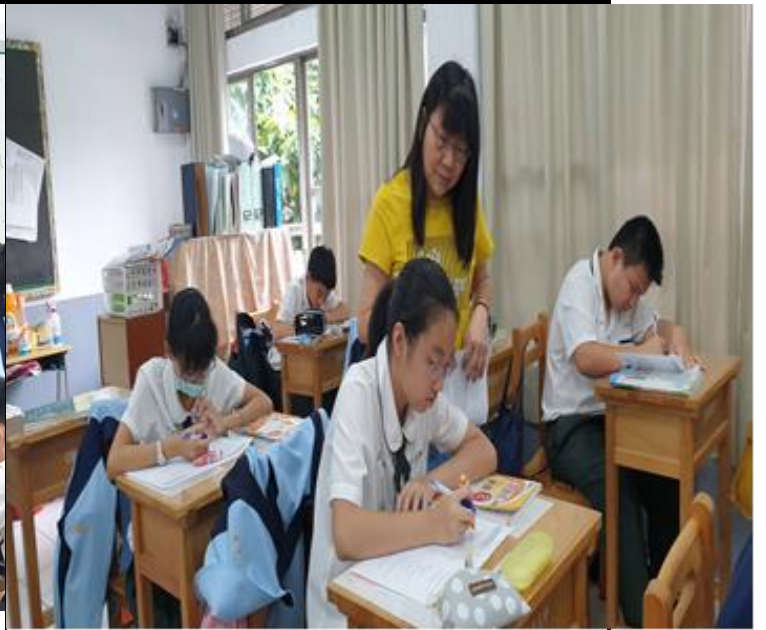
主動積極指導學生