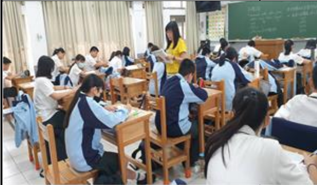
巡視每一位學生學習狀況