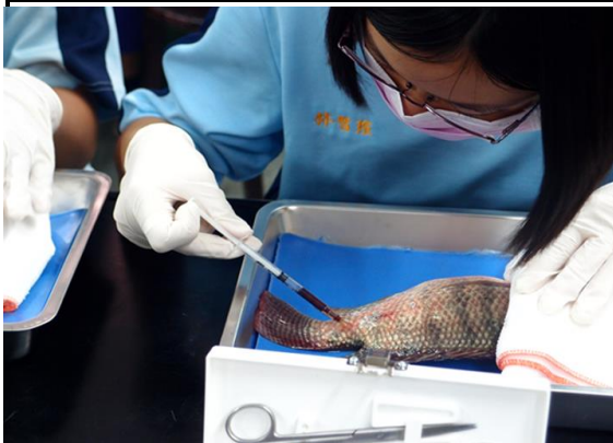
學生抽魚血實驗課程