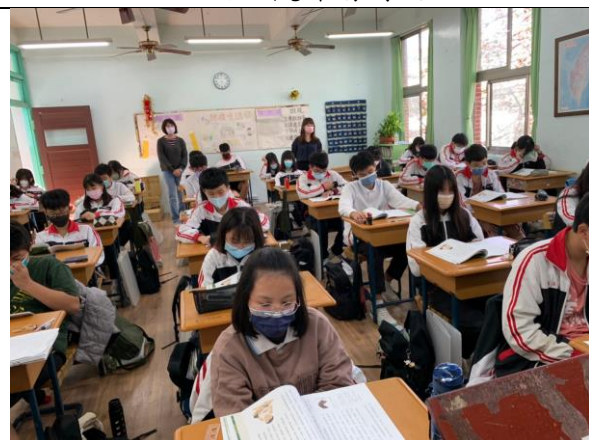
說明：老師共同觀課情形