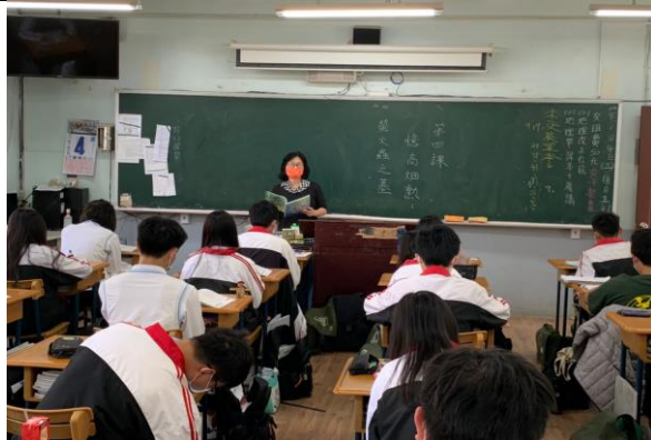
說明：教師公開授課情形