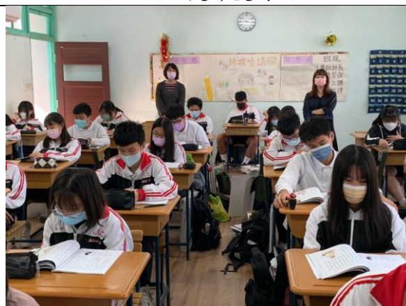
說明：老師共同觀課情形