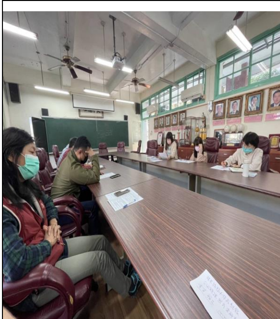
說明：課前會議說明課程單元