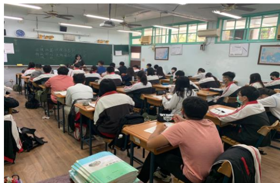
說明：學生上課情形