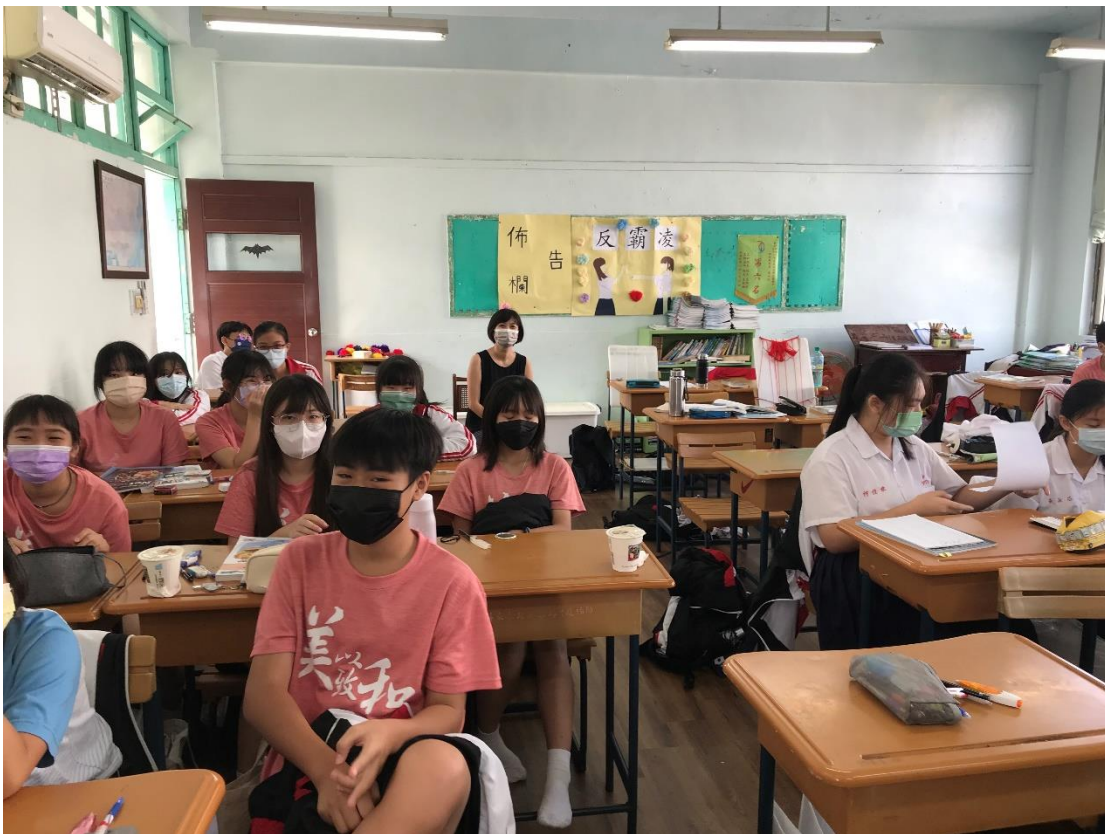
課程實踐歷程紀錄(課堂學習活動照片、學生成果照片等)