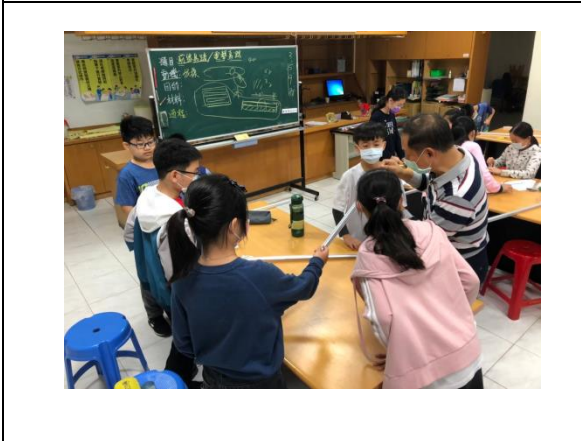
高年級的自然課~科學好好玩