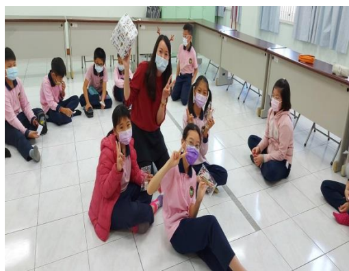
中年級的英語課~大風吹拼字遊戲