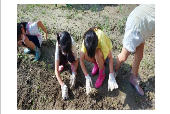
中年級的自然課~食農好好玩