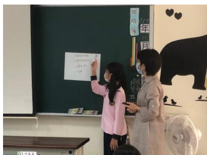
G5 的數學課~孩子上台解說