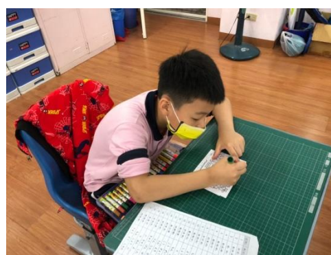
高年級的英語課~書寫英語卡片