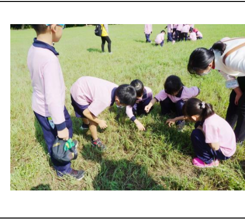
中年級的自然課~戶外環境教育