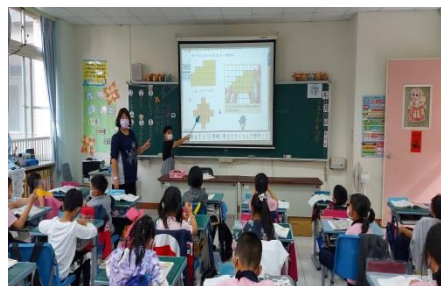
G3 的數學課~小老師上台解說