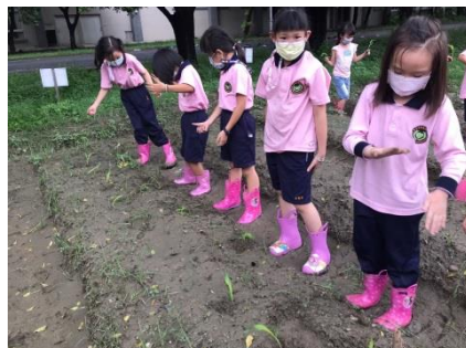
G2 的生活課~種農作物去!