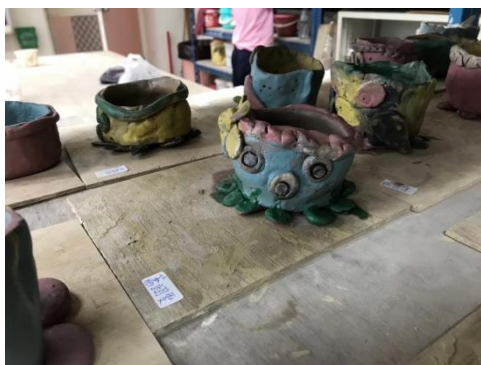
高年級的藝術課~陶藝作品秀