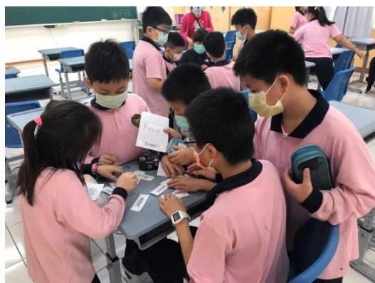
中年級的英語課~拼字遊戲