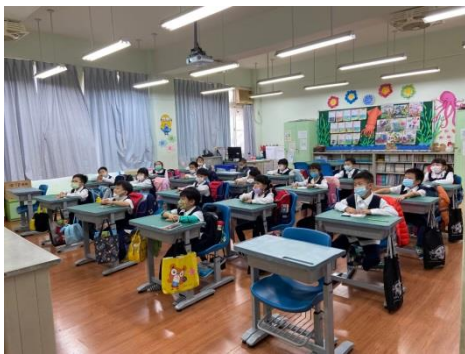
本土語課程上課狀況