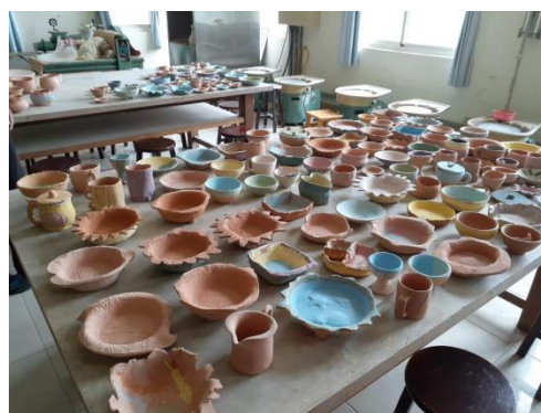
高年級的藝術課~我製作的陶碗