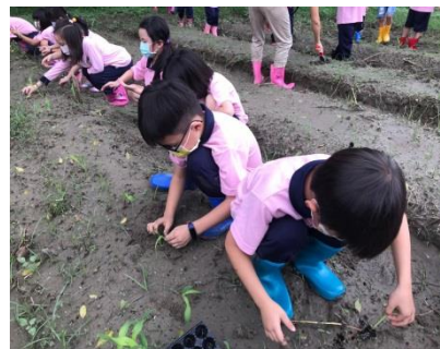
G2 的生活課~種農作物去!