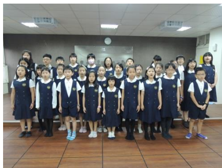
中年級的藝術課~發聲練習