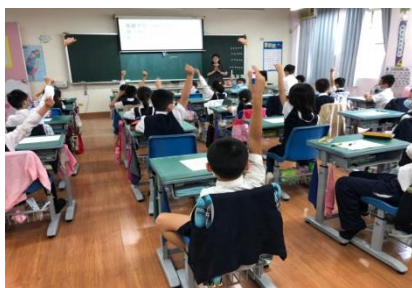
G2 的數學課~學生踴躍舉手