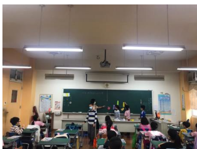
G4 的數學課~孩子上台實作練習