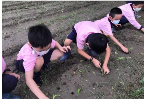
中年級的自然課~食農好好玩