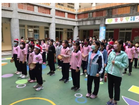
中高年級的藝術課~聖誕歌曲歡唱