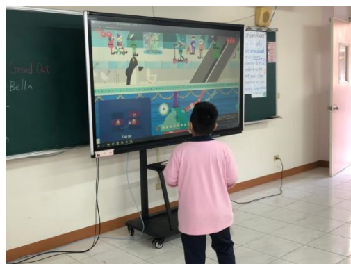
高年級的英語課~互動式遊戲