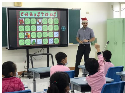
低年級的英語課~Bingo 遊戲