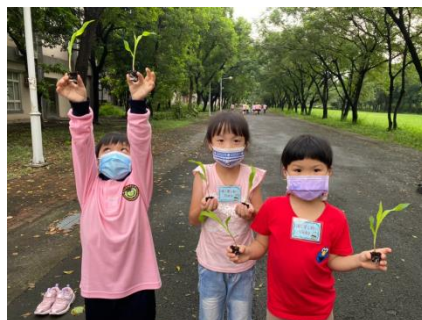
G1 的生活課~種玉米好好玩