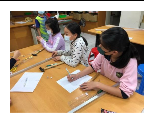
高年級的自然課~學生作筆記