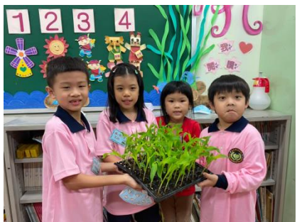
G1 的生活課~種玉米好好玩