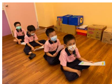
G1 的數學課~學生等待數學闖關