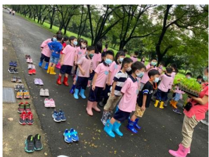
G1 的生活課~排隊領苗種