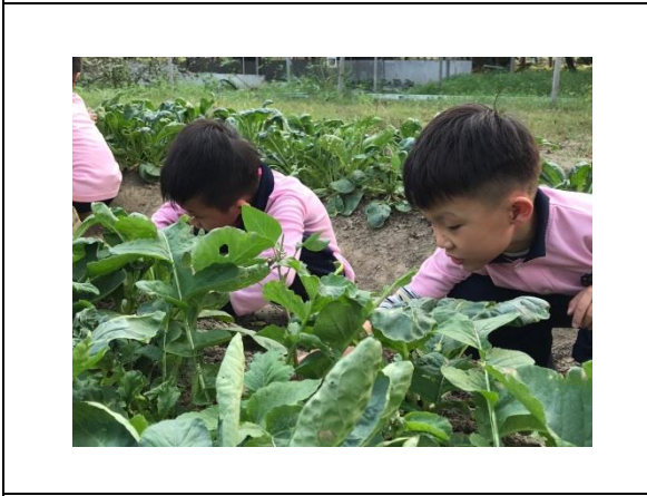
中年級的自然課~採收農作物