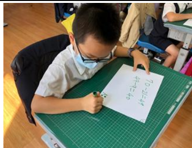
G2 的數學課~使用小白板計算