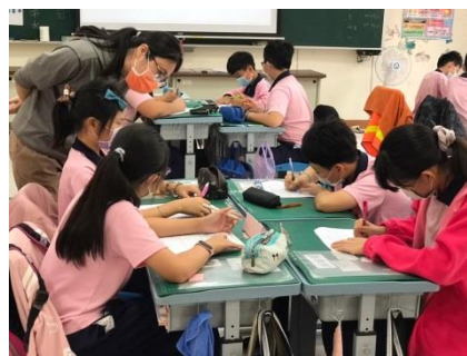
G6 的數學課~分組討論