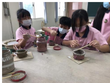
中年級的藝術課~陶藝課程