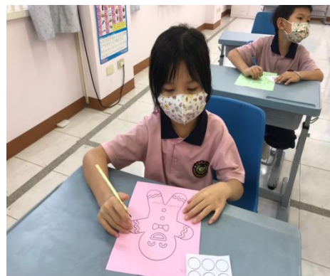
低年級的英語課~繪畫薑餅人