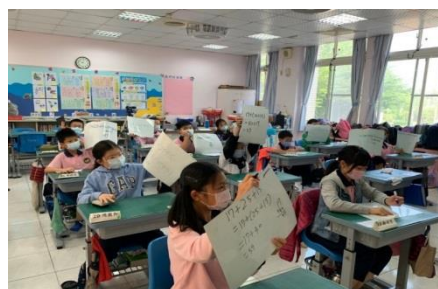
G5 的數學課~使用小白板答題