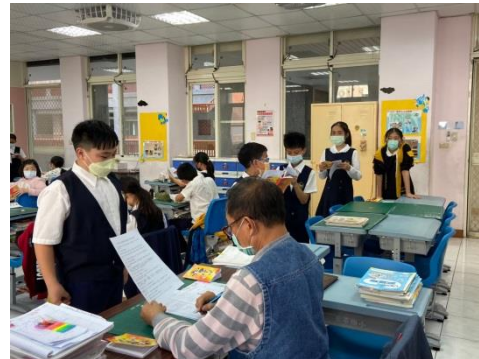
本土語課程上課狀況