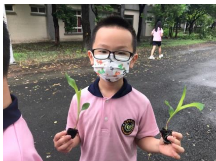
G2 的生活課~我是小小農夫