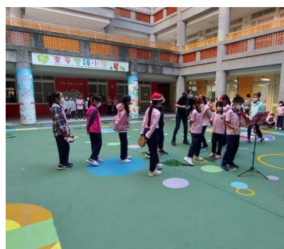
高年級的藝術課~小提琴表演