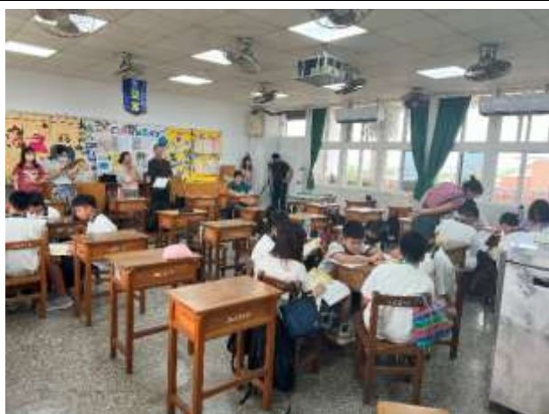
說明：閩南語老師公開觀議課