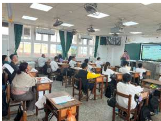
說明：閩南語老師上課情形