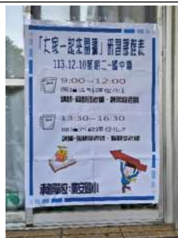
說明：閱讀推動教師校外分享