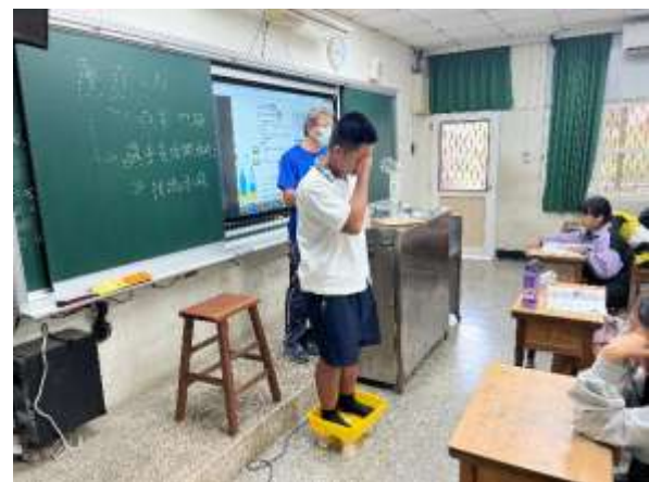
說明：上課時讓學生實際體驗幫助了解基本概念