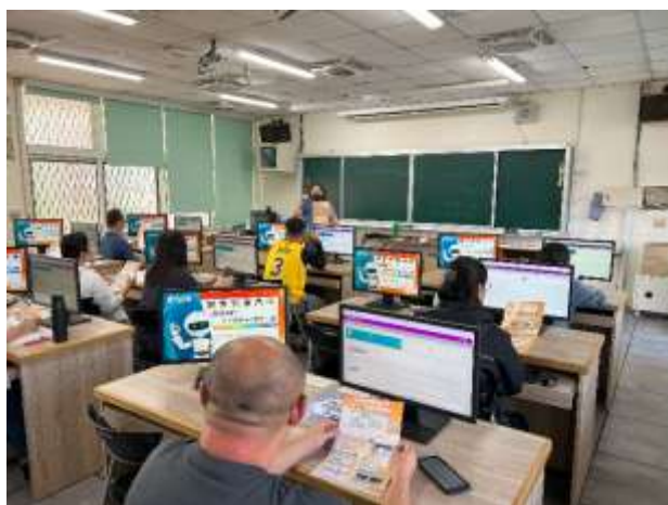
說明：學校採購軟體 AILEAD 教師增能研習，以幫助學生課後複習