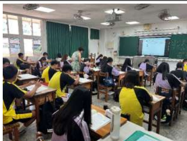
說明：教師針對同學個別問題給予指導