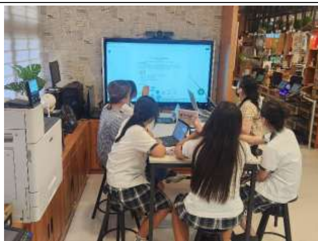
說明：教師利用圖書館場域設備指導學生柯華葳線上平台