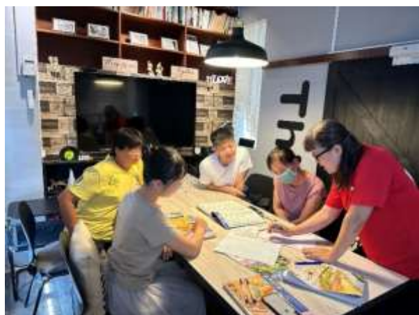
說明：領域教師共備會議