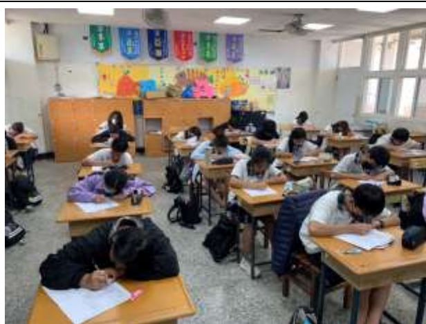
說明：利用學習單確認學生學習狀況