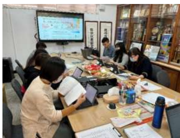
說明：領域教師參與科技化評量平台研習了解學生測驗情況