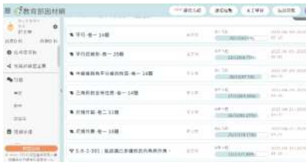
說明：學生使用因材網進行練習