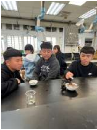
說明：學生實驗實作成品