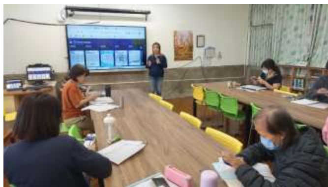
說明：閱讀推動教師研習