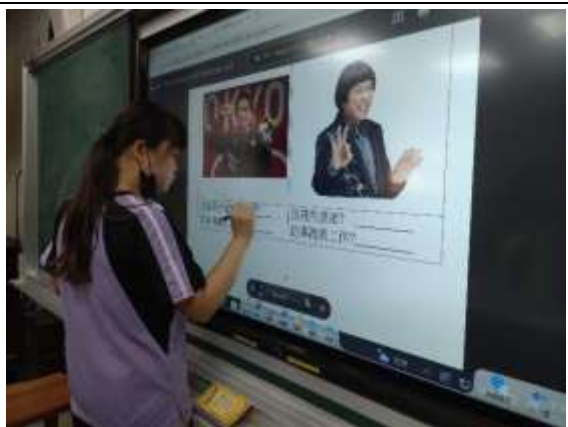
說明：公民科生涯發展教育融入課程