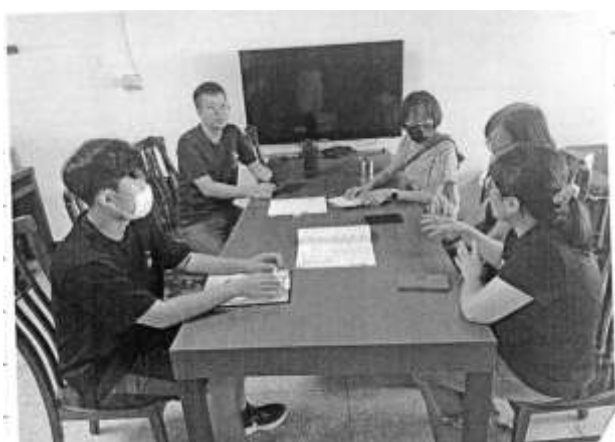
說明：領域教師共備會議