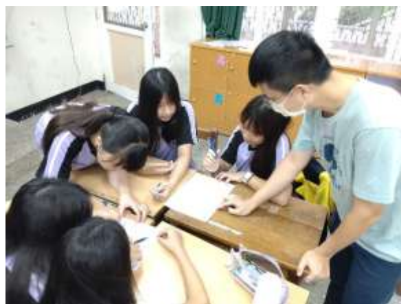
說明：教師針對各組同學進行個別指導