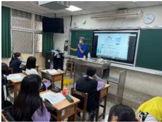
說明：教師講解課程內容