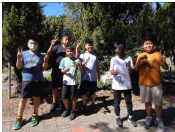
說明：尋找歷史課本中的校園植物-構樹