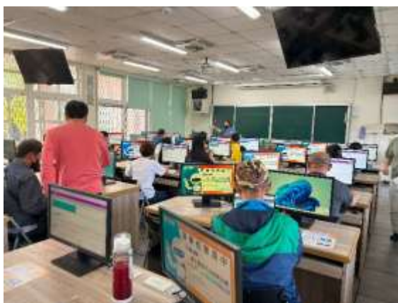
說明：學校辦理教師增能研習