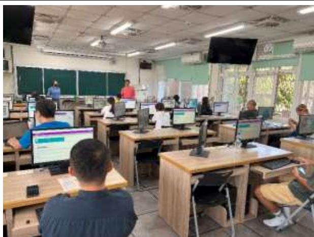
說明：學校採購軟體 AILEAD 教師增能研 習，以幫助學生課後複習