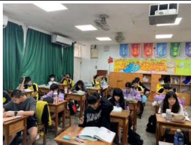
說明：課堂中檢討習作，學生對於不清楚的部分提問及討論