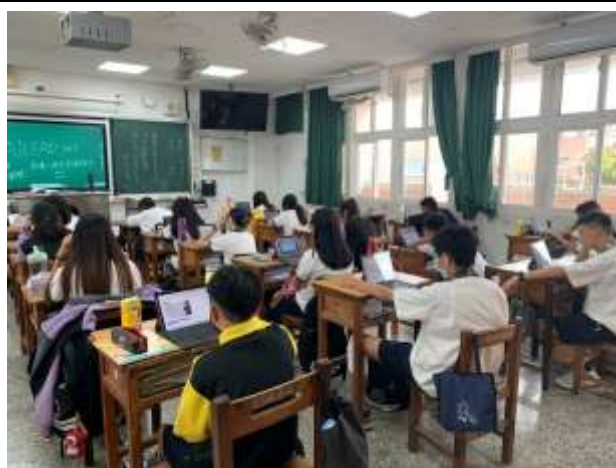
說明：學生學習如何使用學校採購軟體 AILEAD，以幫助課後複習，