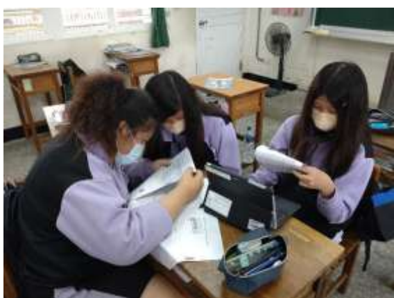
說明：透過分組討論完成學習單內容