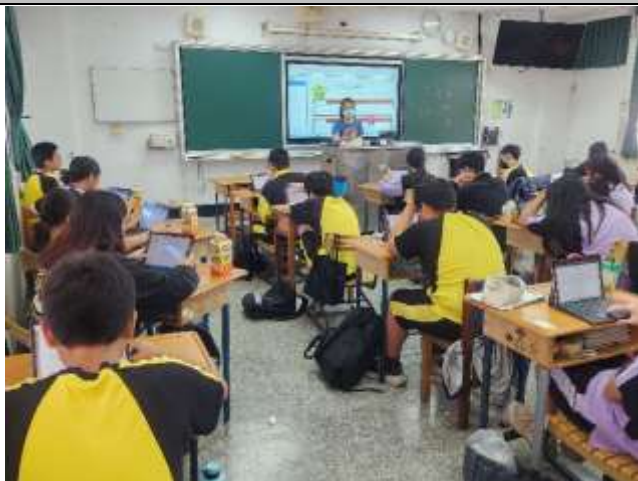
說明：老師上課情形