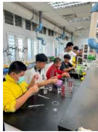
說明：學生實驗實作