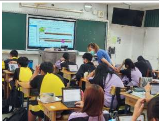
說明：針對學生問題個別指導