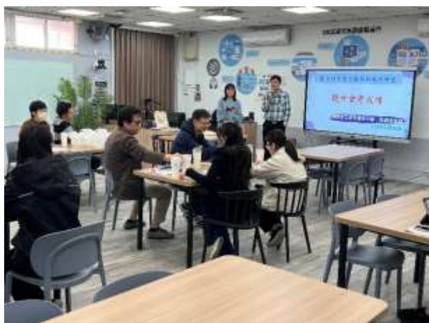
說明：提升數學科會考成績教師研習