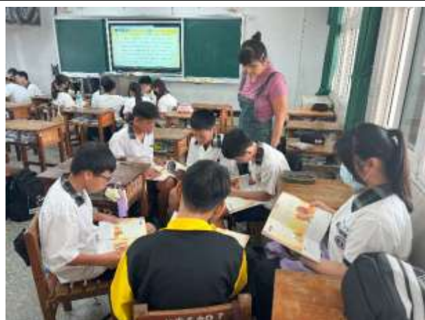
說明：學生分組練習口說