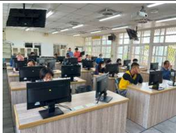
說明：學校採購軟體 AILEAD 教師增能研習，以幫助學生課後複習