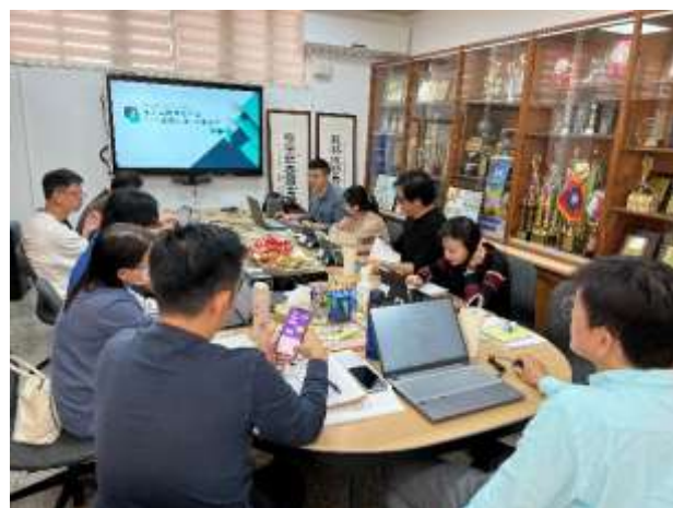
說明：教師參與科技化評量平台研習了解學生測驗情況