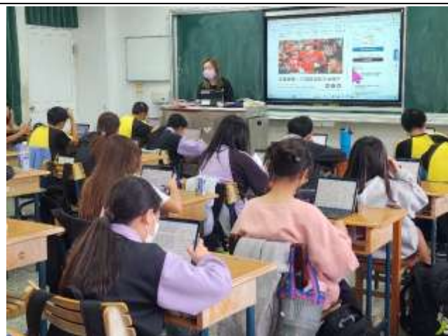
說明：品學堂團隊入校觀課