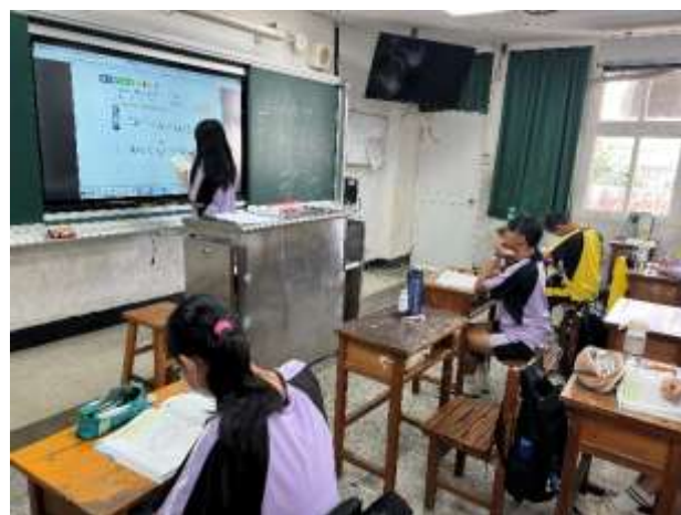
說明：同學上台回答問題並分享