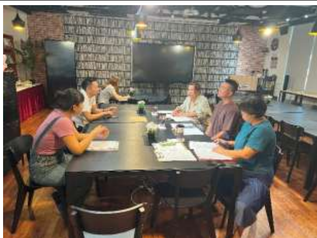
說明：113 學年度屏東縣本土語(閩南語) 訪視觀課後回饋會議