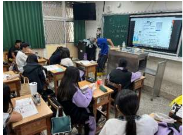
說明：透過示範讓學生更了解基本概念