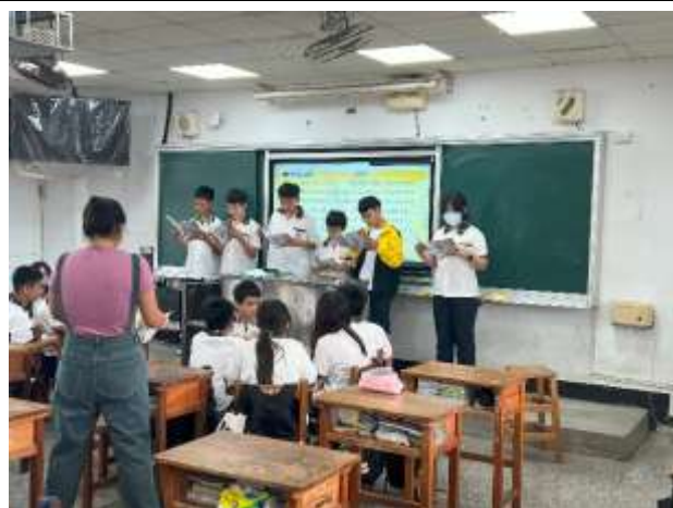
說明：同學上台分享