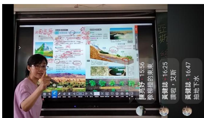
說明：說明西亞北非自然環境和傳統產業；以直播提問加分，吸引學生專注。