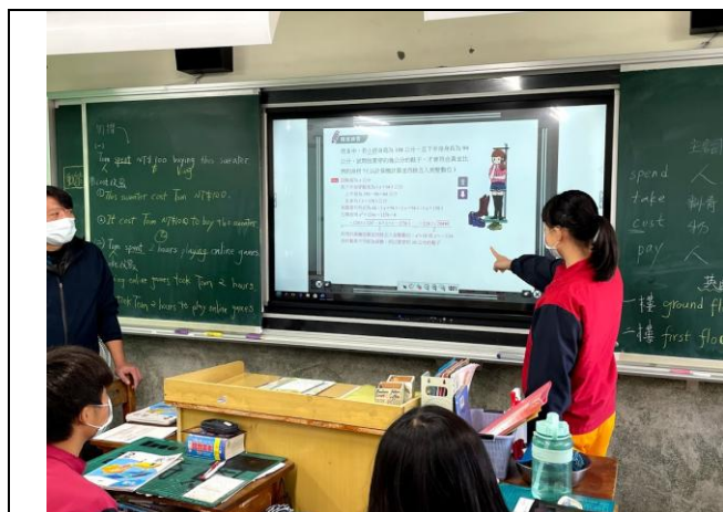
說明：課程進行同學相互討論