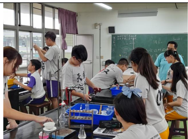
說明：實驗分組與說明