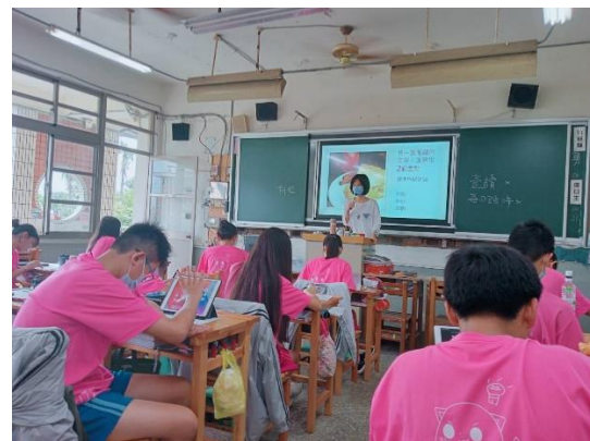
世界地球日帶學生探討剩食問題