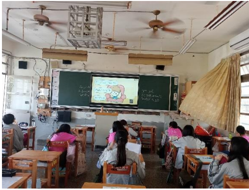
使用均一的理財單元帶學生觀看與討論