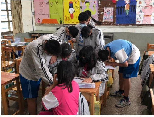
說明：網路成癮九宮格活動