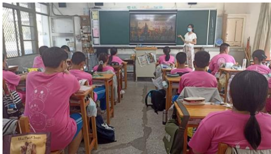
說明：京劇課程影片賞析