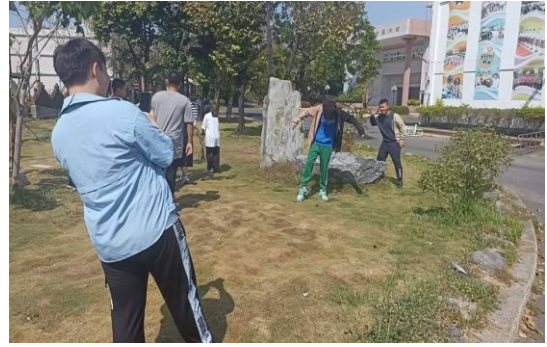
說明：肢體表演活動課程