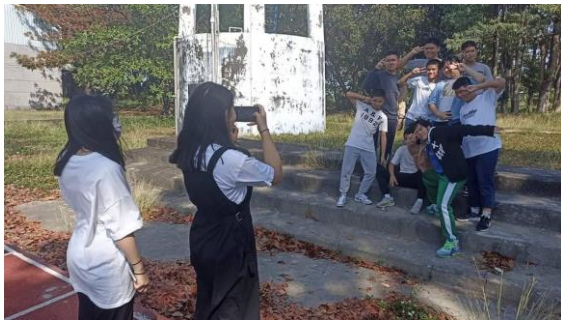
說明：學生透過活動學習課程