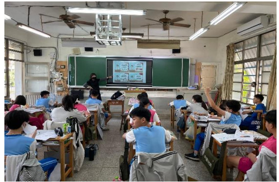
說明：菸酒檳榔對身體的危害