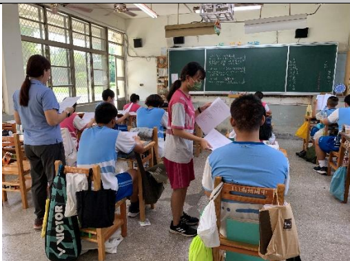
說明：撰寫提問學習單