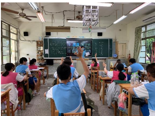
說明：同學踴躍發言