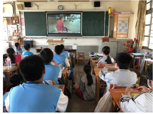
生命教育-街友人生