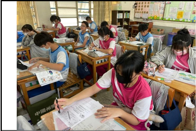
說明：認識電子菸學習單