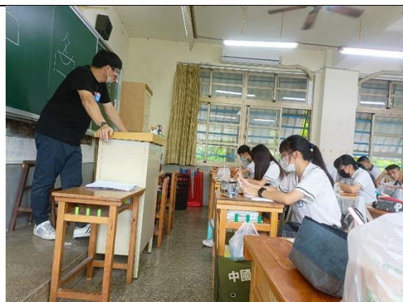
說明：壓力實物說明