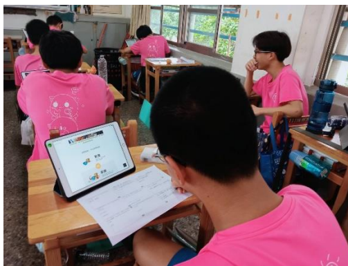
學生使用平板找資料並填寫學習單