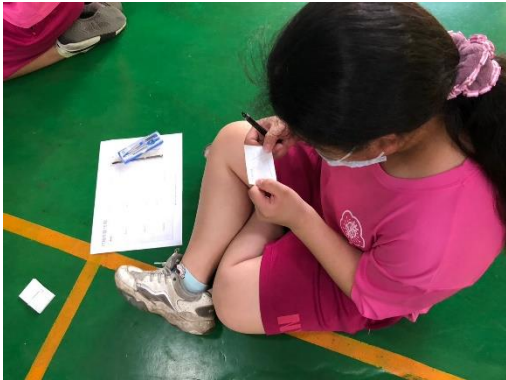
說明：遊戲融入教學(尺規作圖 15 題)