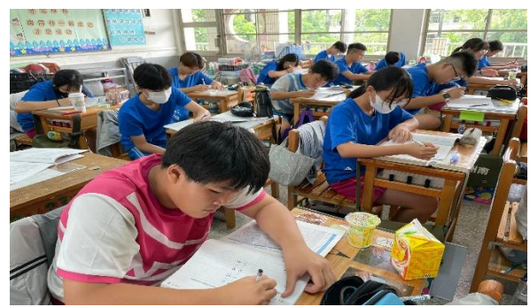
說明：課後習作引導討論練習