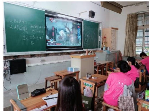
學生觀看相關影片，了解食物浪費的問題