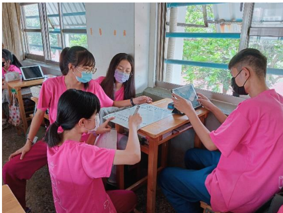
學生針對問題進行小組討論