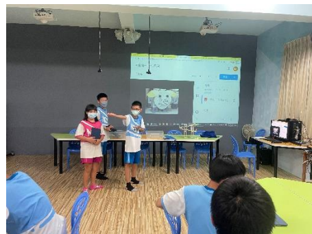
說明：學生作品說明