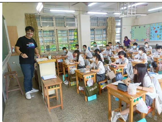
說明：壓力實物說明