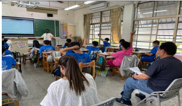
說明：觀課引導學生勇於表達看法