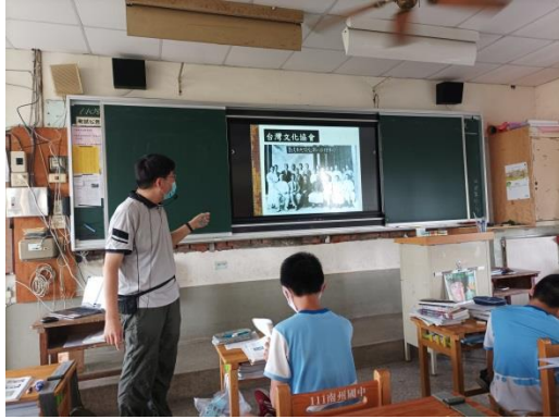
說明：台灣文化協會