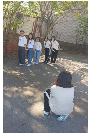
說明：學生透過活動學習課程