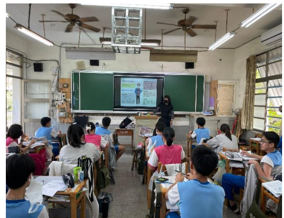
說明：你曾經對有使用過菸酒檳榔？