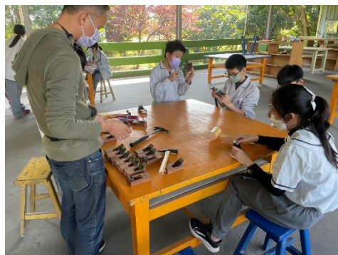
說明：學生操作工具情形