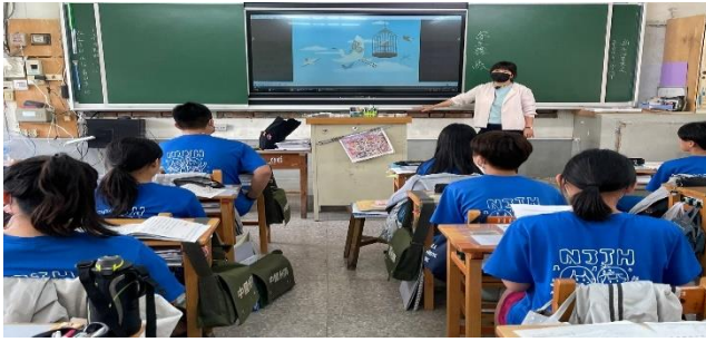
說明：觀賞影片了解課文大綱