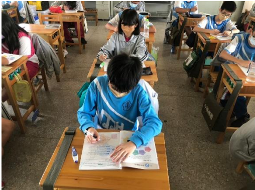
說明：輔導活動課本學習單