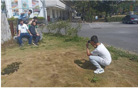
說明：肢體表演活動課程