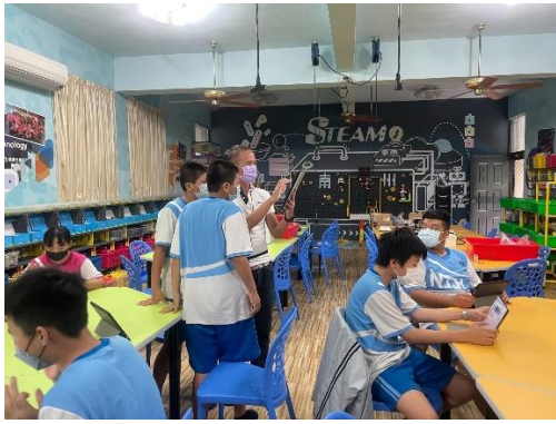
說明：平板融入教學