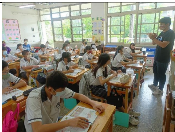
說明：壓力實物說明