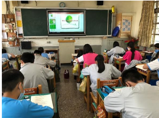
說明：賴氏人格測驗說明分析