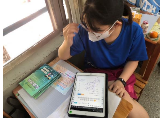
說明：線上作業-教學後測驗