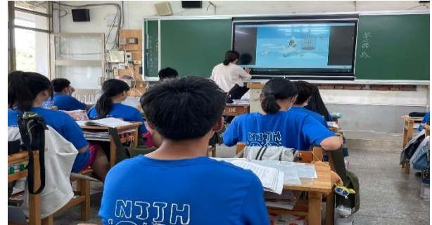
說明：觀後請學生說明課程大綱