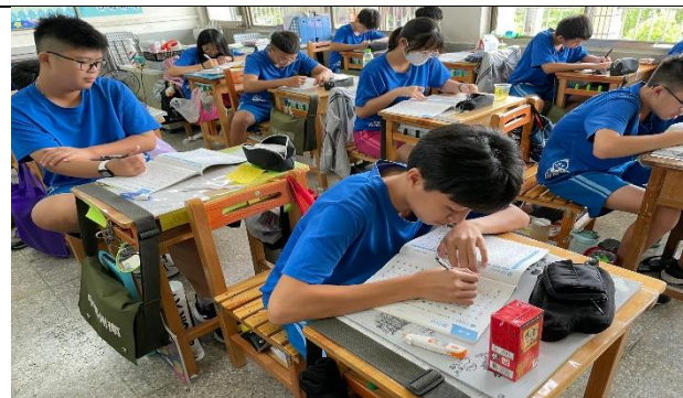
說明：觀賞其他的課文影音輔助教學