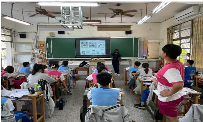
說明：請同學分享菸酒檳榔對國中生的危害