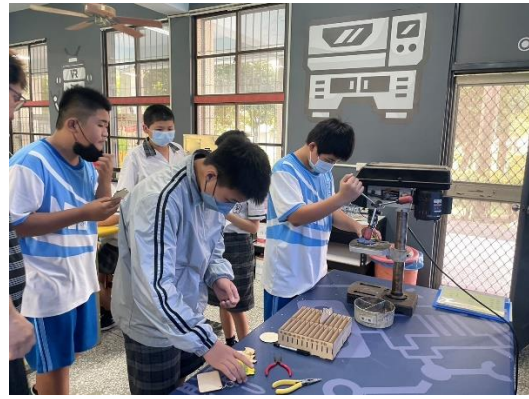
說明：學生學習操作電動工具