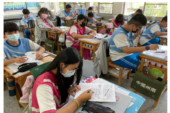
說明：請同學寫下如何勇於拒絕