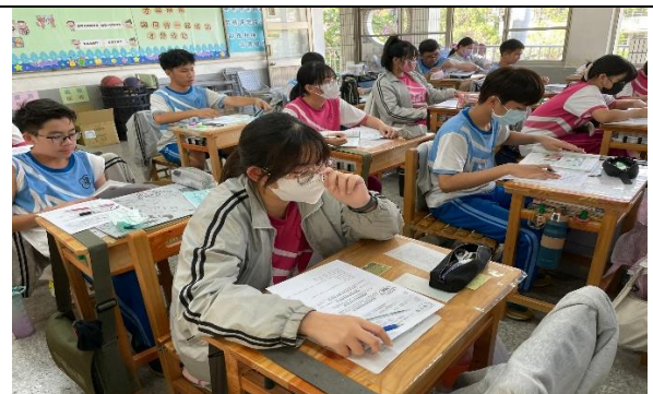
說明：課後學習單練習及思考