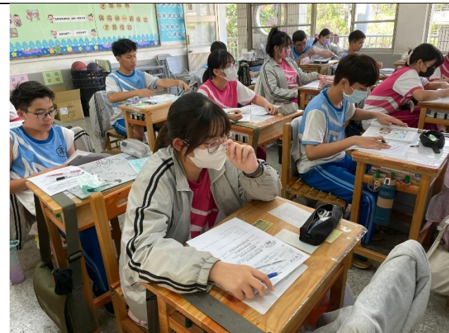
說明：思考如何拒絕不接觸菸酒檳榔