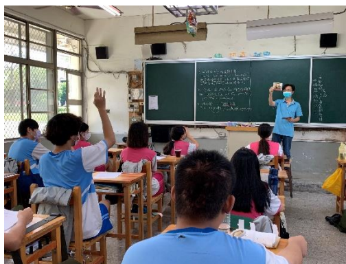
文字搭配歌曲內容學習