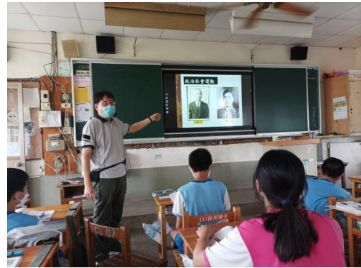
說明：政治社會運動