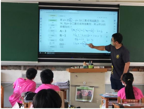
說明：線上作業及解題