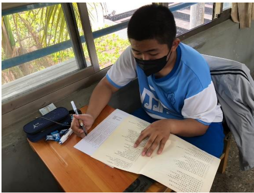
說明：賴氏人格測驗