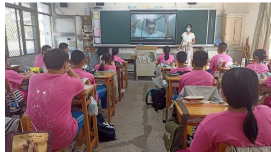
說明：京劇課程影片賞析