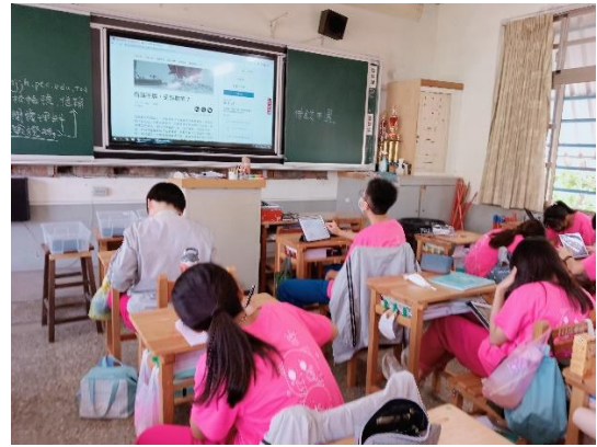
引導學生閱讀品學堂文章，填寫閱讀測驗