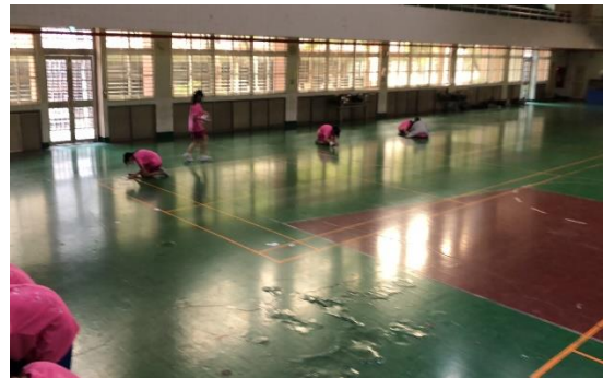
說明：遊戲融入教學(尺規作圖 15 題)