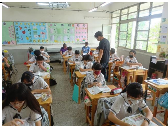
說明：檢視學生學習情形