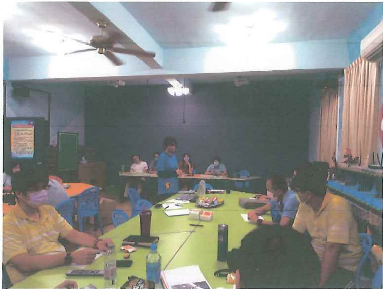
說明：相關說明報告 1