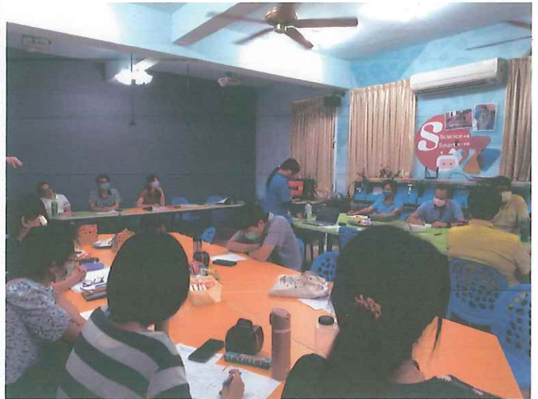
說明：相關說明報告 2