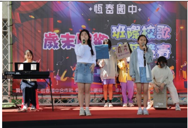
說明：八九年級才藝競賽