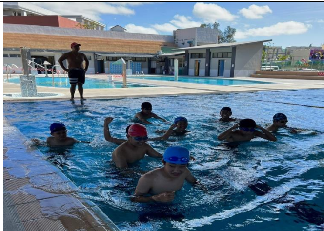
說明：康樂性社團(七八年級游泳社)