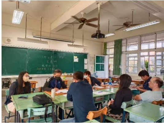
說明：英語領域課程會議