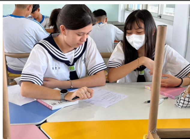
說明：學術性社團(九年級世界探索社)