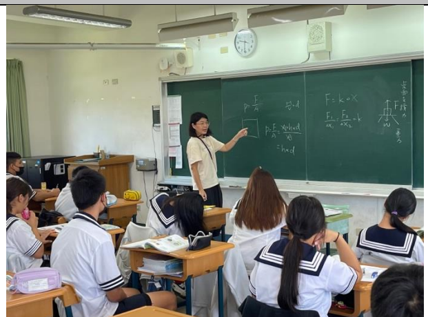
說明：課程教學實況