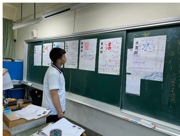
說明：學生藉由海報展示認識各職群