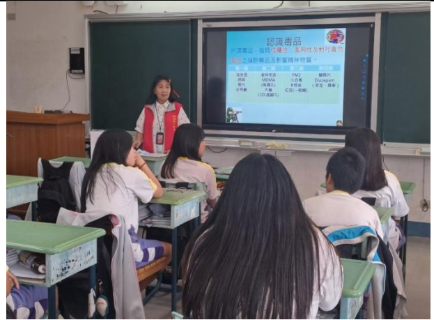
說明：宣導講座(反毒入班宣導)