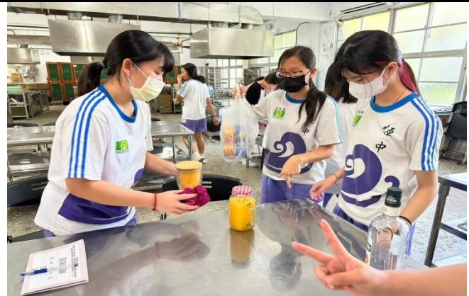
說明：學術性社團(九年級創意調飲社)