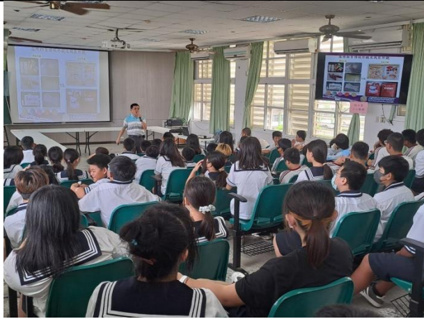
說明：宣導講座(犯罪防治宣導)