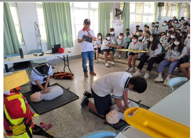
說明：宣導講座(校園防溺水宣導)