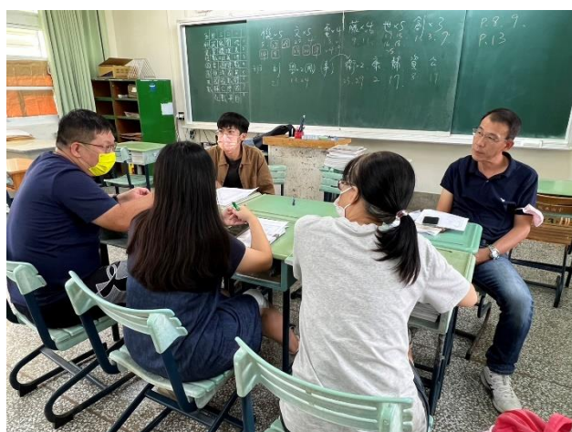
地理、歷史、公民三科教師透過備課、觀課、議課的方式，挑選主題分別進行教學