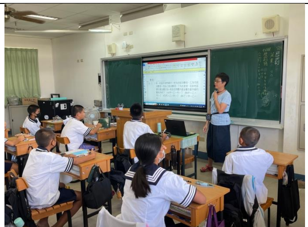
說明：課程教學實況