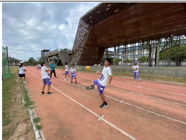
說明：康樂性社團(七八九年級藤球社)