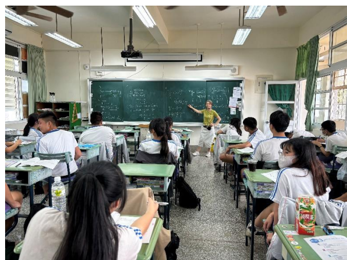
教師講解上課內容