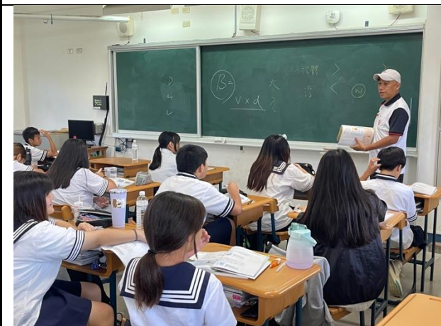
說明：課程教學實況