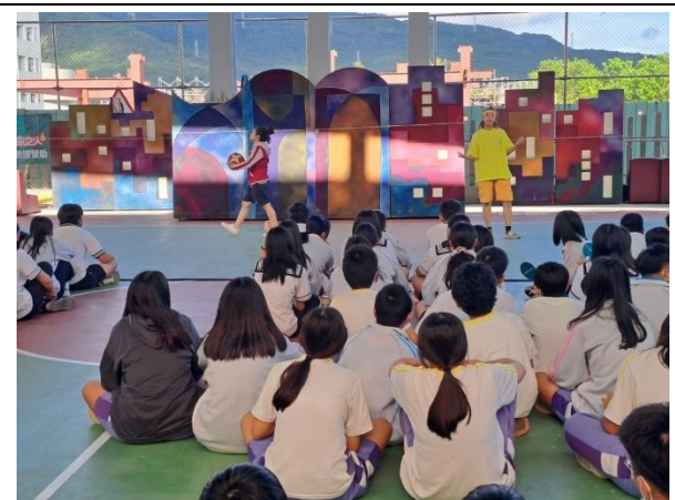
說明：宣導講座(紙風車反毒劇場)