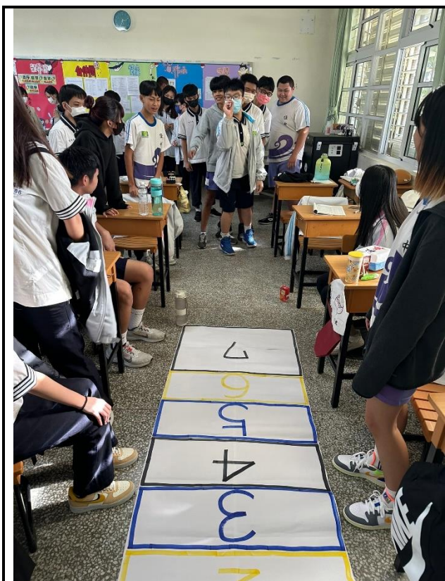
說明：學生藉由生涯航道活動了解，方向比努力重要。