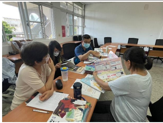
說明：教師分享課程進行心得。