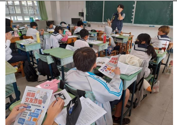
說明：宣導講座(反毒反詐騙入班宣導)