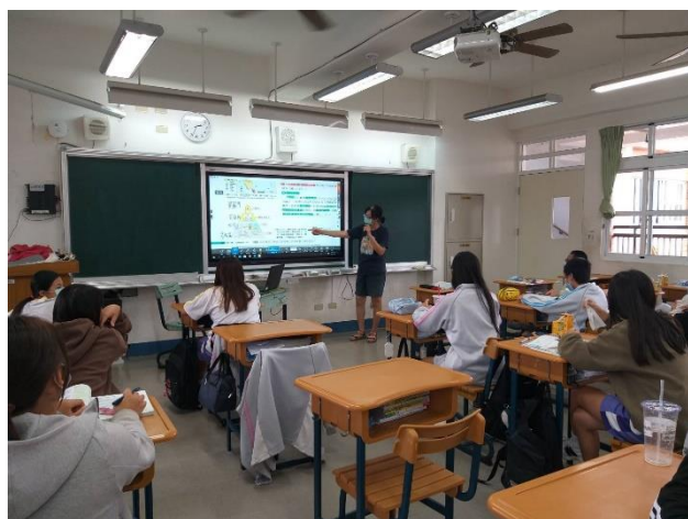
課堂上讓學生作業、學習單、小考、分組報告的方式進行多元評量。