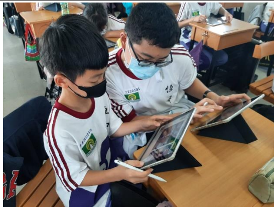
說明：數位化教學活動。