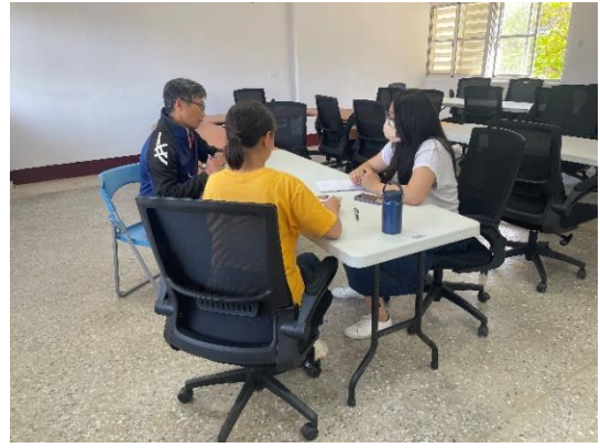
說明：教師小組備課