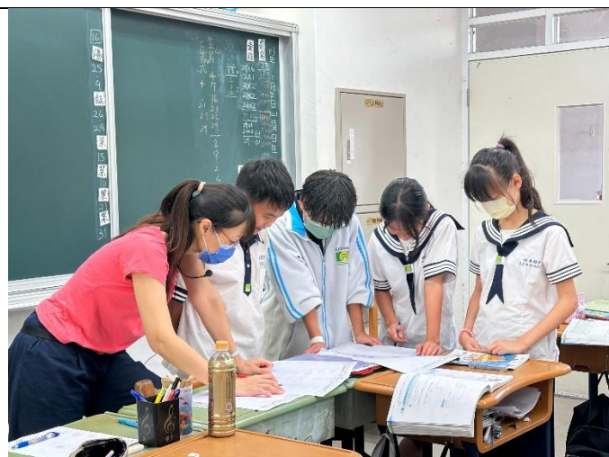
多元評量及課後輔導