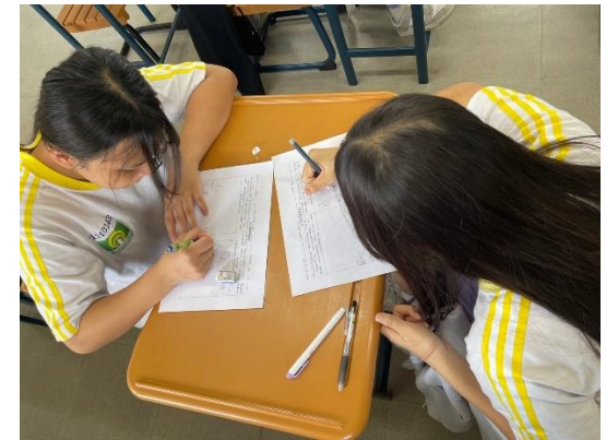
說明：學生合作書寫學習單。