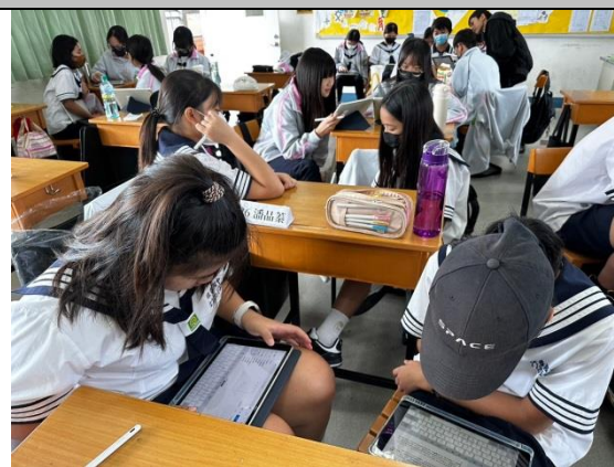
運用平板進行創作