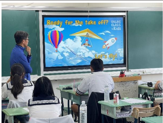
說明：教師運用數位設備進行教學。