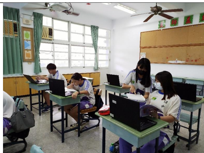
善用教學資源進行教學