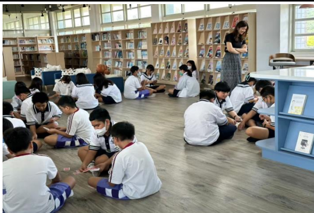
說明：康樂性社團(七年級桌遊社)