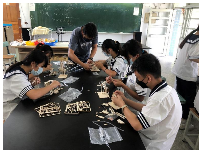
指導學生實際動手操作