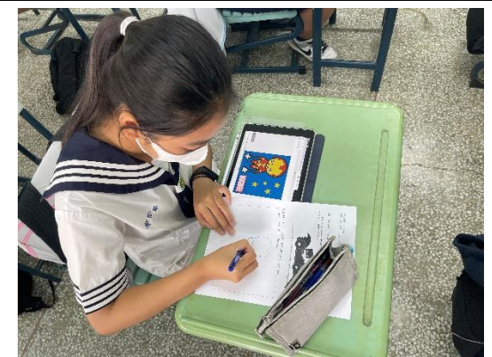
說明：學生運用數位教具書寫學習單。