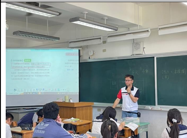
說明：課程教學實況