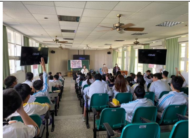
說明：宣導講座(防癌教育宣導)