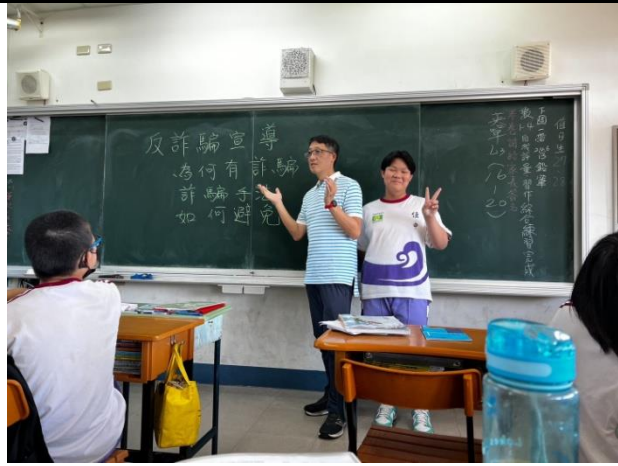
說明：班會反詐騙議題討論