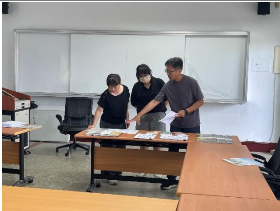
說明：教師檢視學生學習作品。