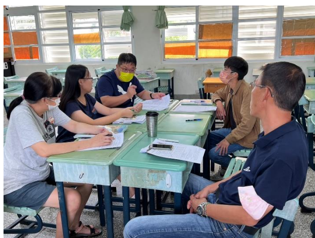
地理、歷史、公民三科教師透過備課、觀課、議課的方式，挑選主題分別進行教學