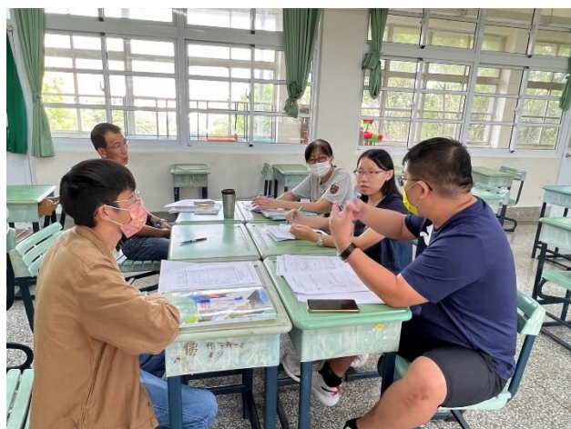
地理、歷史、公民三科教師透過備課、觀課、議課的方式，挑選主題分別進行教學