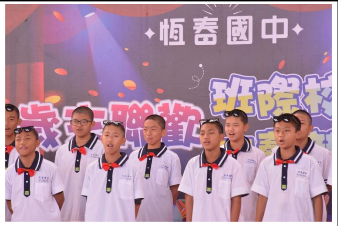
說明：七年級校歌比賽