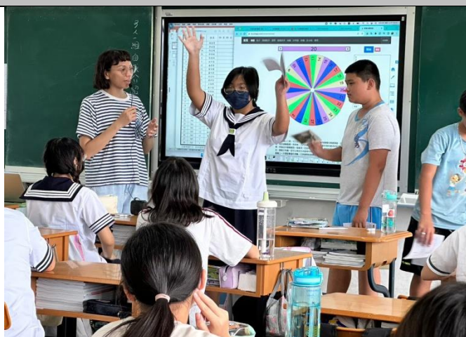
說明：學術性社團(七年級跨域美感社)