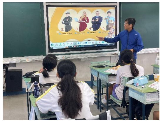
說明：生涯發展規劃教育融入教學活動。