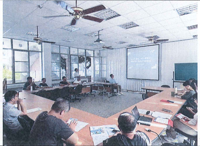
照片內容說明：特推會開會實況