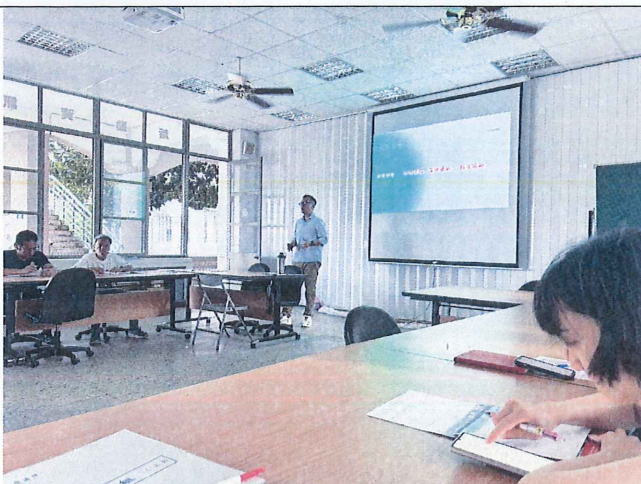
照片內容說明：特推會開會實況