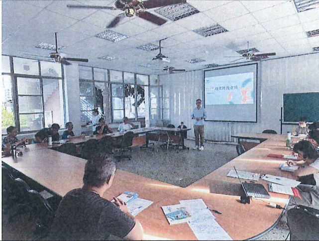
照片內容說明：特推會開會實況