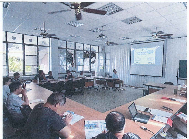
照片內容說明：特推會開會實況