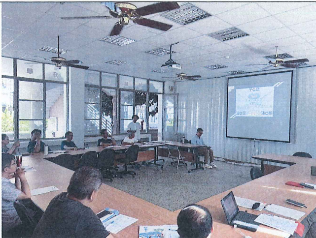
照片內容說明：特推會開會實況