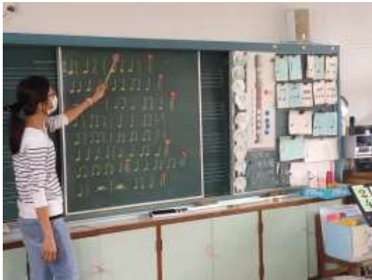
說明：教師依據樂曲長度及內容設計節奏型。