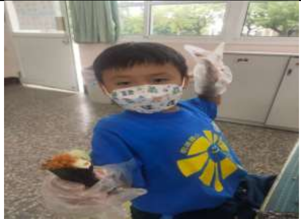
說明：品嚐豆芽海苔飯捲(結合家庭教育)