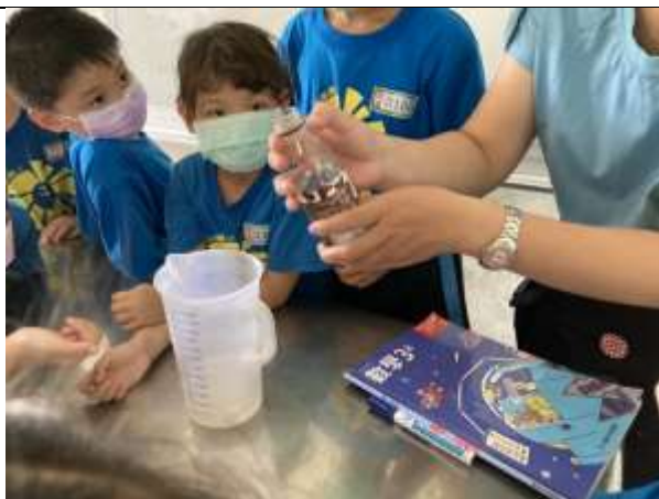
說明：具體物操作學習