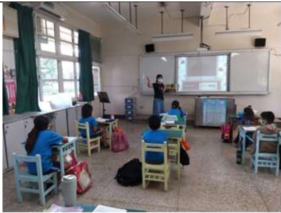
說明：利用繪本進行課程