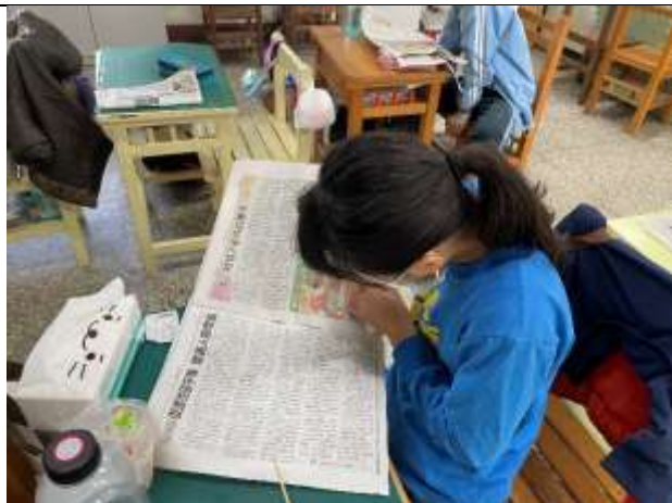
說明：學生先讀國語日報