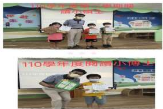
說明：閱讀的力量一點一點累積起來