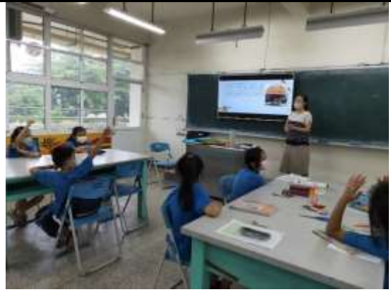
介紹前進里施娘娘的故事