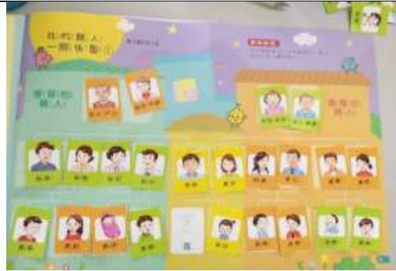
說明：自己排出自己的家族譜