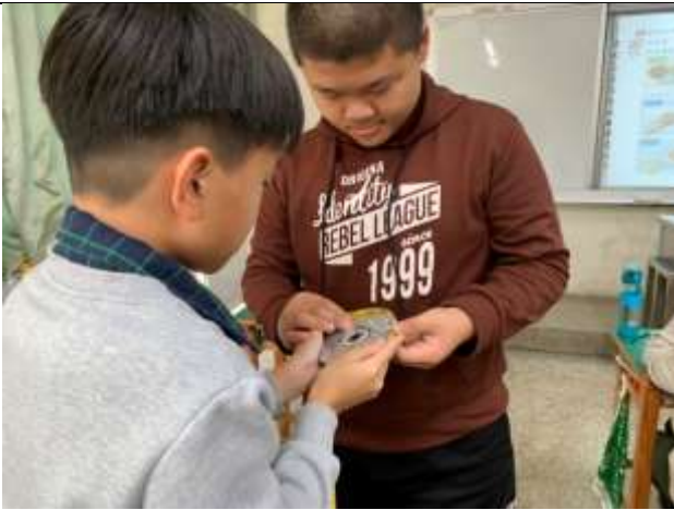
說明：學生實際測量圓周率