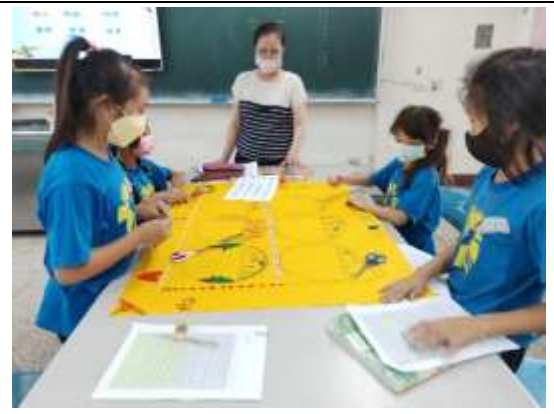
分組完成巡視指導