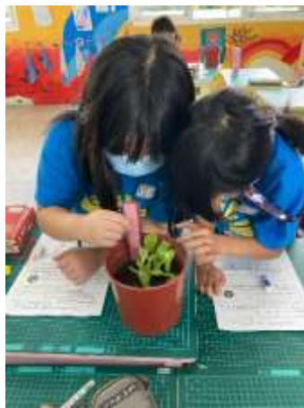
說明：測量植物(公分)