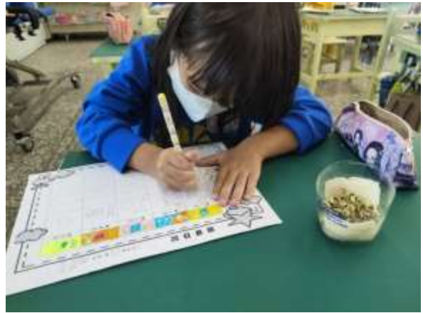
說明：紀錄豆芽的生長