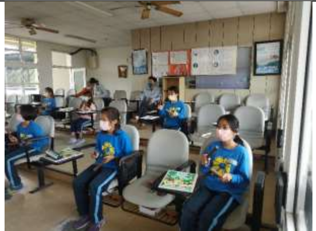
說明：準備活動-跟著音樂一起敲打節奏