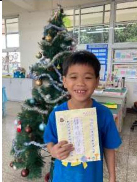
說明：完成卡片信封