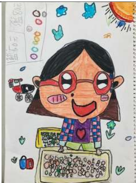
說明：繪製家長職業