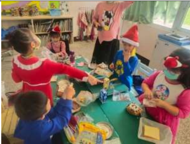
說明：品嚐焗烤豆芽披薩(結合家庭教育)