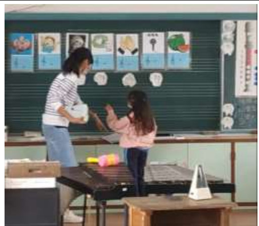
說明：上台尋找樂曲中出現的音名素材