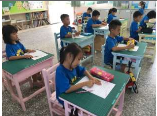
說明：基本形狀討論