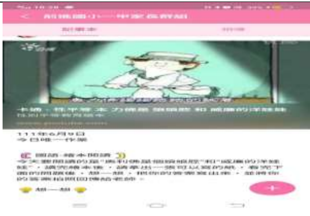
說明：防疫期間親子閱讀-結合性平