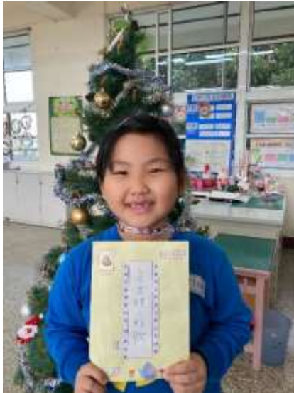
說明：完成卡片信封