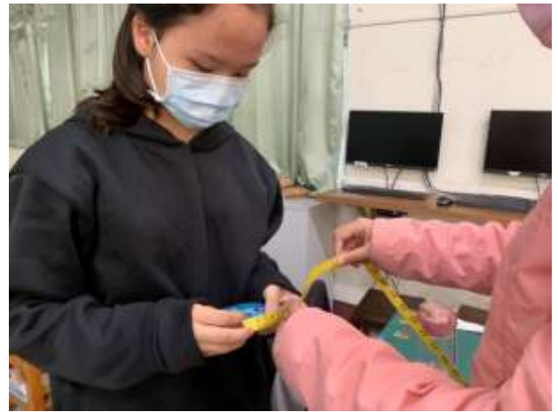
說明：學生實際測量圓周率