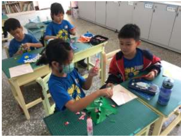
說明：基本形狀討論