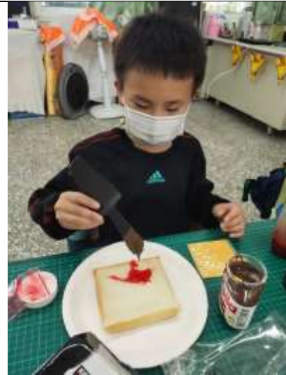
說明：製作營養三明治