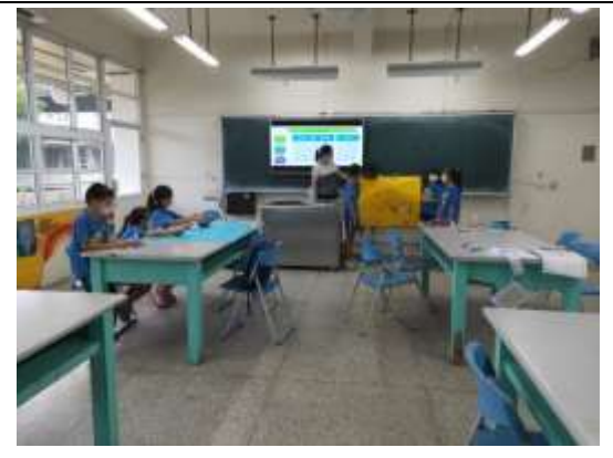
小組上臺分享報告