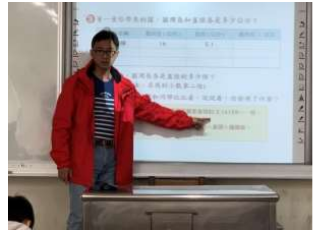
說明：教師說明圓周率測量的結果