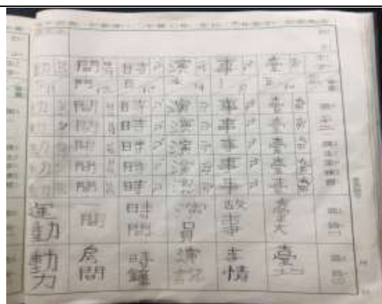
說明：不斷的練習造詞後，寫作業不再是難事。