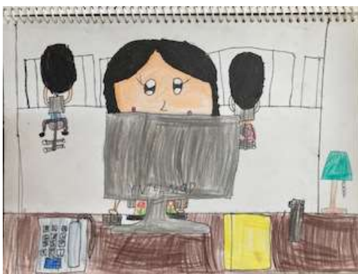
說明：繪製家長職業