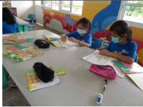
說明：分組準備牌卡