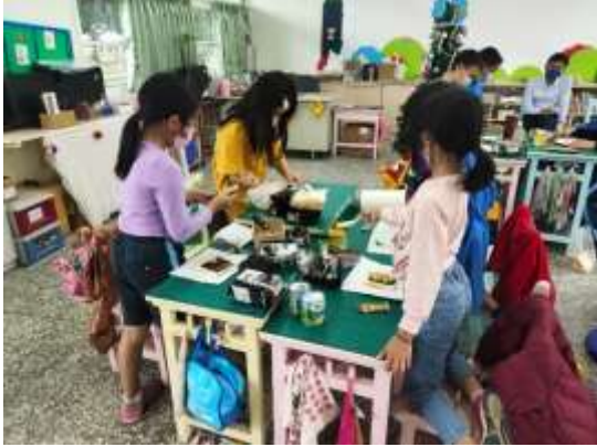
說明：工作分配及準備