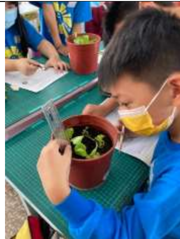
說明：測量植物(公分)