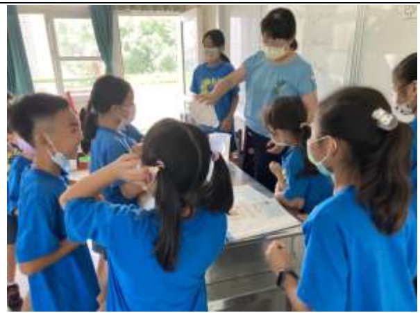
說明：利用教具進行量感教學