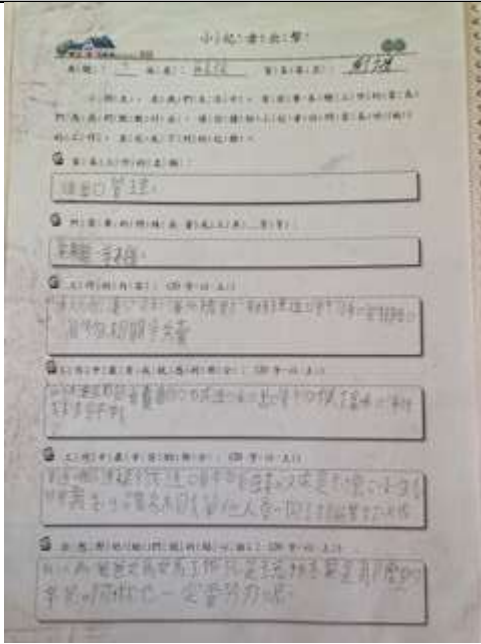
說明：家長職業訪問單