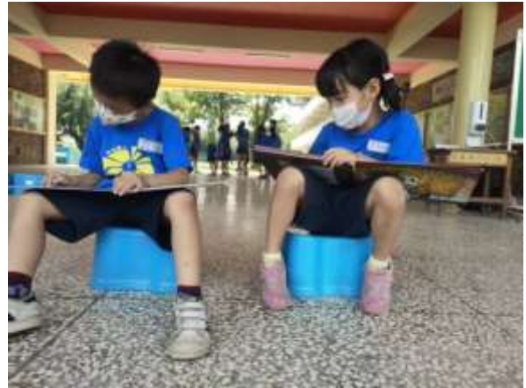
說明：雲水書坊到校巡迴