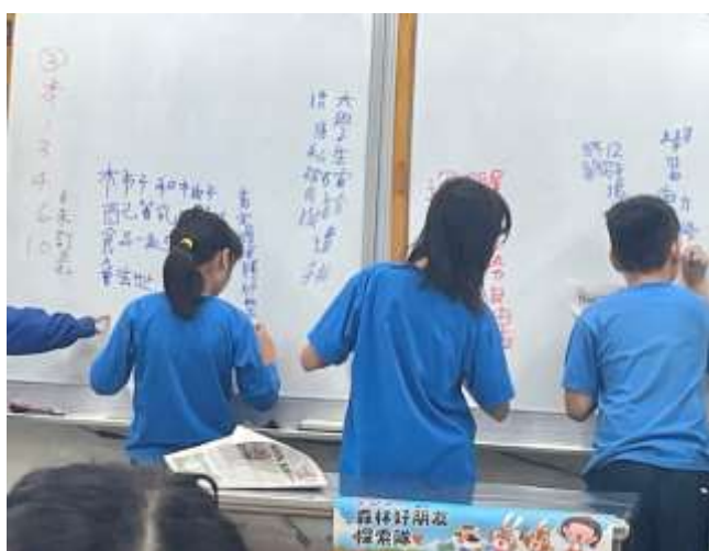
說明：上台寫出想要傳達給大家的訊息