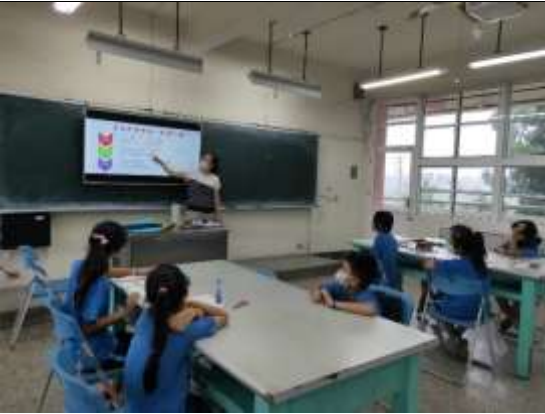
說明：認識故事結構