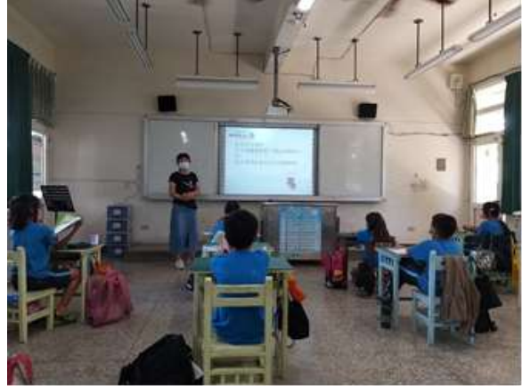
說明：進行班級討論