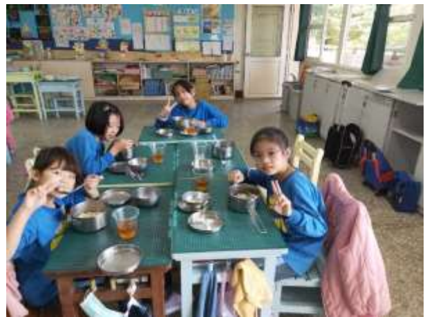
說明：品嚐美味的蔬菜麵