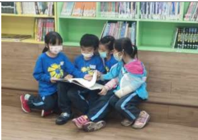
說明：小組共同閱讀