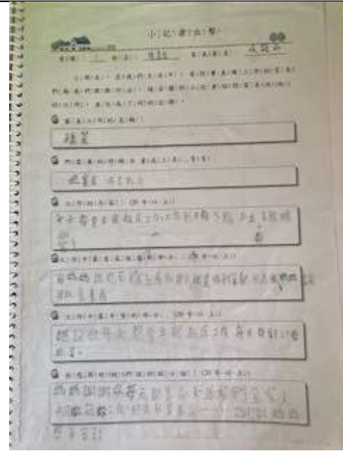
說明：家長職業訪問單