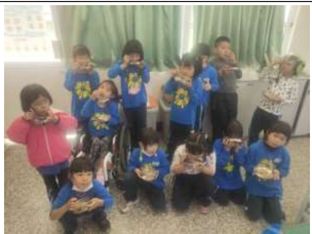
說明：品嚐炒豆芽(結合家庭教育)