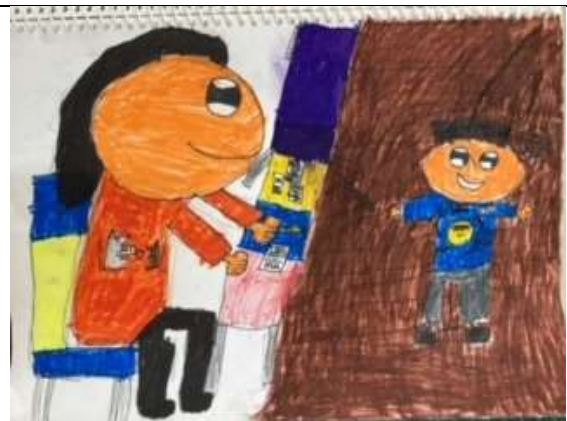
說明：繪製家長職業