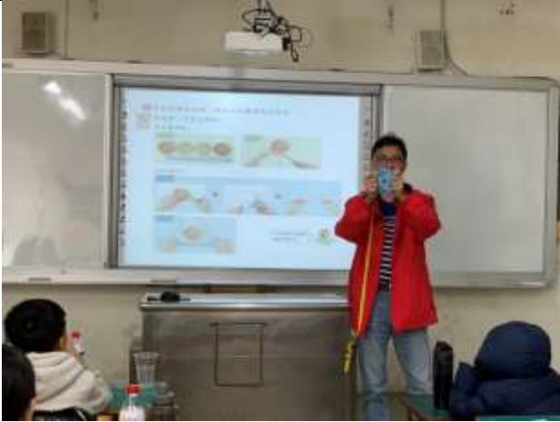
說明：教師說明圓周率測量的方法