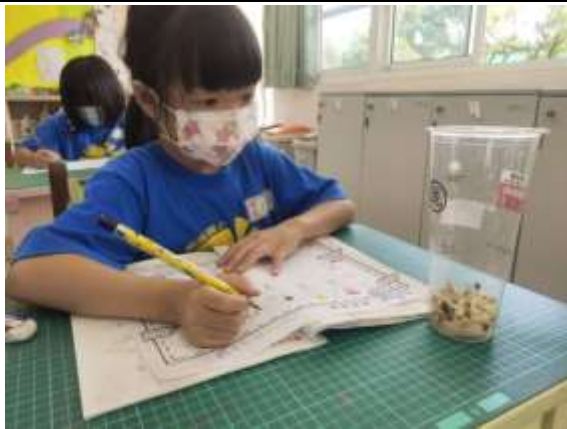
說明：觀察豆芽的生長