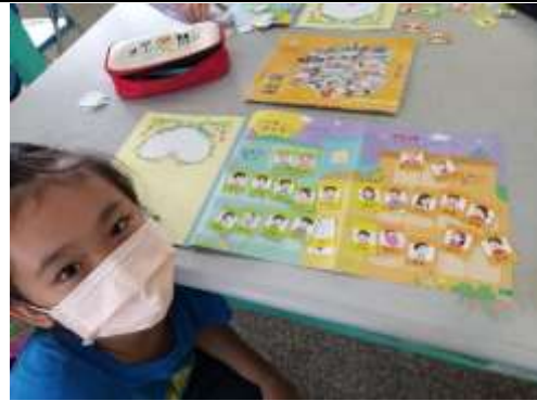
說明：跟自己的家族譜拍照