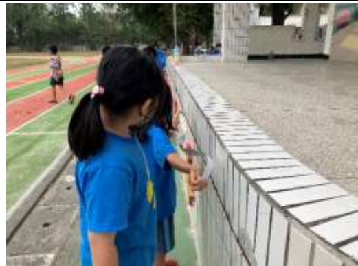
說明：測量司令台(公尺)