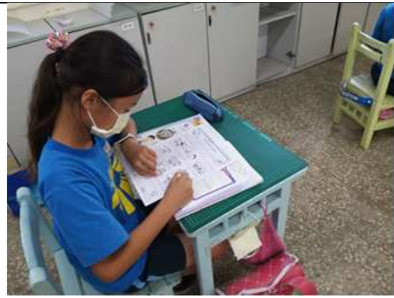
說明：學生填寫學習單