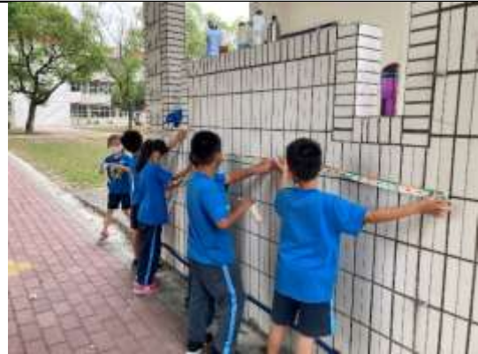
說明：測量司令台(公尺)