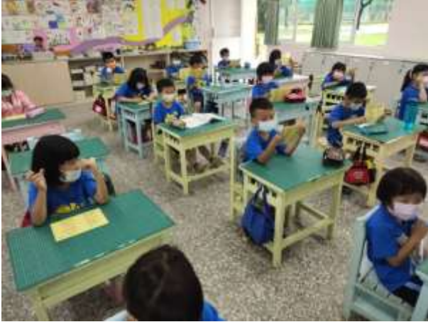
說明：古詩共賞及朗誦