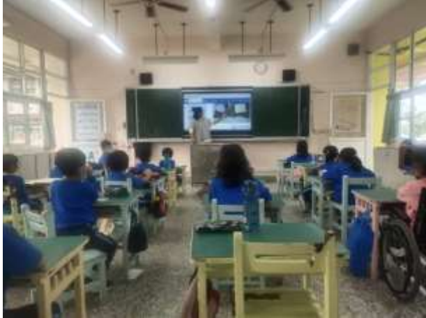
說明：了解豆芽的一生