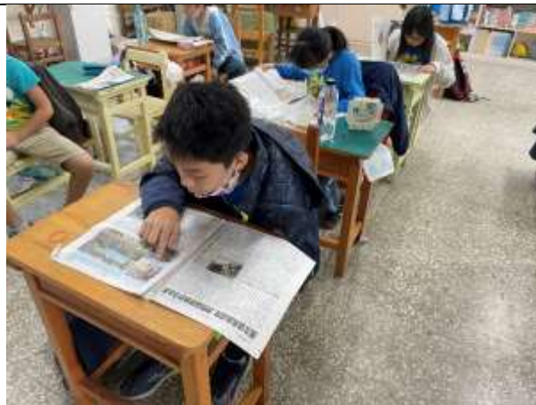
說明：學生讀國語日報