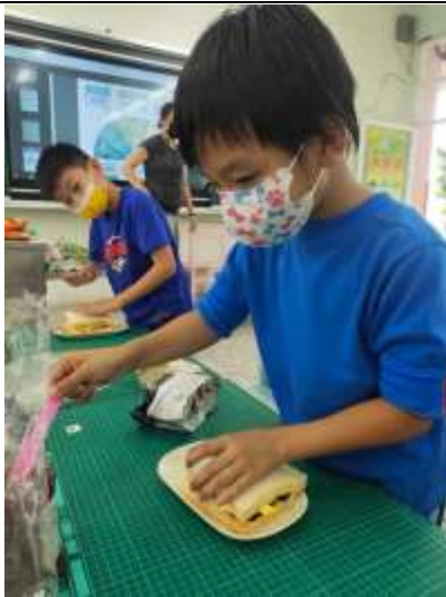
說明：製作營養三明治