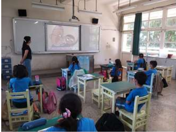
說明：觀看繪本動畫