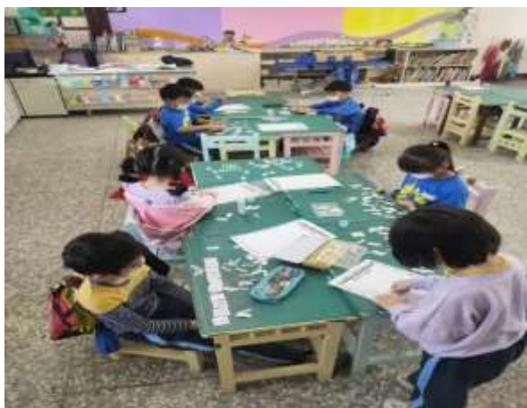
說明：部件識字-找尋生字並造詞