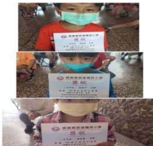
說明：鼓勵孩子參加校內語文比賽