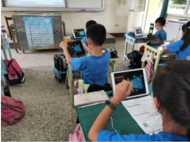
說明：利用均一教學平台進行自主學習