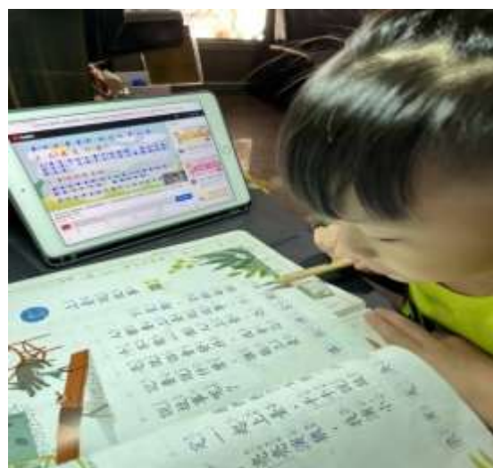
說明：利用輔助教材，讓孩子在家也能自學