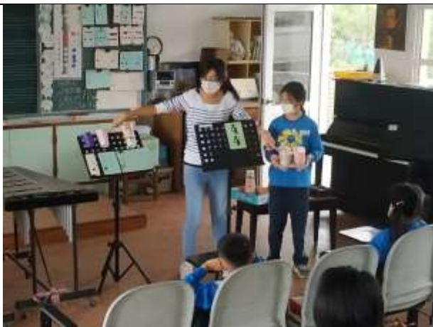
說明：以生活常見用品說明並複習拍號的意義