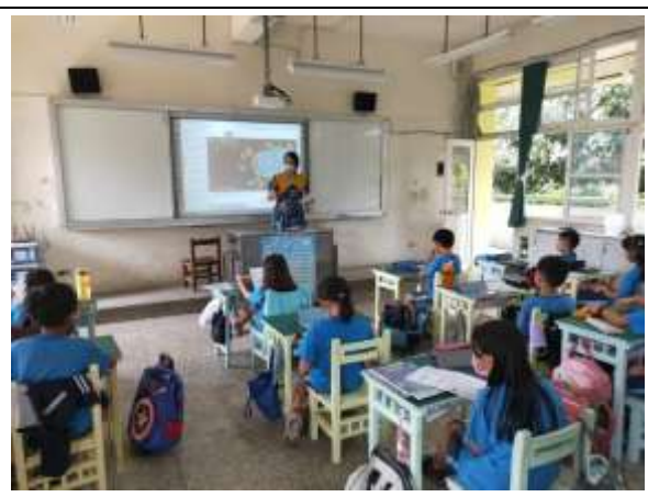
說明：迷思概念澄清