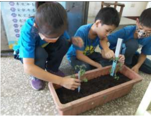
說明：仔細觀察紀錄