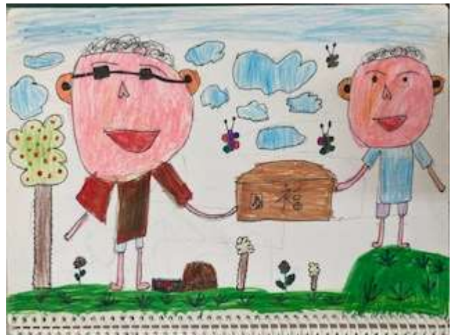
說明：繪製家長職業