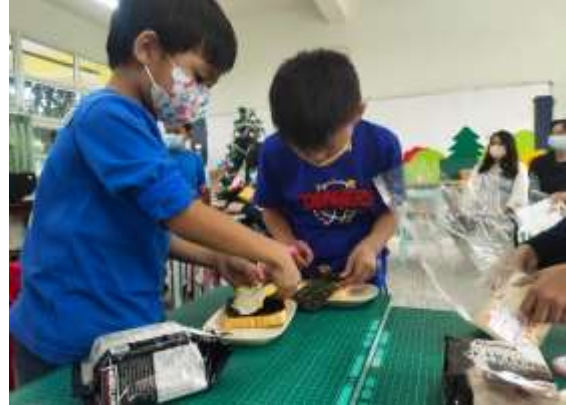
說明：製作營養三明治