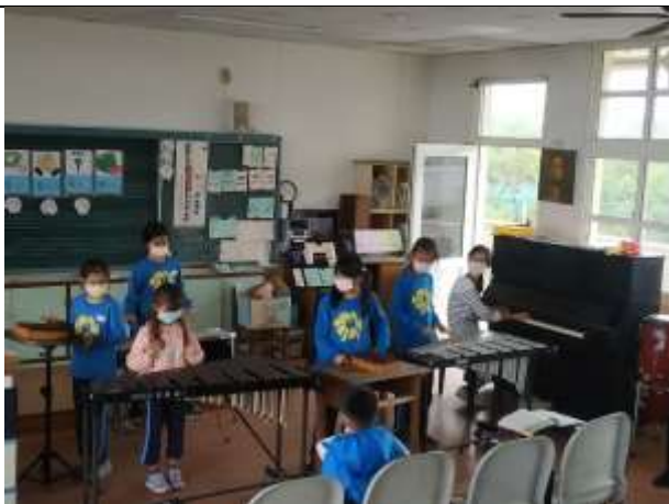
說明：大家一起來合奏