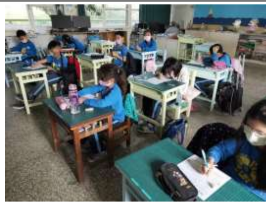
說明：學生填寫學習單