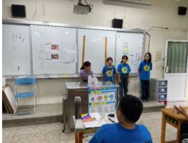
說明：分小組上台分享讀報心得