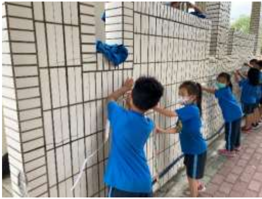
說明：測量司令台(公尺)