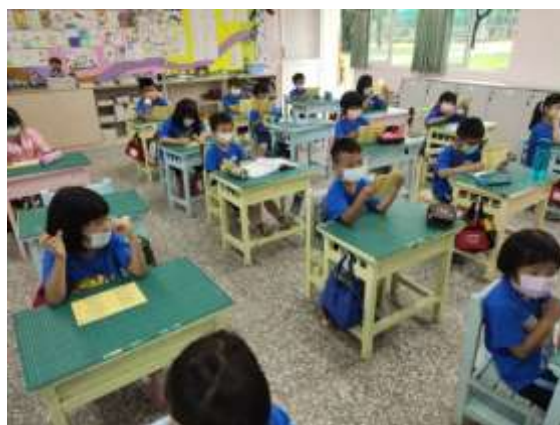
說明：兩週一次古詩欣賞