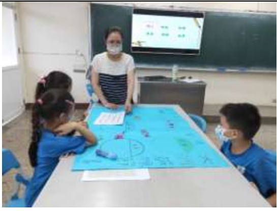
說明：分組完成巡視指導