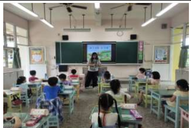
說明：全班共讀-結合生命教育