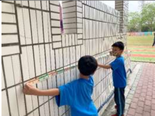
說明：測量司令台(公尺)