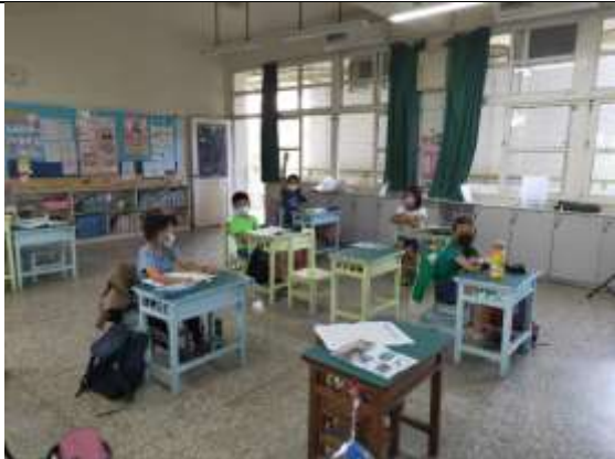
說明：學生發表討論