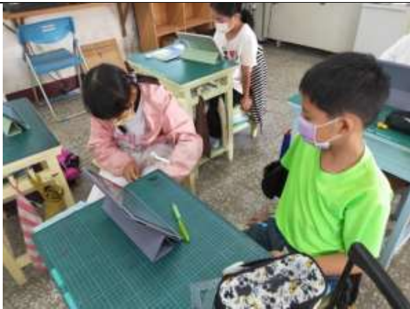
說明：互相討論學習