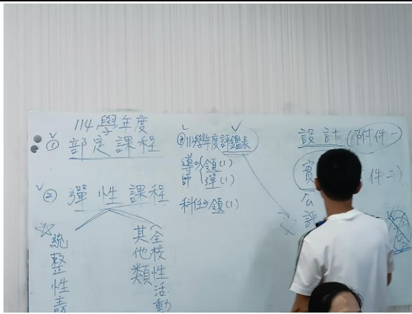
說明：教學組長說明課程計畫編寫要點