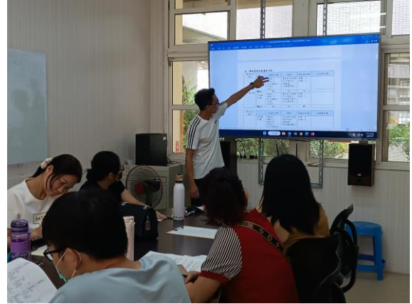
說明：教學組長說明課程計畫編寫要點