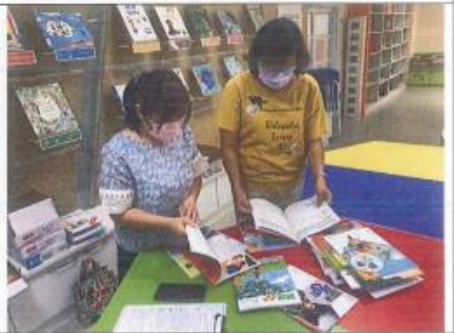
各位委員評選 111 學年度教科書情形