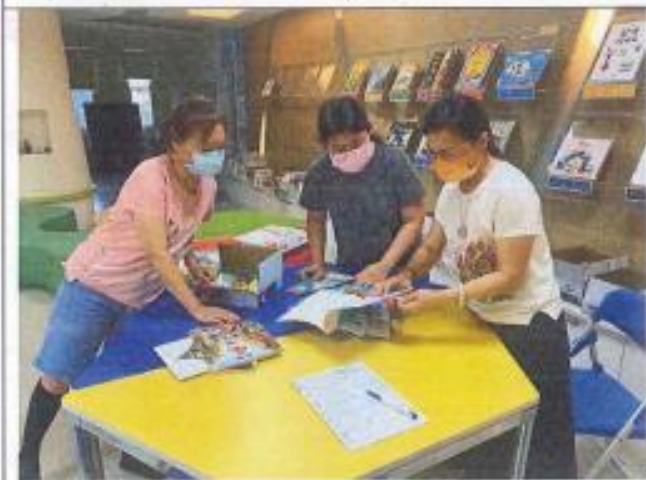
各位委員評選 111 學年度教科書情形