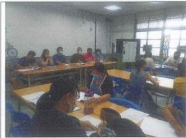
教科圖書用書評選事宜說明