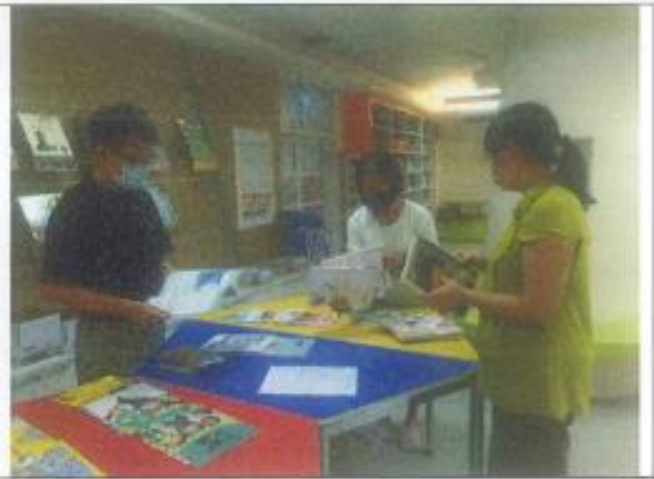
各位委員評選 111 學年度教科書情形