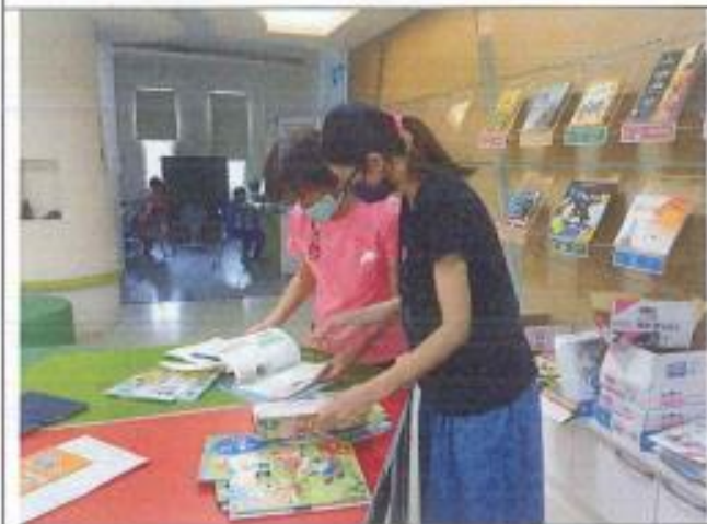
各位委員評選 111 學年度教科書情形