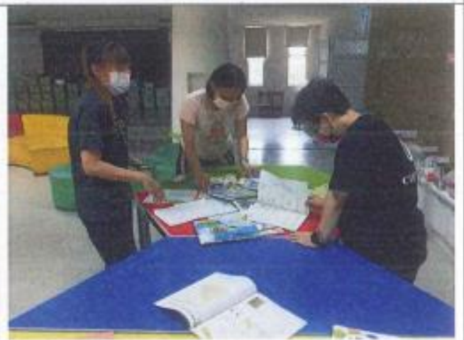
各位委員評選 111 學年度教科書情形