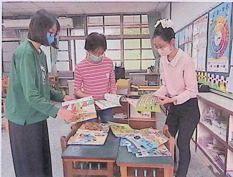
各領域委員評選 114 學年度教科書情形