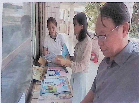
各領域委員評選 114 學年度教科書情形