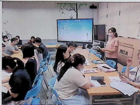
教科圖書用書評選事宜說明