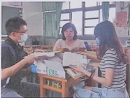
各年級委員評選 114 學年度教科書情形