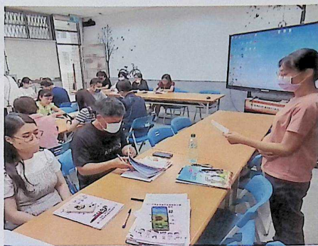
教科圖書用書評選事宜說明