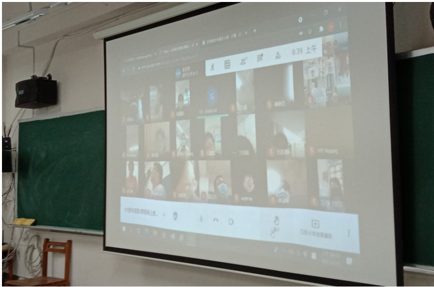
本次會議採 Meet 視訊方式進行