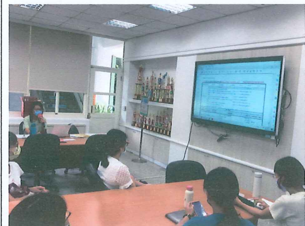
說明：審議特教課程計畫