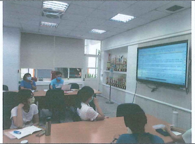
說明：審議各學年課程計畫撰寫內容