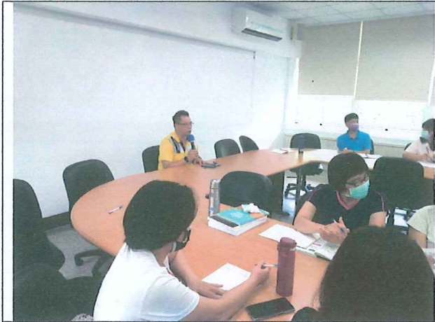
說明：召開本學期第三次課發會