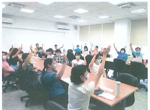
說明：委員通過課程計畫提案