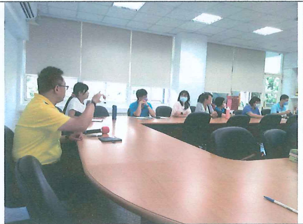
說明：審議校訂彈性實施內容與節次