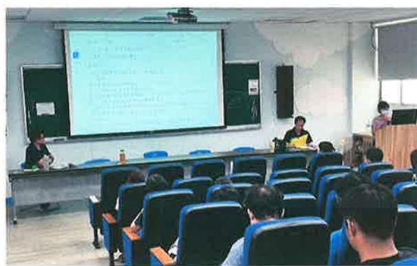
說明：學年代表上台分享實況