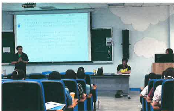
說明：針對學年報告，校長提供修正意見