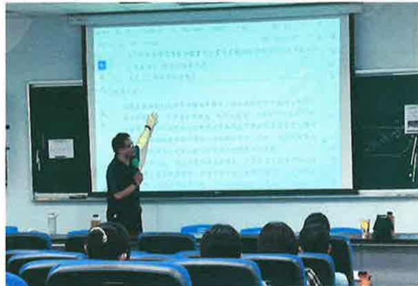
說明：對於會議議題，校長提供討論方針