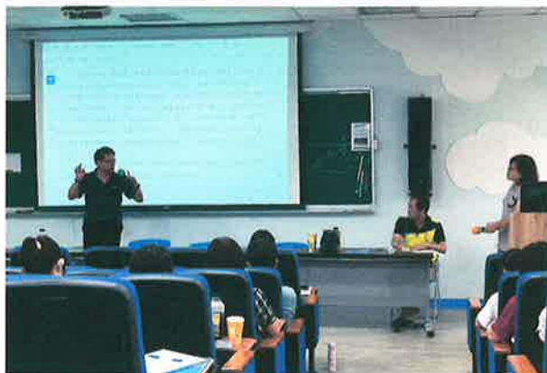
說明：校長主持課發會，與教師互動研討