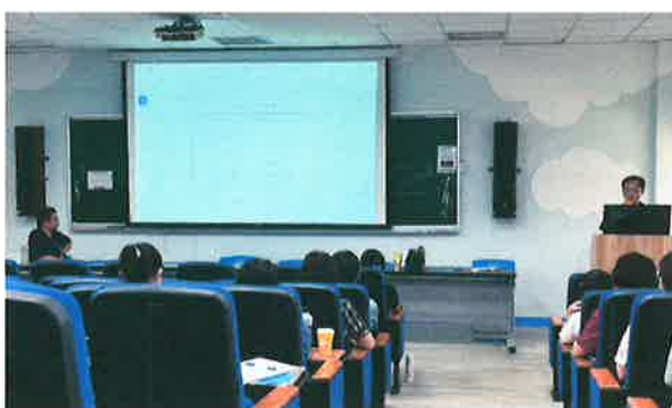
說明：審視各學年部定引導表件單元註記