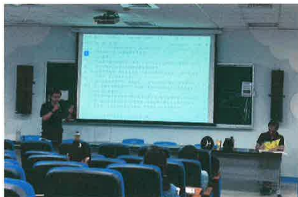
說明：校長主持綜合座談