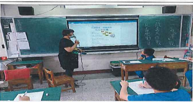
說明：拒絕毒品，遠離毒害。