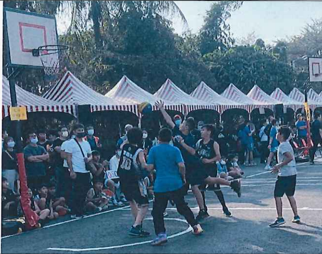
說明：學生對外參加比賽