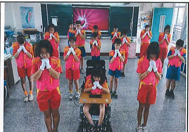
說明：以歌舞獻上母親節祝福。