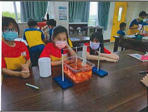
四年級毛細現象實驗