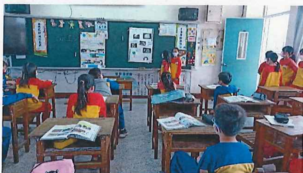
說明：小組成果發表。