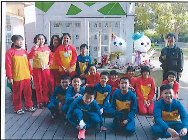
說明：配合節日活動設計雪人並展示。