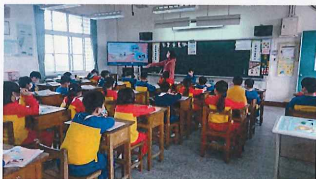
說明：學生認真聽老師講校園霸凌、隱私權。