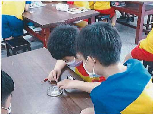
五年級液體導電性實驗