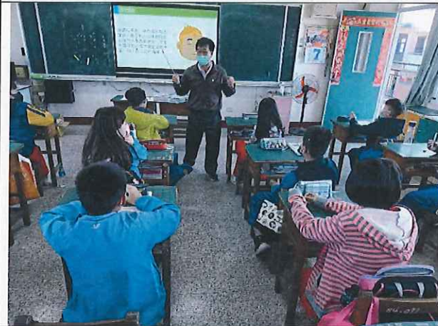
說明：毒害一生，青春不遺憾終身。