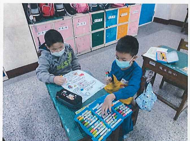
說明：分組完成學習單。