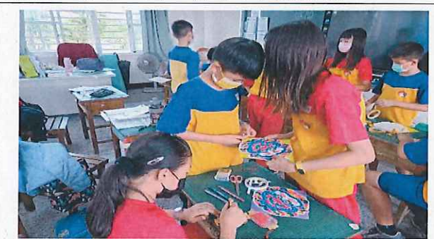
說明：母親節感恩詩詞製作