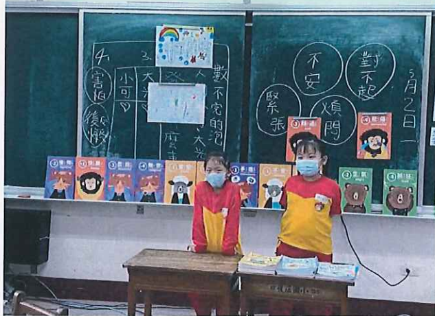
說明：學生上台發表。