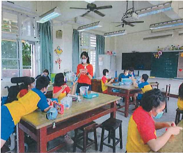
說明：學生實際完成美勞作品。