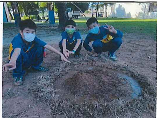
六年級水的侵蝕實驗