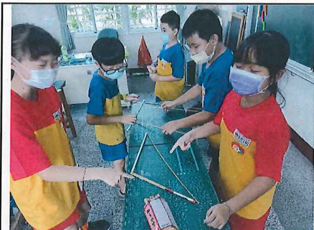
說明：用竹籤了解三角形的邊長關係。