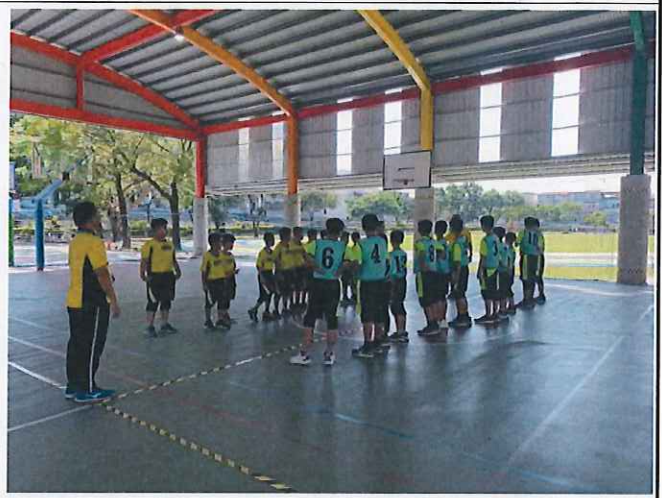
說明：學生對外參加比賽