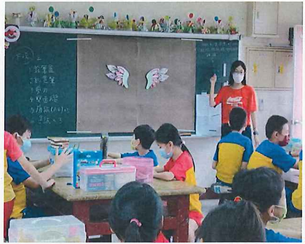
說明：老師講解美勞作品。