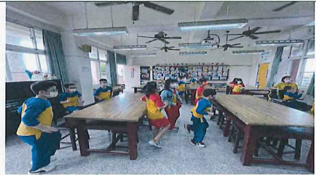
說明：學生認真參與舞蹈練習。