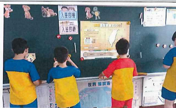
說明：各自把選項答案貼上。