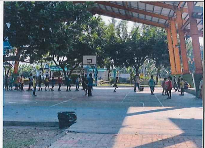
說明：體育課分組比賽