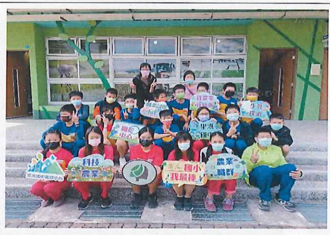
說明：里港國中職業探索。