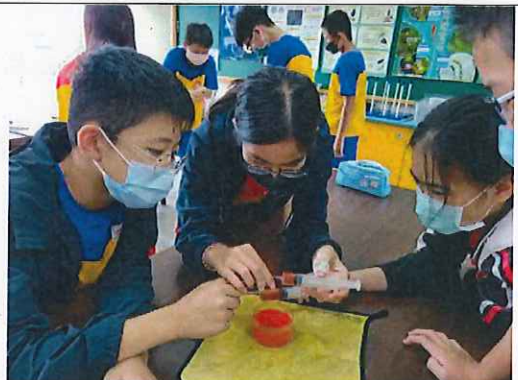
六年級流體動力傳送實驗