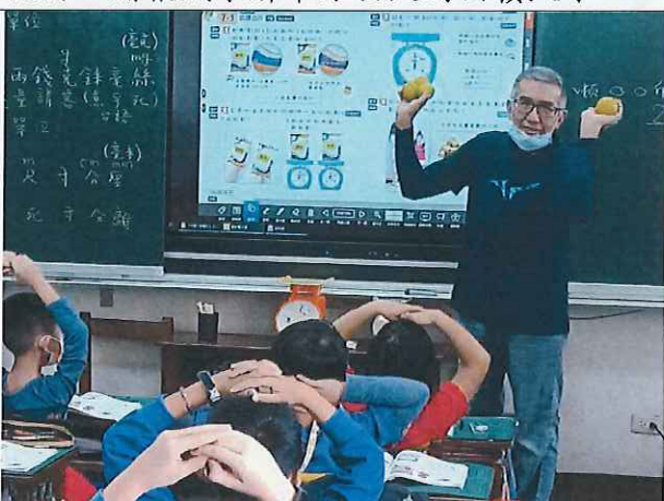
說明：實物比較重量。