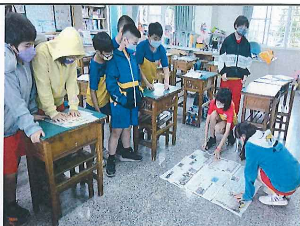
說明：鋪報紙了解平方公尺的面積大小。