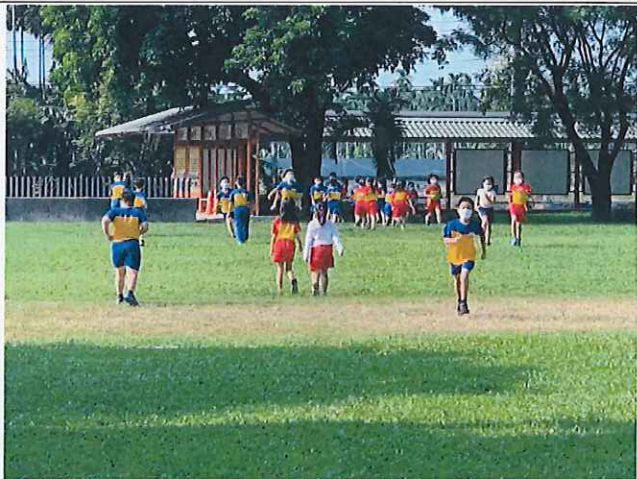
說明：利用課間時間跑步