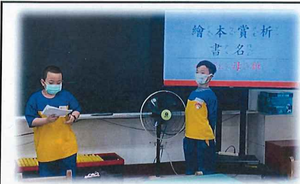
二年級同學分享讀書心得