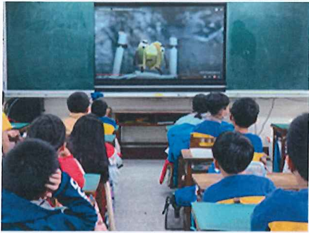
說明：學生認真觀賞影片