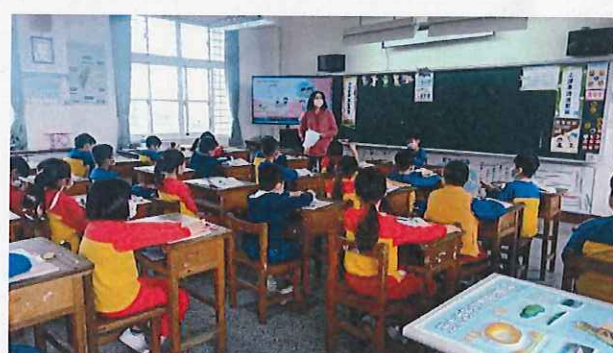
說明：學生認真聽老師講校園霸凌、隱私權。