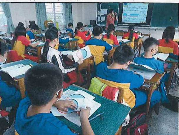
說明：實際操作中認知圓的面積。