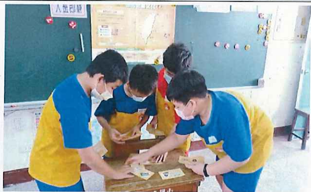
說明：發揮團隊精神，快樂學習找出答案。