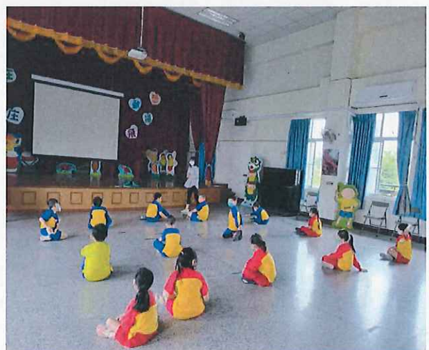
說明：配合學校母親節活動的表演練習。