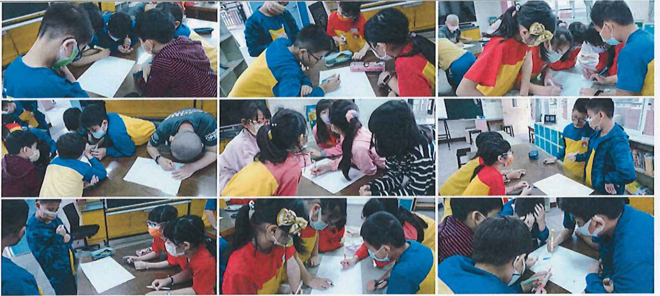
說明：分組討論，共同完成心智表