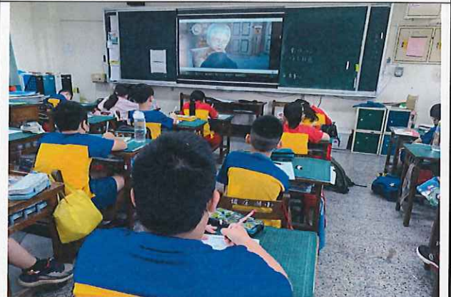
三年級運用媒體教學