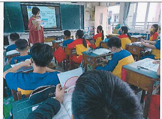
說明：數學公開授課。