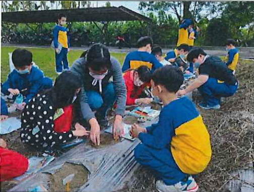
三年級植物生長種菜體驗