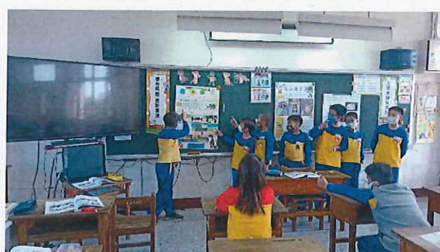
說明：小組成果發表。