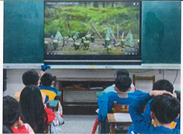
說明：學生認真觀賞影片