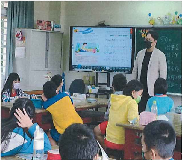
說明：音樂老師講解樂理。