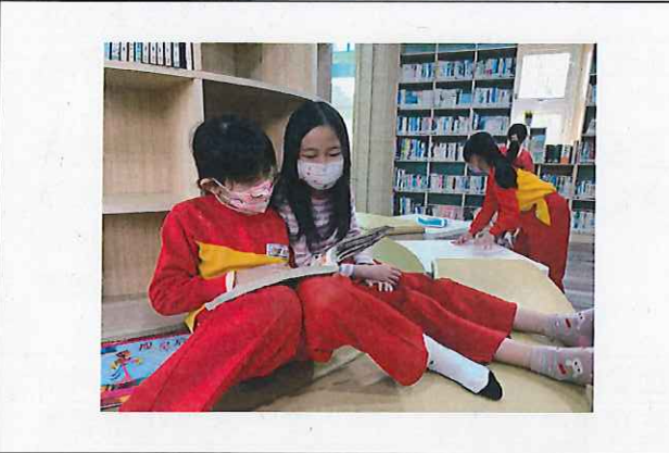
三年級圖書室閱覽