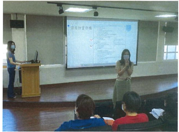
課程計畫上傳期程說明