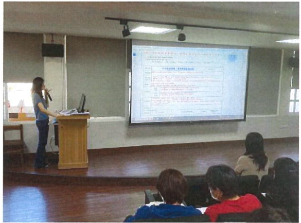
課程評鑑表件說明