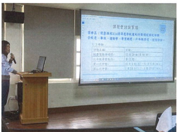
重大行事排定日期