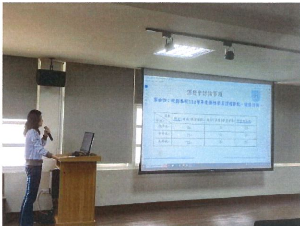
各年段彈性節數討論