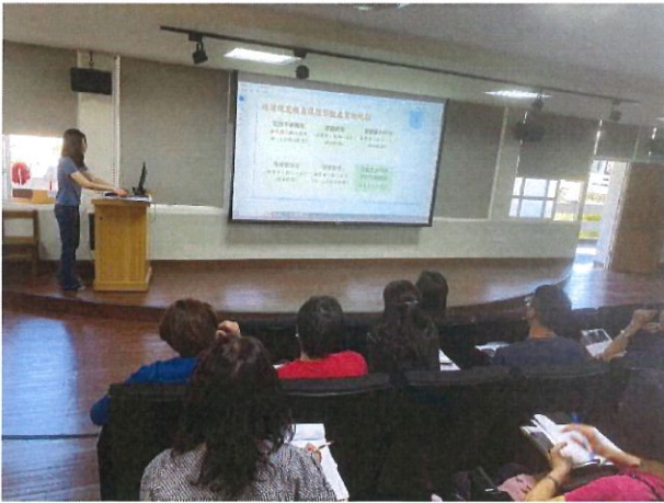
法定議題課程規畫