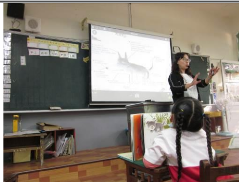
說明：「我和我家附近的野狗」故事的引導