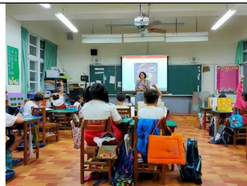
說明：「巴警官與狗利亞」共讀