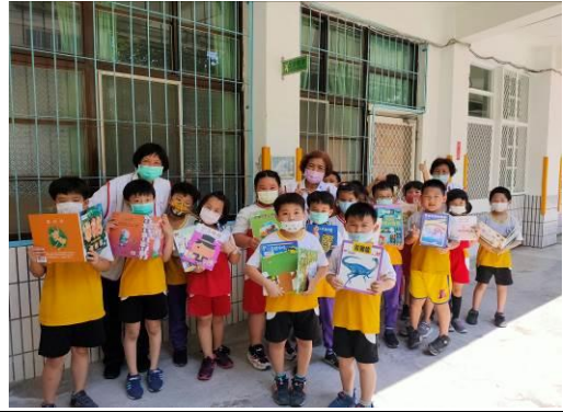
說明：雲水書車借閱圖書