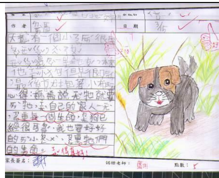
說明：讀書心得的優良作品

(請針對整體課程實踐之省思/課程設計與教學策略之策進方案/未來專業成長規劃與需求……等面向，具體描述，給予回饋)