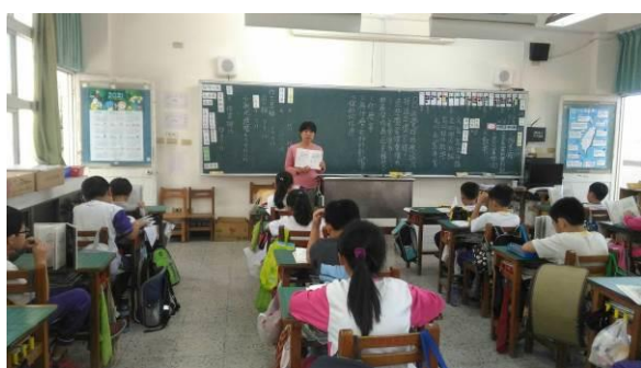
說明：學生共讀書籍