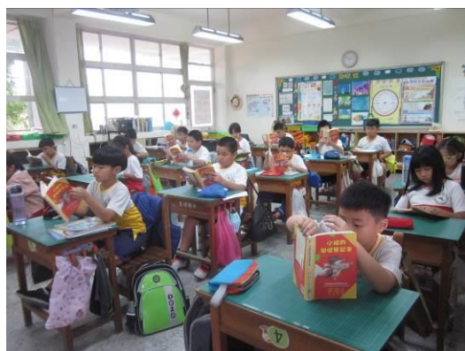
說明：學生共讀書籍