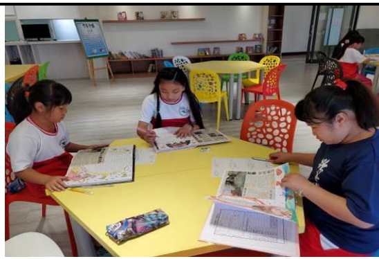
說明：剪報高手分享與回饋