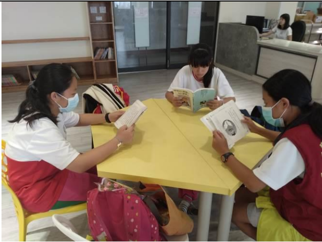
說明：閱讀共讀書箱-我是爸媽的照相機