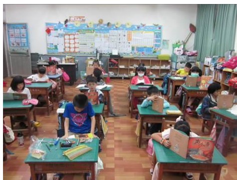
說明：「南瓜湯」晨間共讀