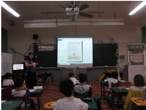
說明：「一片披薩一塊錢」學習單的引導