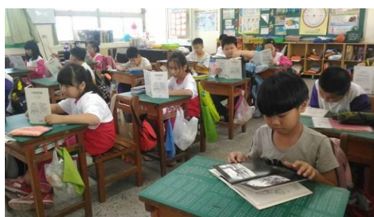
說明：學生共讀書籍