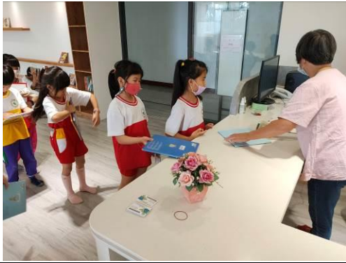
說明：閱讀課至圖書館借書