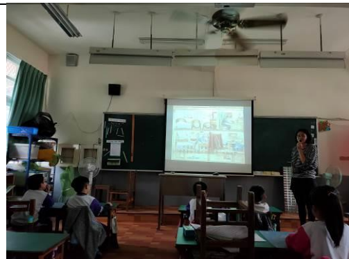
說明：「爺爺一定有辦法」共讀

(請針對整體課程實踐之省思/課程設計與教學策略之策進方案/未來專業成長規劃與需求……等面向，具體描述，給予回饋)