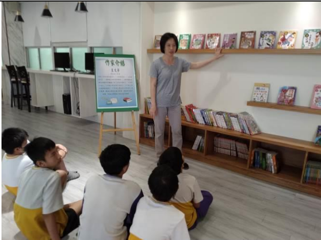
說明：閱讀共讀書箱-誰能在馬桶上拉小提琴