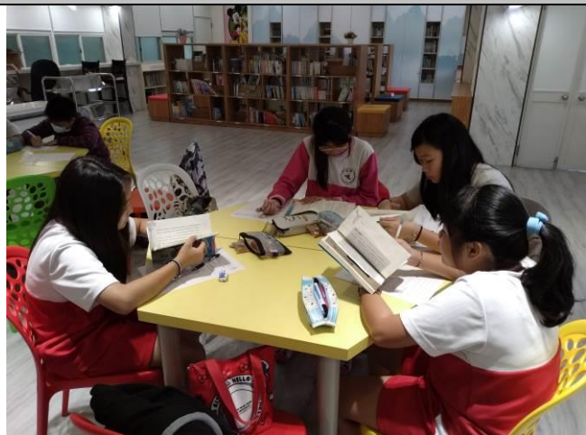
課程實踐歷程紀錄(課堂學習活動照片、學生成果照片等)