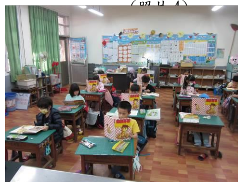
說明：「超級哥哥」晨間共讀