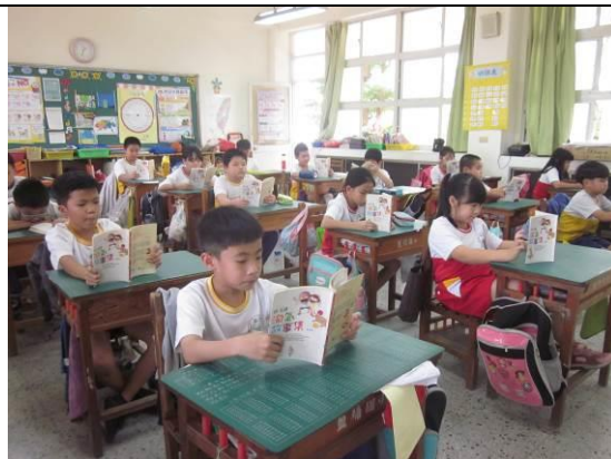
說明：學生共讀書籍