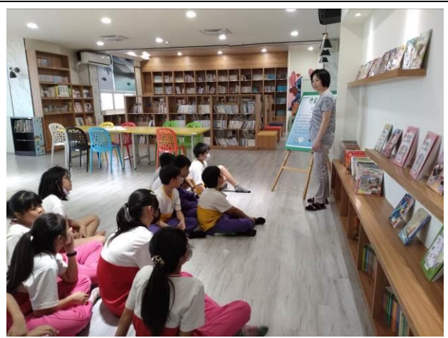
說明：閱讀共讀書箱-拜託拜託土地公