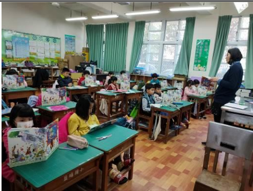
說明：「拚被人送的禮」共讀