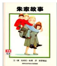
封面圖 事封面及 能發生的