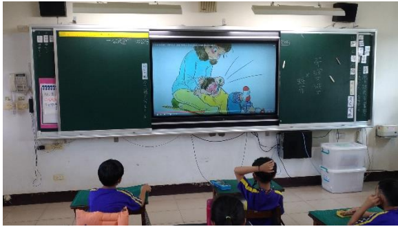
說明：學生觀看牙齒保健影片(2)