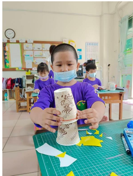
說明：彈跳紙杯～創意紙杯看誰跳得高