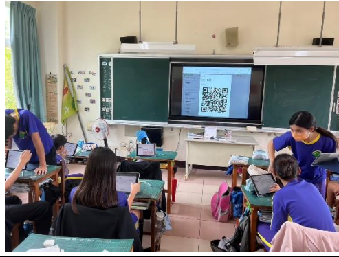
說明：上網搜尋資料並統整