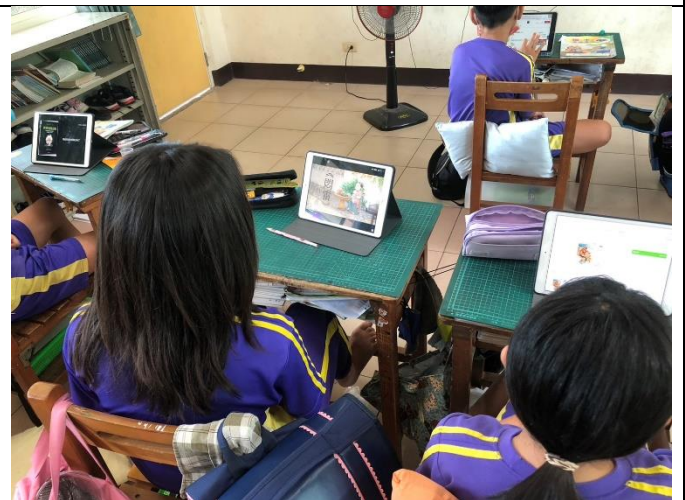
說明：平板有聲書(二)