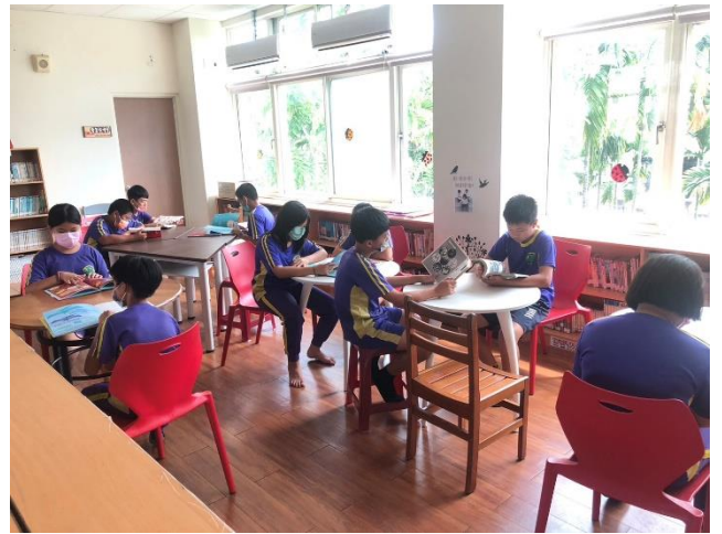
說明：圖書室閱讀(二)