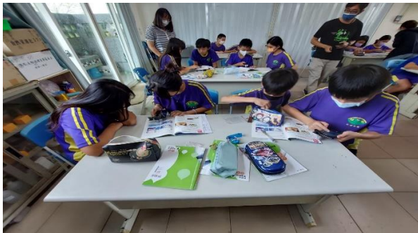
說明：學生操作手機顯微放大鏡投。