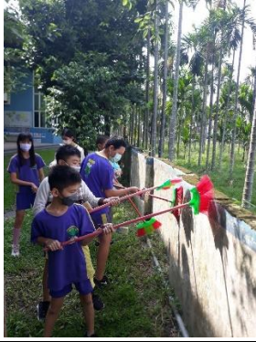
說明：畢業活動，一起彩繪學校圍牆