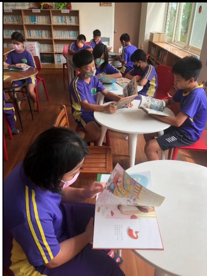
說明：圖書室閱讀(一)