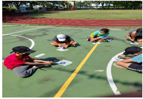
說明：學生操作放大鏡聚光點火實驗。