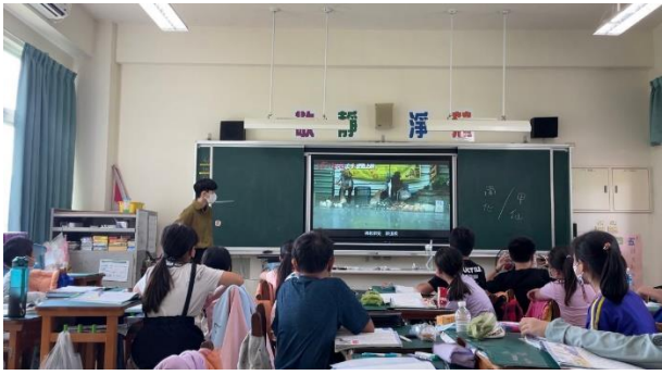
說明：播放相關電影預告