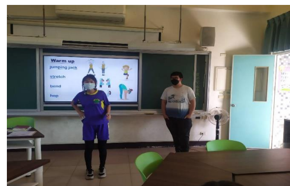
說明：英文版暖身操