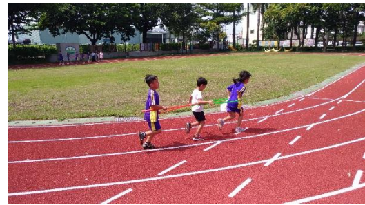
說明：體育課全班進行呼拉圈遊戲(2)