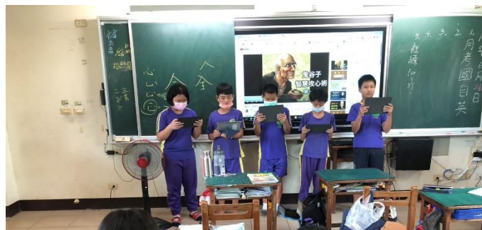
說明：使用平板，小組好書分享(一)