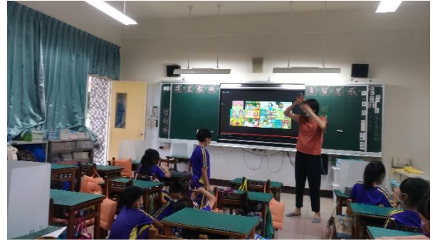
說明：教師提問後，跟學生共同檢討答案