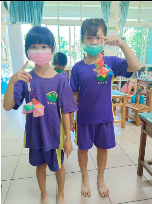
說明：端午節活動～祝好事包「粽」