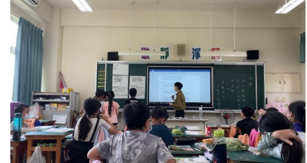
說明：小組上台發表。