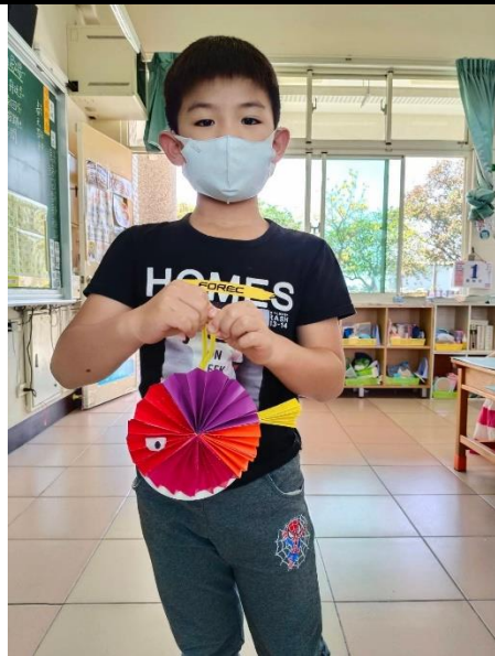
說明：過年活動～說吉祥話，年年有「餘」