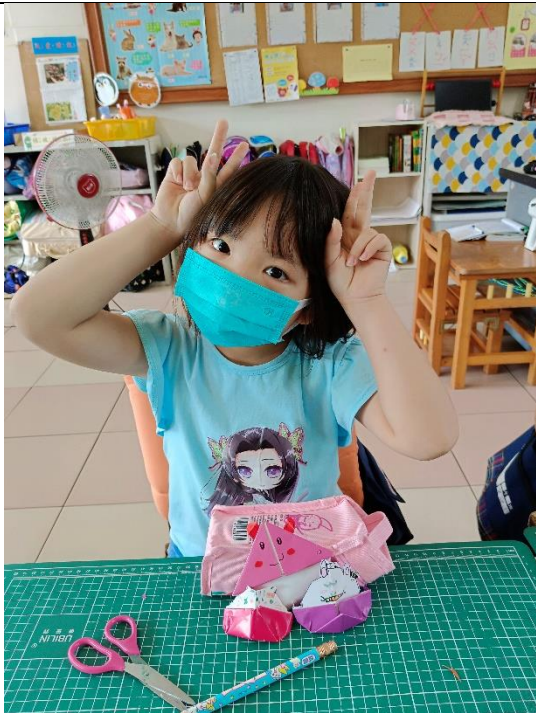
說明：書籤～當個閱讀高手