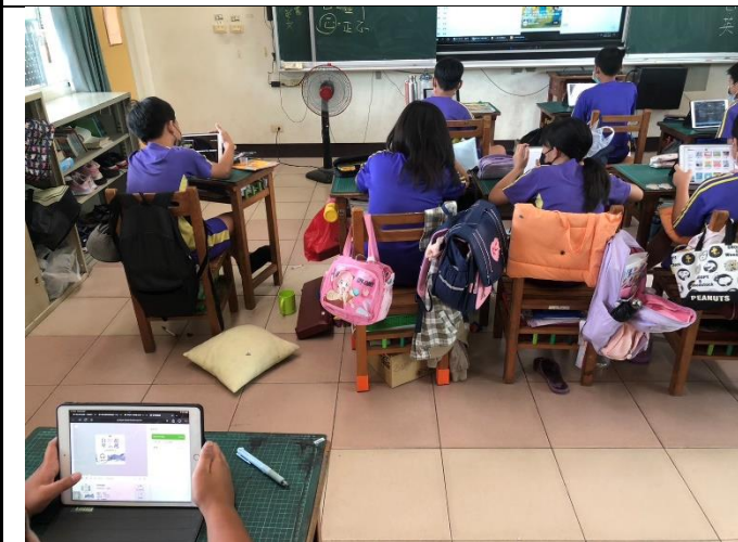
說明：平板有聲書(一)