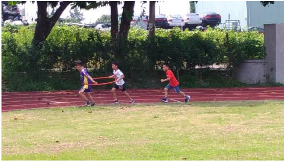
說明：體育課全班進行呼拉圈遊戲(1)