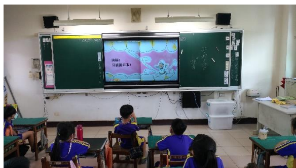
說明：學生觀看牙齒保健影片(1)