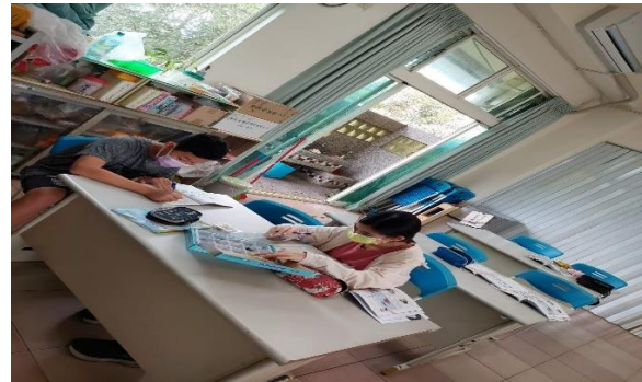
說明：學生觀察各種礦物