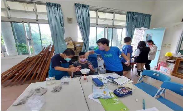
說明：學生操作熱傳導實驗。