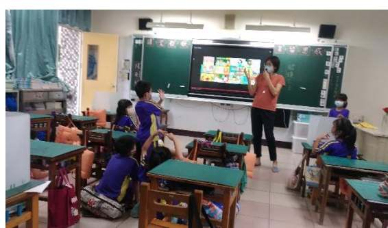
說明：教師提問，請學生作答