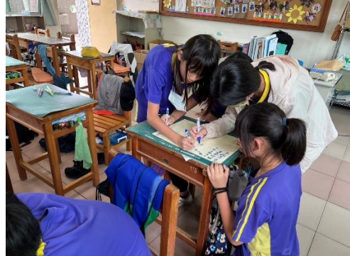
說明：小組討論與組內共學