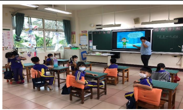
說明：聖誕節由來講解