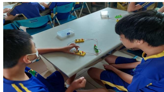
說明：學生操作電器串聯與並聯實驗。