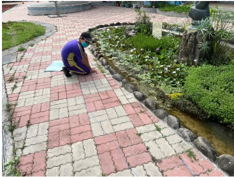
說明：觀察並記錄校園生態池的問題