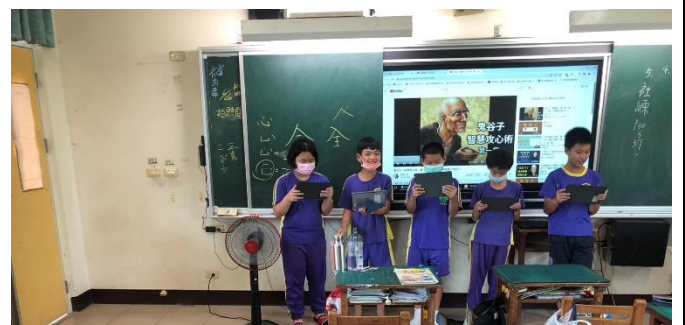
說明：使用平板，小組好書分享(二)