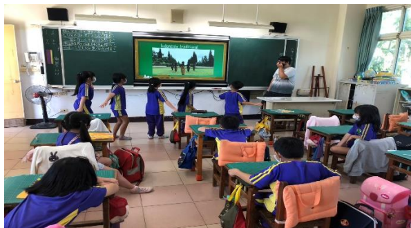
說明：認識老師的國家