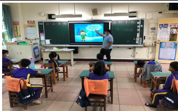
說明：聖誕節由來講解