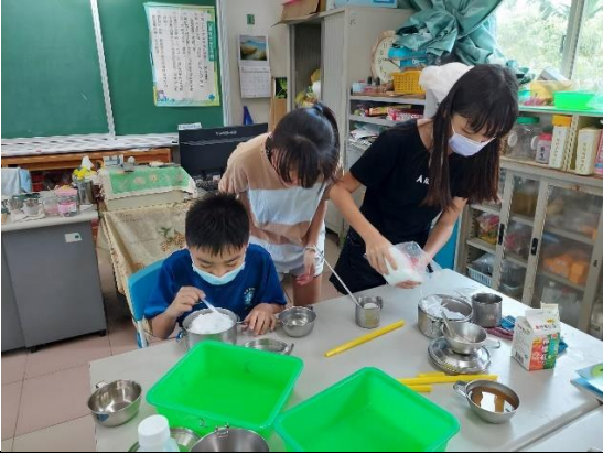
說明：學生製作結冰實驗。