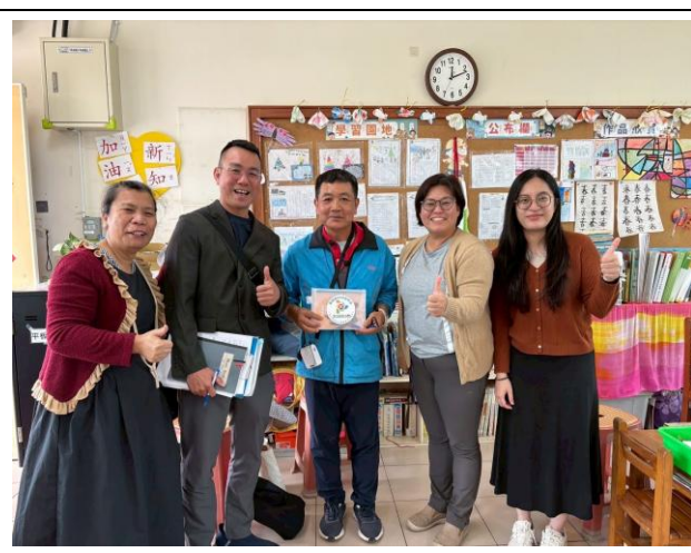
說明：與本土語文訪視委員合照。