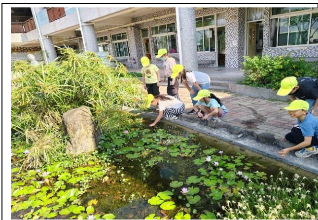
說明：四甲觀察水生生物