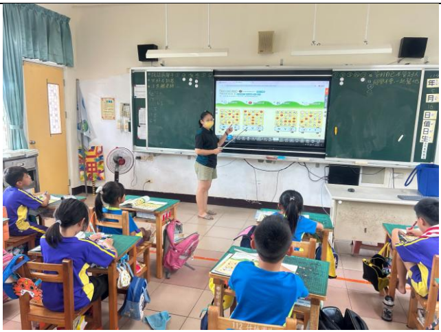
說明：低年級學生透過遊戲學英語單字發音。