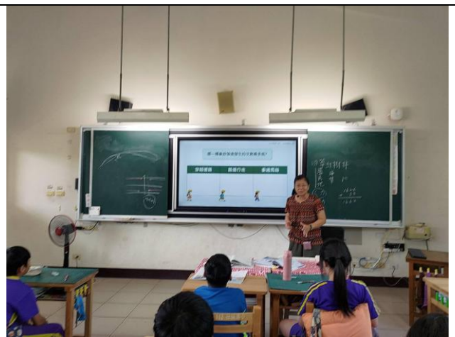
說明：五年級交通安全教育教學