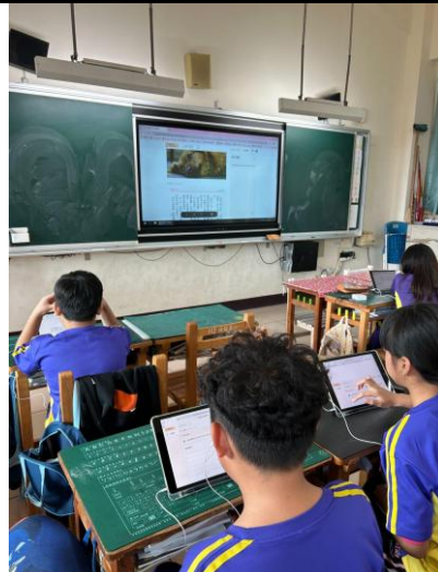
說明：在加分吧閱讀國語日報年級文章和時事篇章