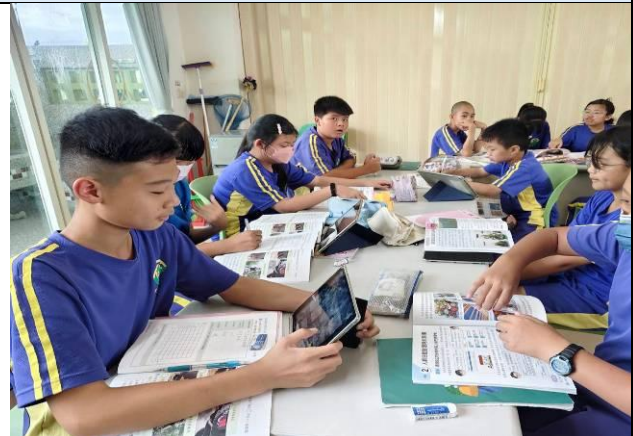
說明：六甲使用平板上網查詢資料