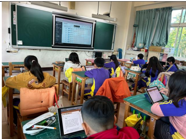
說明：每週一完成 PaGamO 閱讀素養文章 2 篇