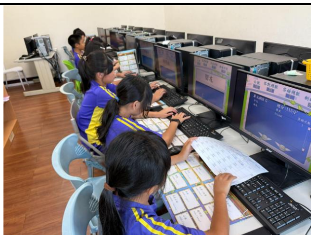
說明：配合學習教材進行練習