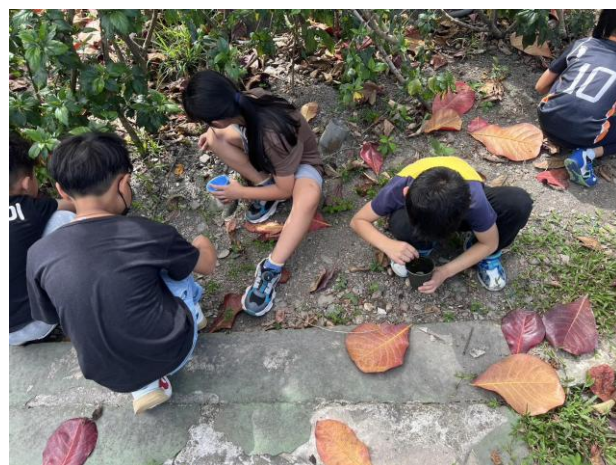
說明：二年級:檢拾石頭準備種植種子