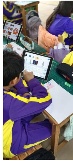
說明：五年級使用平板蒐集各國資訊(2)