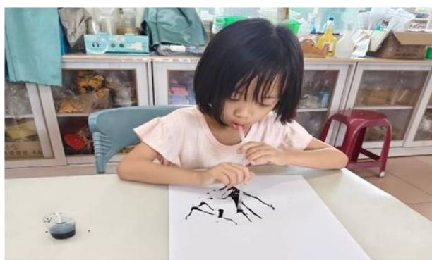
說明：一甲美勞小朋友做吹畫