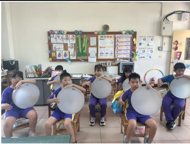
說明：學生練習手鼓拿法與拍打姿勢。