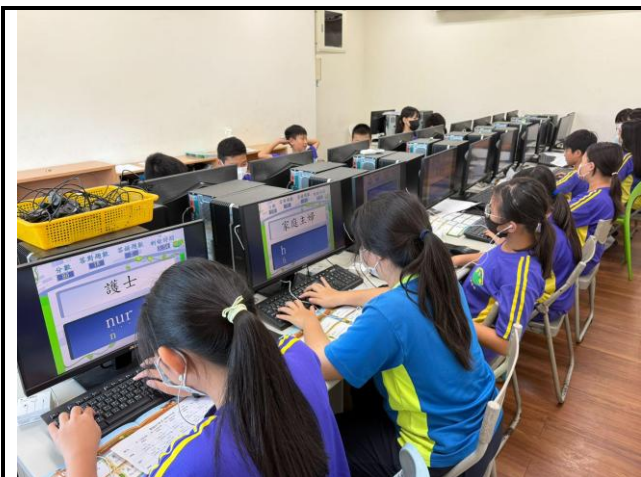
說明：配合學習教材進行練習