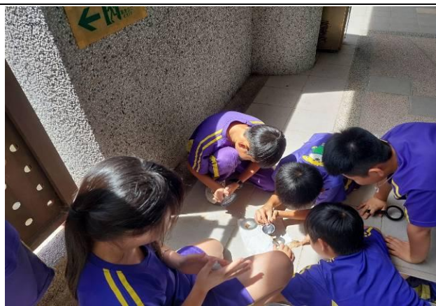
說明：五甲光的折射實驗