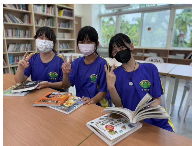
說明：翻閱實體書，感受閱讀樂趣