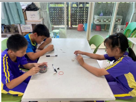
說明：三甲磁力操作