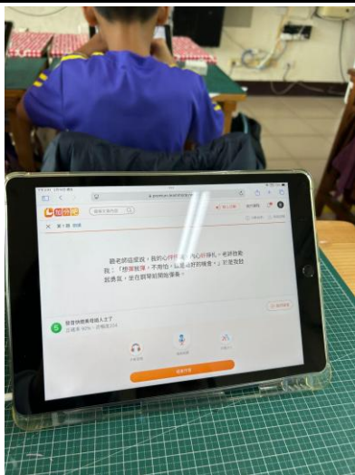
說明：利用加分吧練習朗讀文章熟悉文本