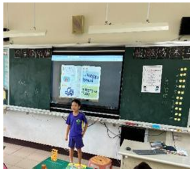
說明：二年級:用觀察創作板寫下任一動物的外表和動作，並上台分享