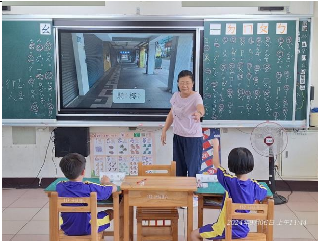
說明：一年級交通安全教育教學，雖然只有兩位學生但互動非常活躍。