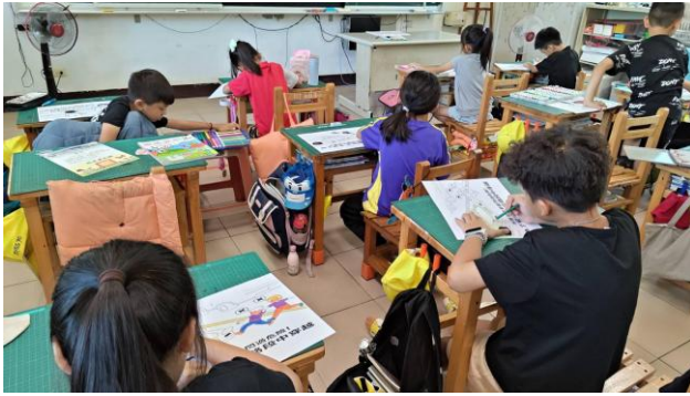
說明：低年級進行交通安全教育塗鴉活動，共有五個版型讓學生選擇。內容與行人過馬路相關。