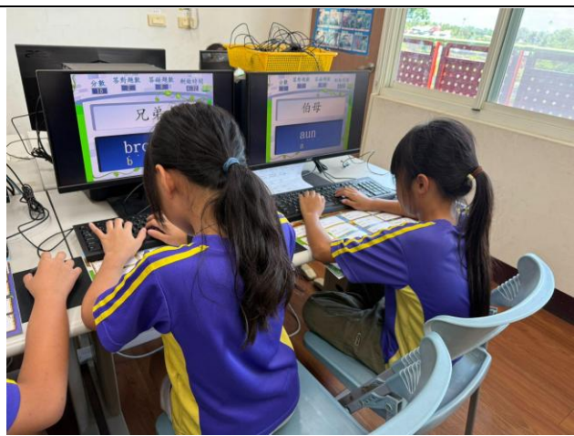
說明：配合學習教材進行練習