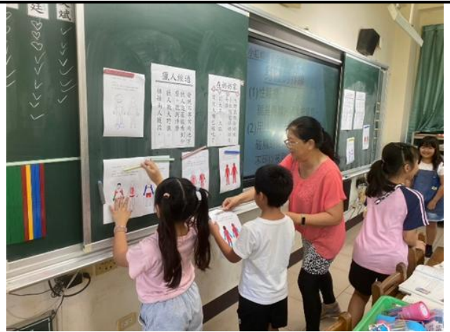
說明：三年級性別平等議題教學，學生參與度高，到台前貼上。