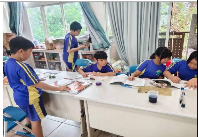
說明：五甲蝶豆花汁液酸鹼溶液檢測驗