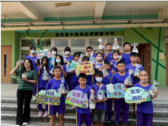
說明：配合職涯探索至里港國中參訪。