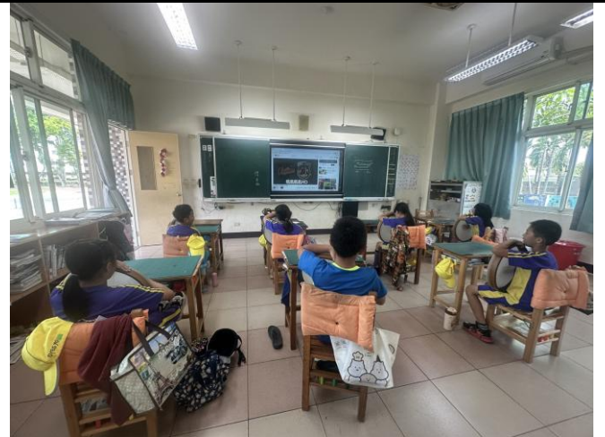
說明：學生配合歌曲拍打節奏。