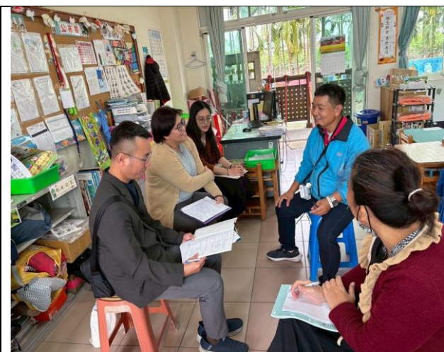
說明：聽取本土語文訪視委員之建言。