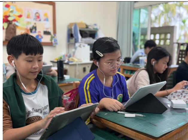
說明：使用平板進行加分吧任務(1)