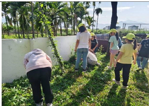
說明：四甲戶外觀察昆蟲