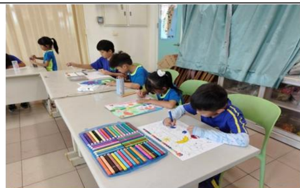
說明：二甲美勞小朋友著色活動