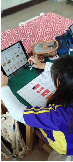
說明：五年級使用平板蒐集各國資訊(1)。