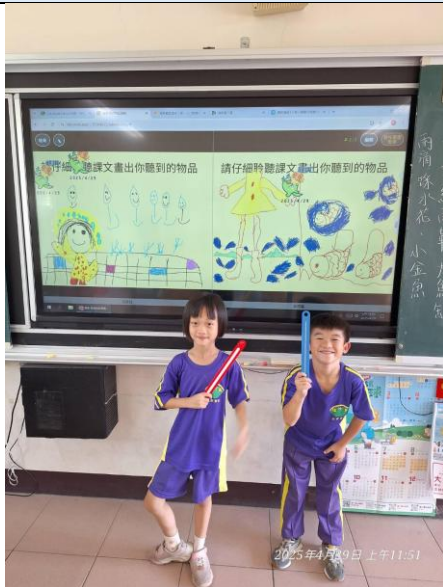
說明：一年級:聆聽課文，利用平板在 loilonote 畫出課文內容並分享