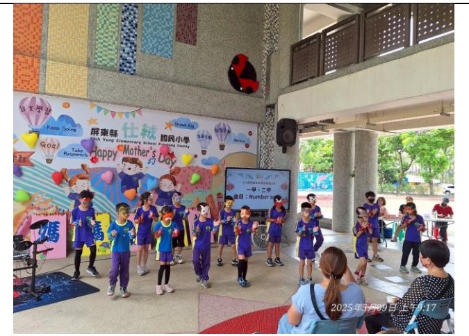
說明：於母親節活動展示學習成果，表演曲目：Number song。