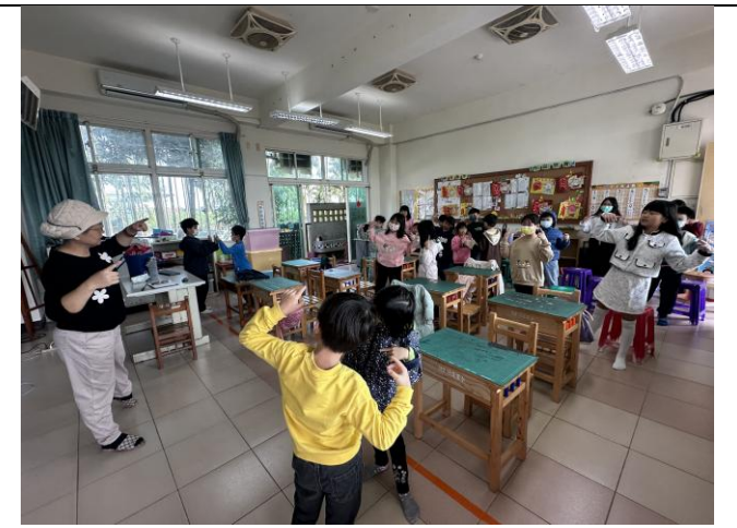
說明：學生練唱英語歌謠。