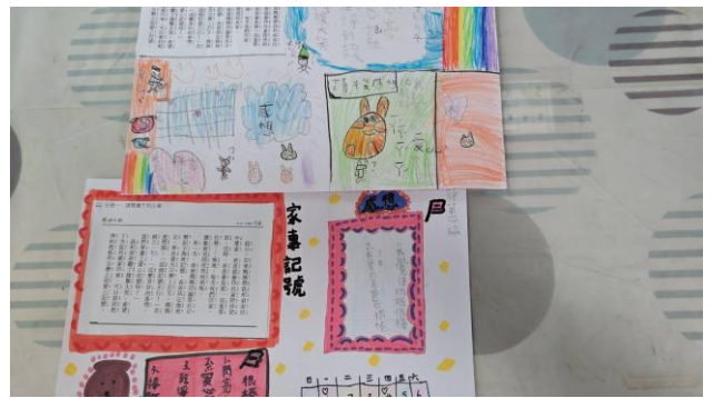
說明：二三年級以國語日報進行家庭教育議題，學生非常喜歡剪貼並發揮巧思。