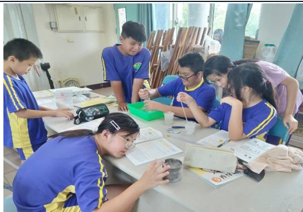
說明：六甲水的凝固實驗