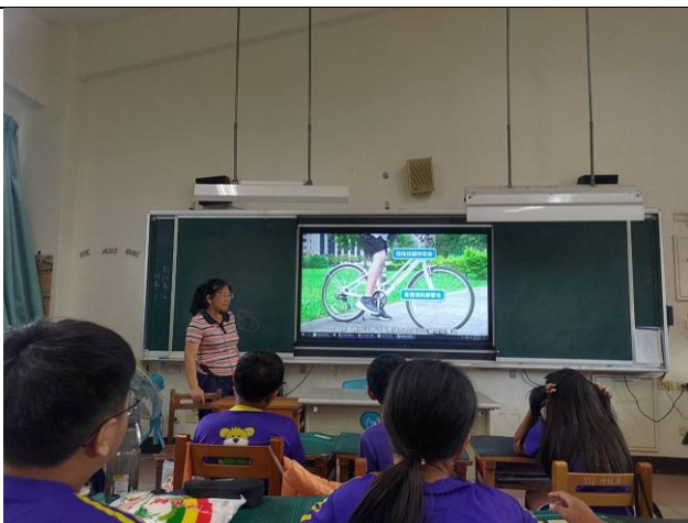
說明：六年級交通安全教育教學，介紹自行車應有的配備。