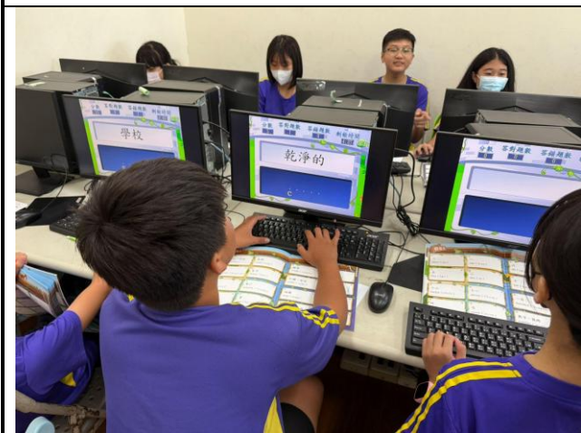
說明：配合學習教材進行練習