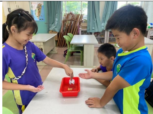
說明：三甲操作空氣佔有空間實驗