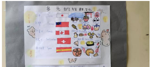
說明：五年級以圖像認識各國國旗及特色。