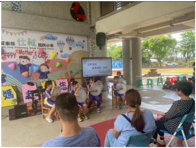
說明：於母親節活動展示學習成果，表演曲目：台灣尚勇。