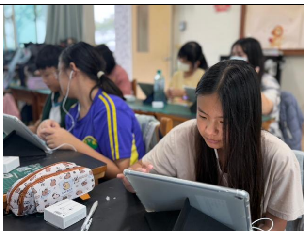
說明：使用平板進行加分吧任務(2)