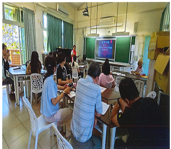
審議本校 114 學年度特殊教育課程計畫。