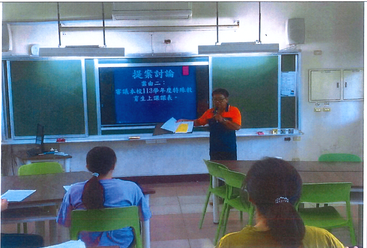
照片說明：審議本校 113 學年度特殊教育生上課課表。