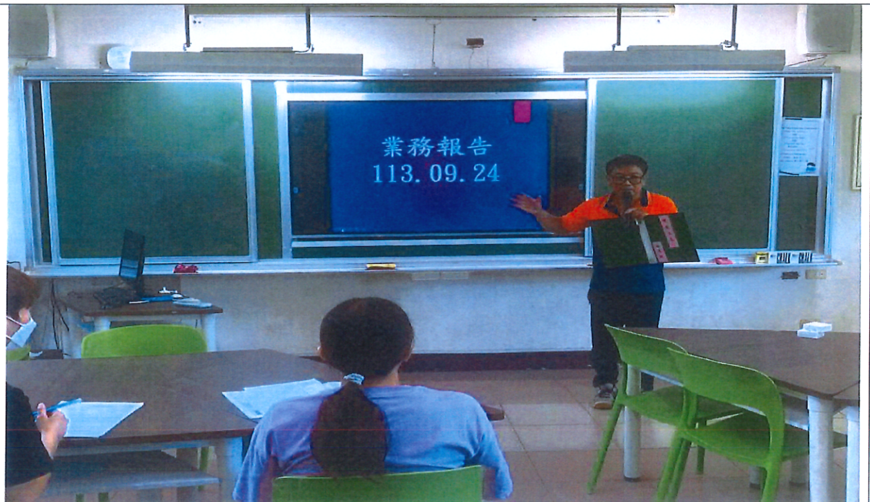
照片說明：期初特推會~承辦人業務報告