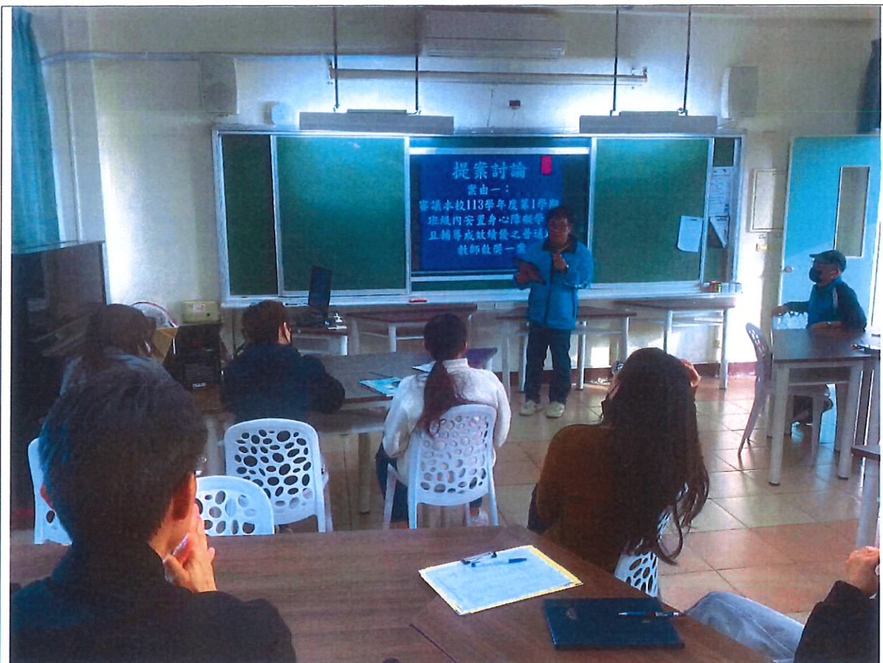
照片說明：審議本校 113 學年度第 1 學期班級內安置身心障礙學生且輔導成效績優之普通班教師敘獎名冊。