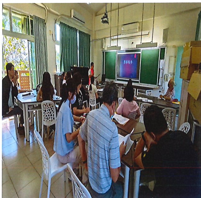
特教承辦員業務報告。