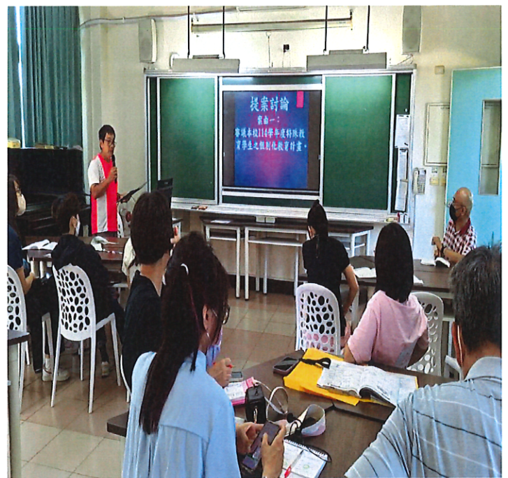
審議本校 114 學年度特殊教育學生之個別化教育計畫。