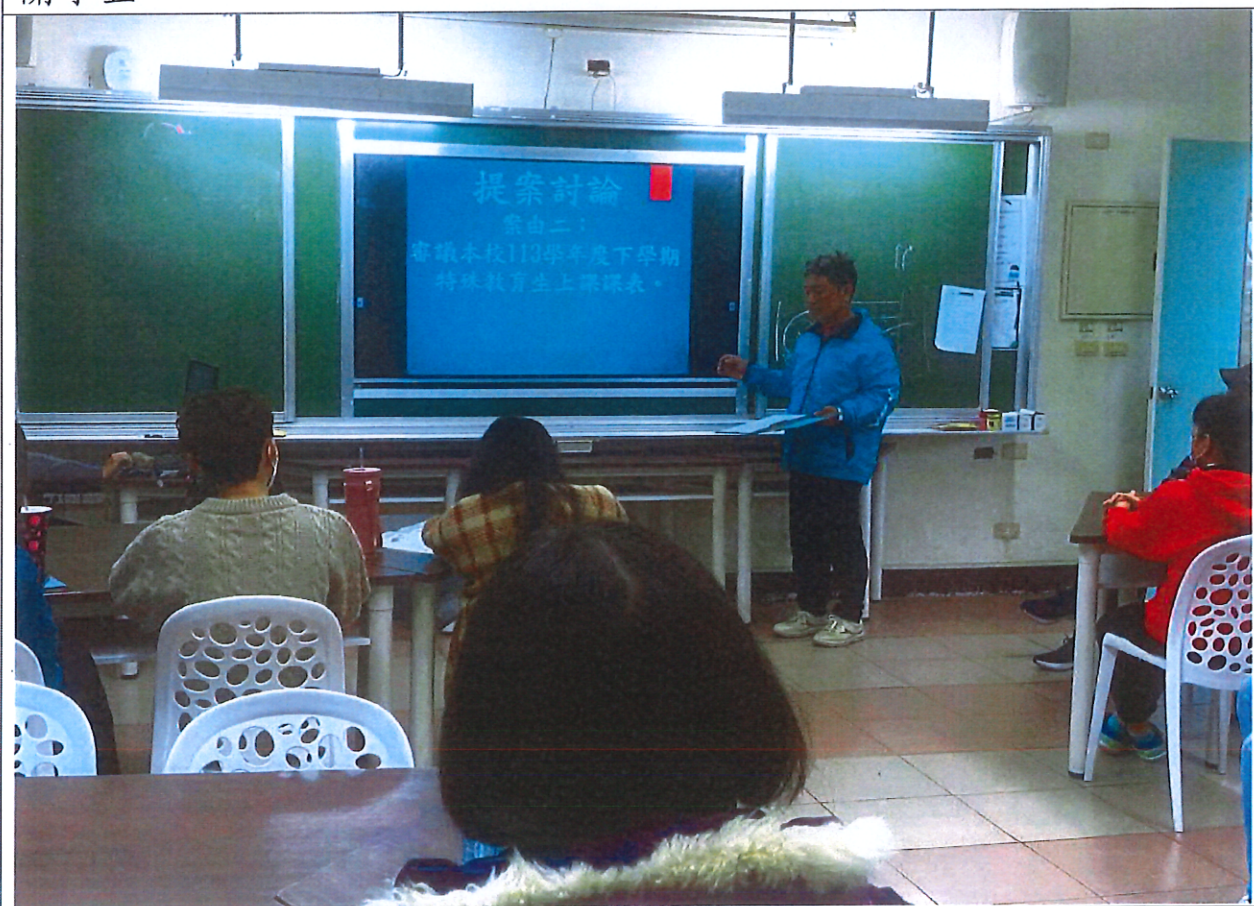
照片說明：審議本校113-2學期特殊教育生上課課表。