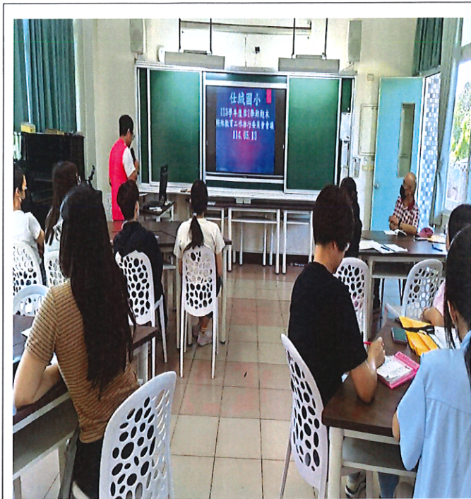
113 學年度第二學期期末特殊教育推行委員會，委員熱烈參與情景。