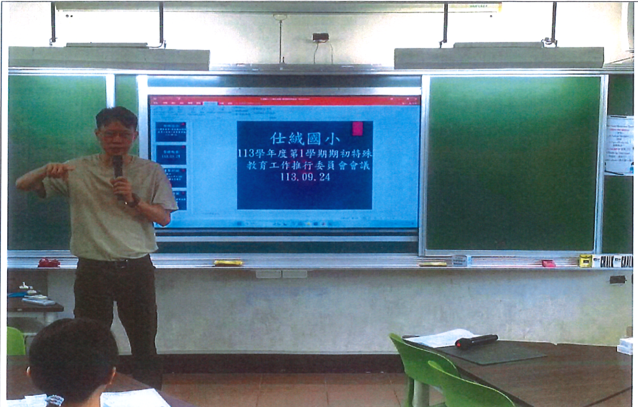
照片說明：主任委員(校長)主持 113-1 期初特推會