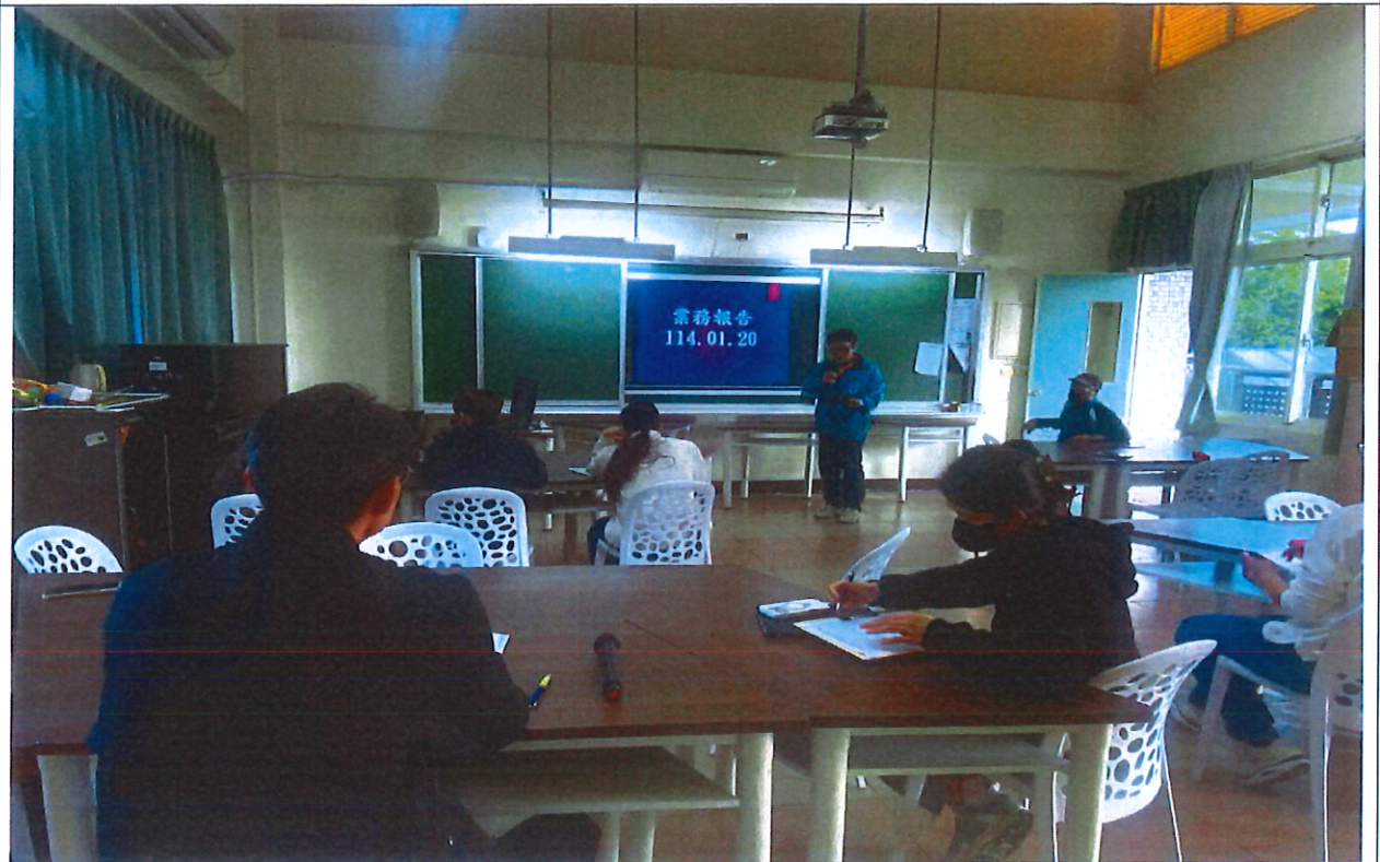
照片說明：期末特推會~承辦人業務報告