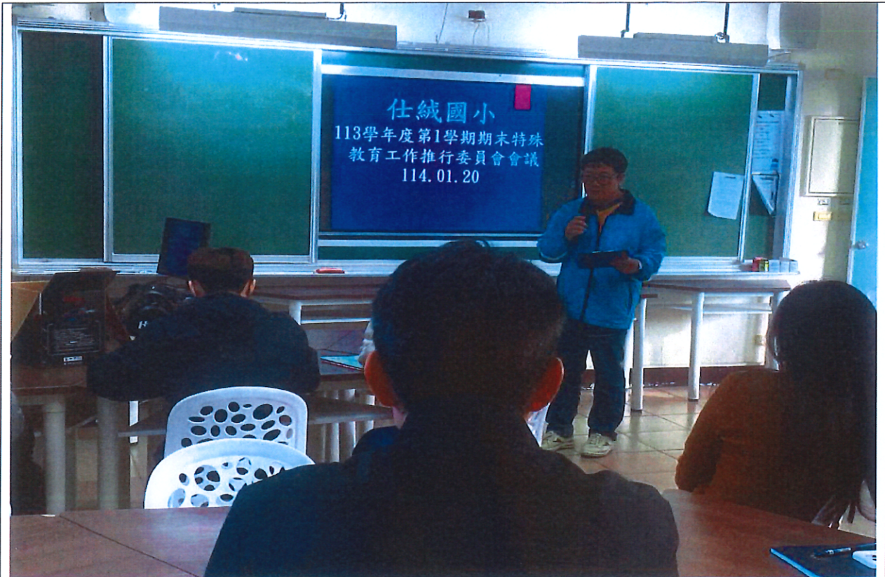
照片說明：113-1 期末特推會承辦人說明本會議重點