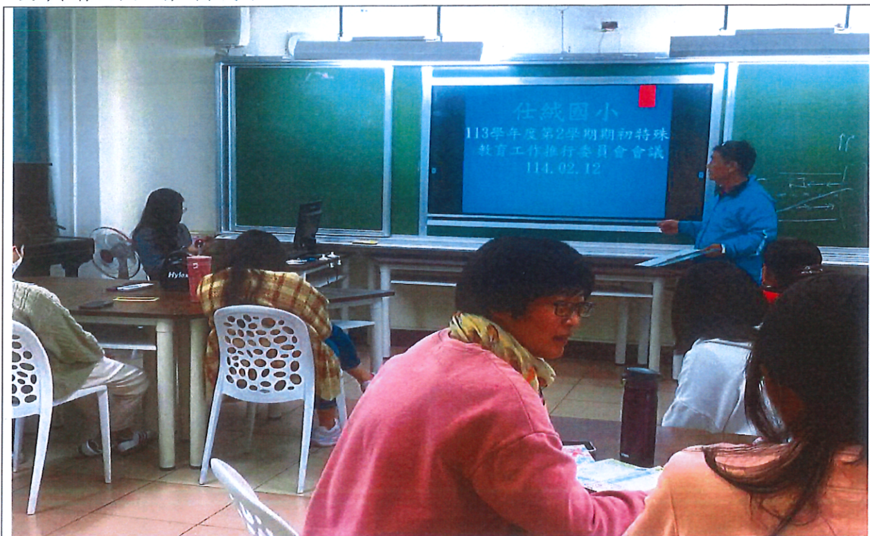
照片說明： 113-2 期初特推會承辦人說明本會議重點