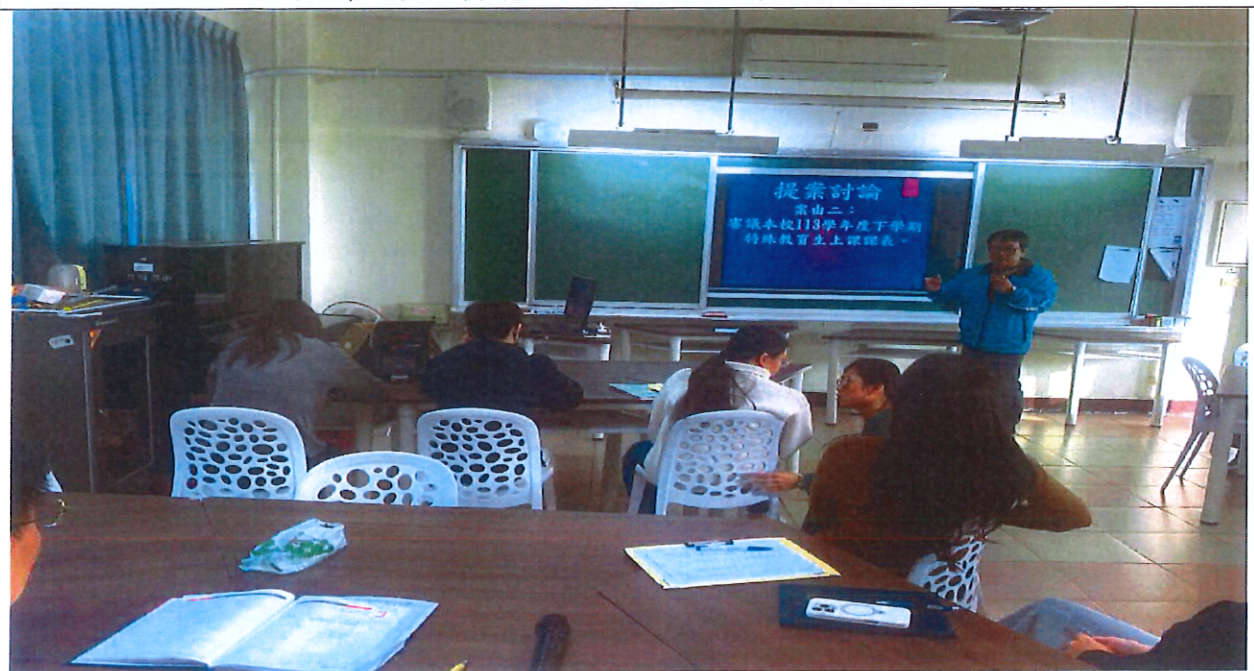
照片說明：審議本校 113-2 學期特殊教育生上課課表。