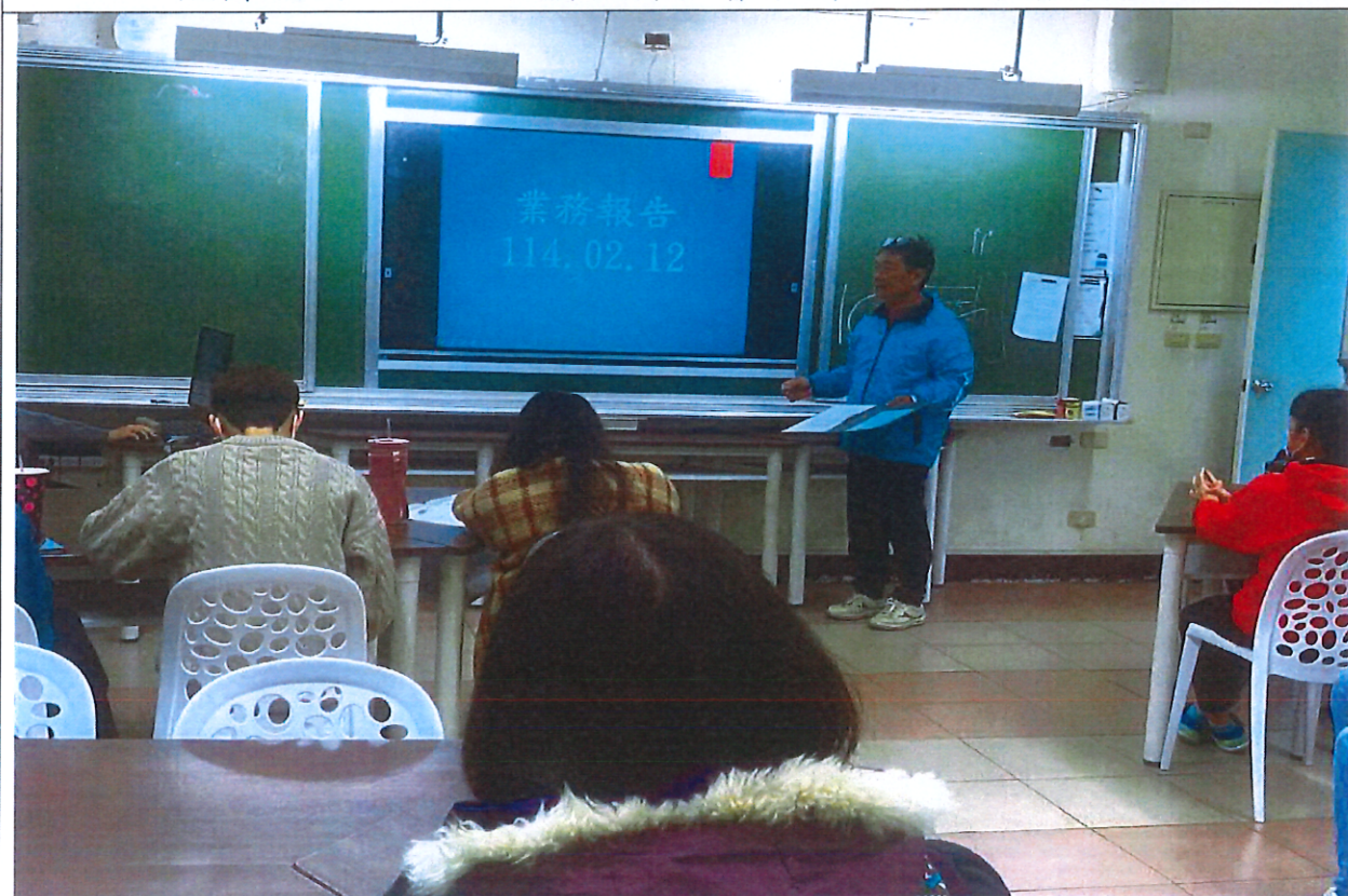
照片說明： 113-2 期初特推會~承辦人業務報告