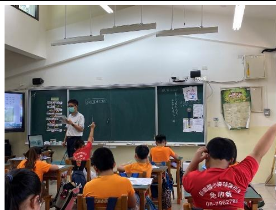
說明：學生踴躍舉手回答