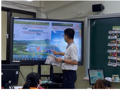
說明：指導學生提取訊息