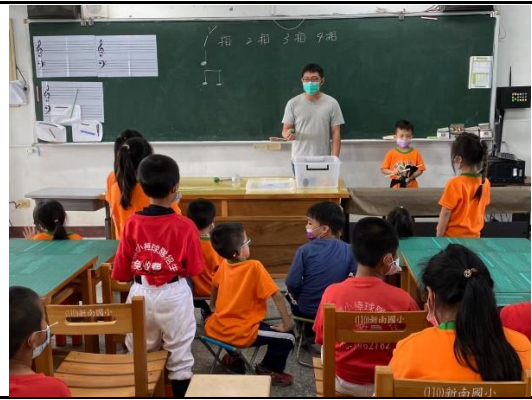
學生一個一個起立練習。