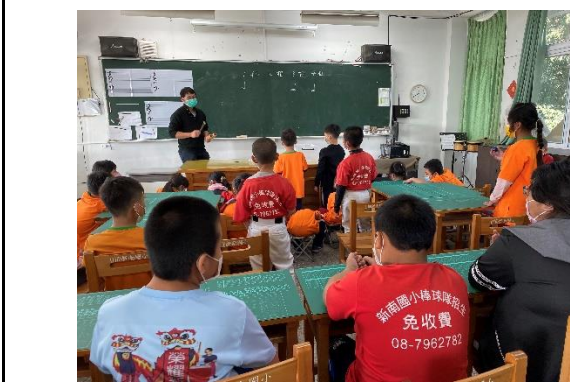
說明：分組測驗並複習4、8分音符的正確打法