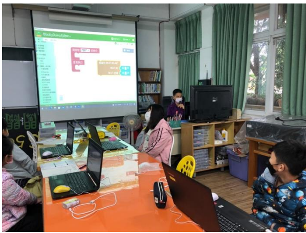
說明：指導學生 Code 編寫