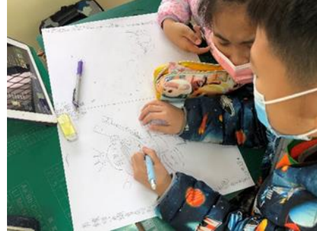
說明：學生對昆蟲做不同的詮釋