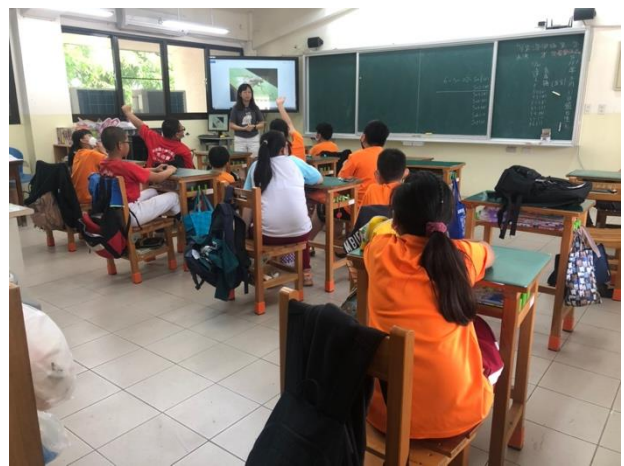
說明：檢視學生 Code 編寫結果