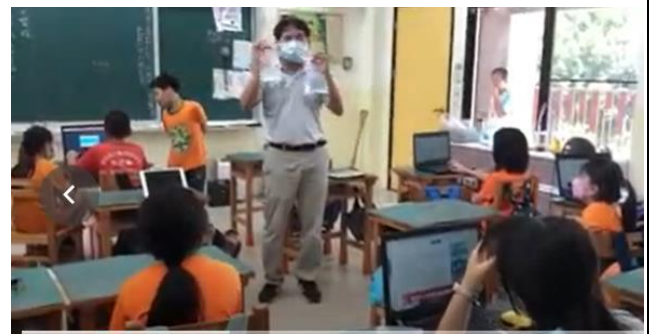
說明：教師實驗說明差異性。