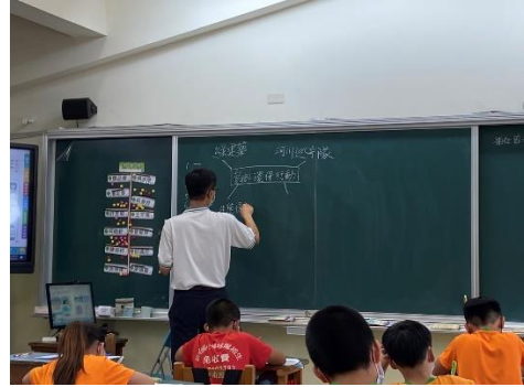
說明：指導學生進行心智圖繪製