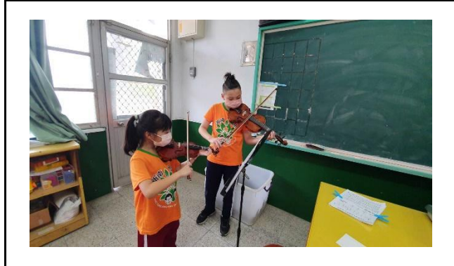
說明：期末驗收，與大家一起合奏