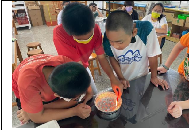
說明：學生動手做實驗，豐富學習經驗。