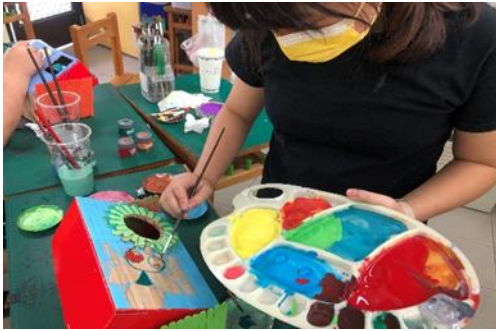
說明：學生彩繪小屋