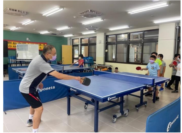
說明：與教練進行推球練習