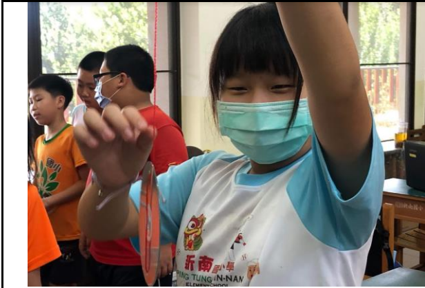
說明：與生活經驗結合的課程。