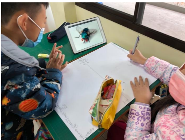
說明：學生利用 Code 編寫昆蟲紀錄