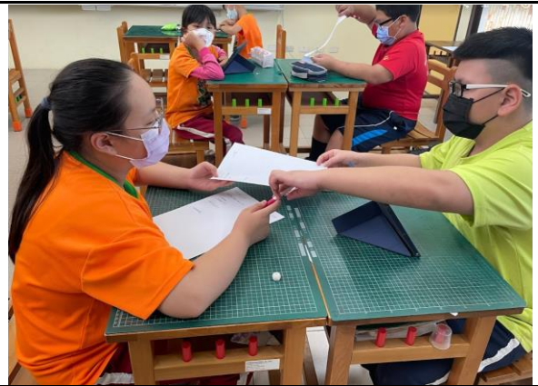
說明：分組討論，發會組內共學效果。