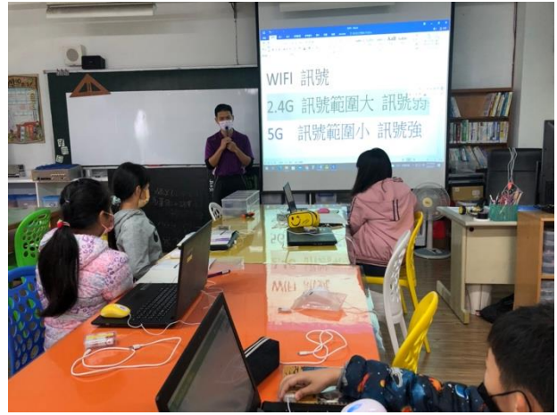
說明：指導學生 Code 規劃