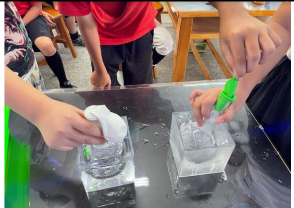
說明：實驗操作，驗證真實現象。