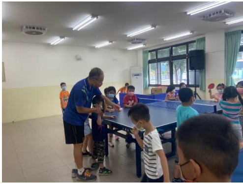
說明：教練握著學生的手進行推拍動作修正