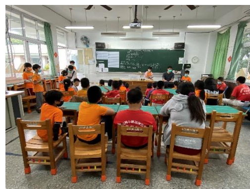
介紹什麼是 fill in 填入 (過門)。