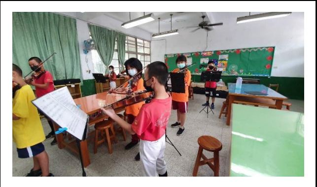
期末驗收，與大家一起合奏