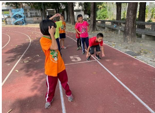
說明：指導學生起跑姿勢