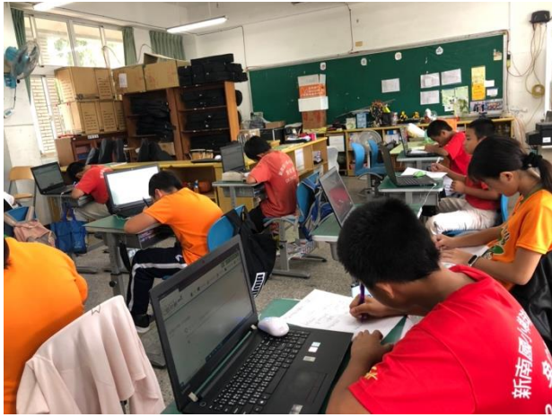
說明：指導學生在紙上書寫 Code 流程