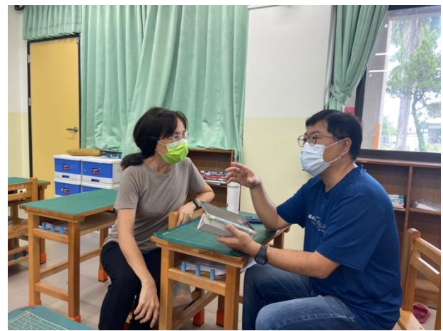
說明：與同儕進行數學議課