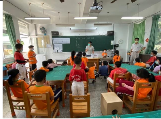
練習較難的十六分音符。