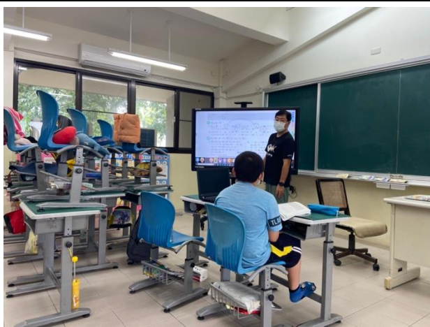
說明：停課期間，進行混成教學