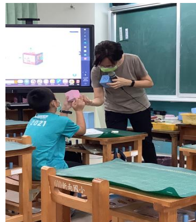
說明：停課期間，進行混成教學