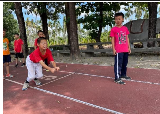
說明：指導學生跳遠技巧