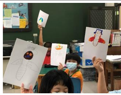
說明：學生完成作品