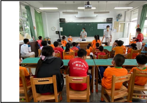
說明：練習四分音符、八分音符。