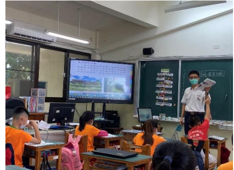
說明：教師引導學生回答問題