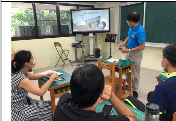
說明：自然與生活科技領域分享會議。