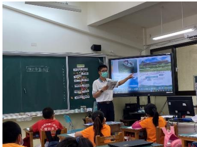
說明：幫助學生釐清迷思概念