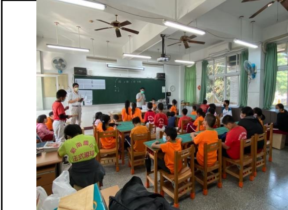
說明：開始介紹前奏、主歌、副歌。