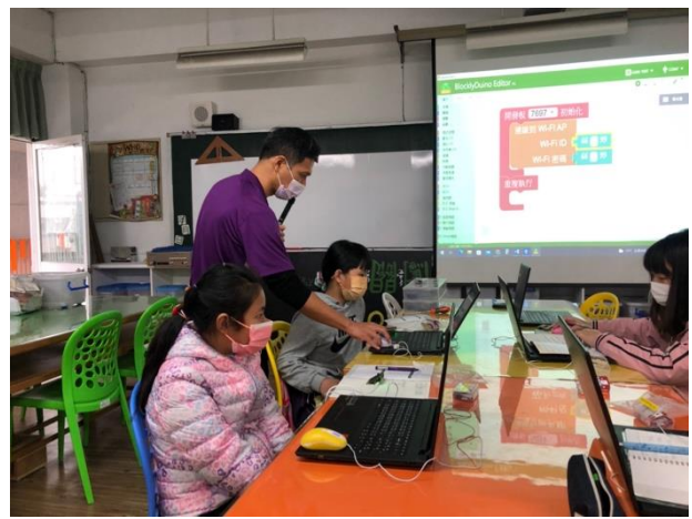
說明：檢視學生 Code 內容