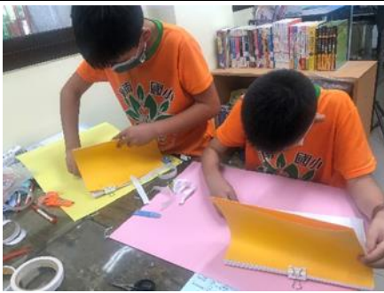
說明：學生製作手工小書