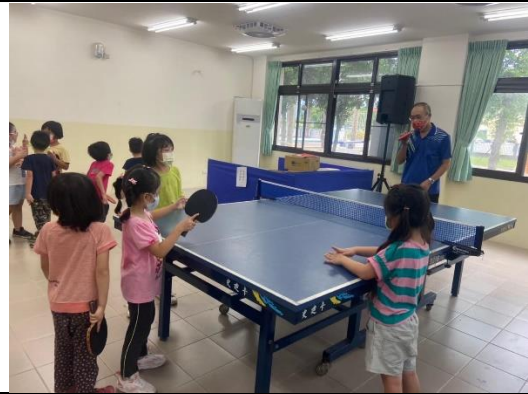
說明：課前暖身活動，推拍、握拍練習