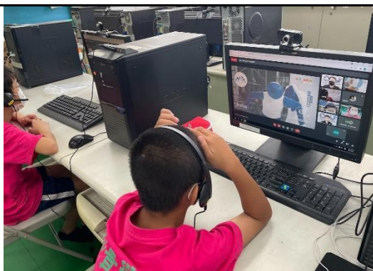
說明：教師引導學生回答問題