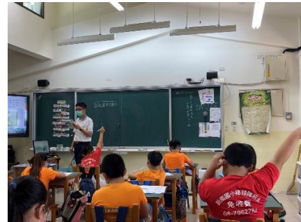
說明：學生踴躍舉手回答