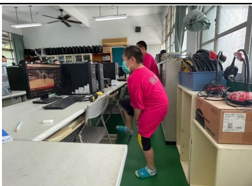
說明：線上體育課-體適能熱身操