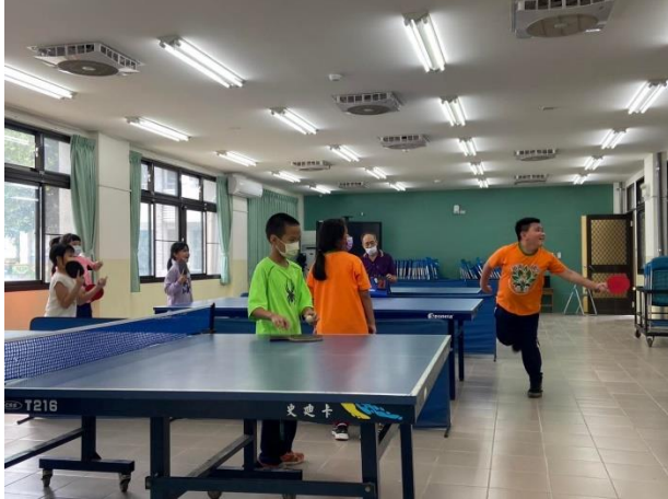
說明：中年級學生進行團體單打賽