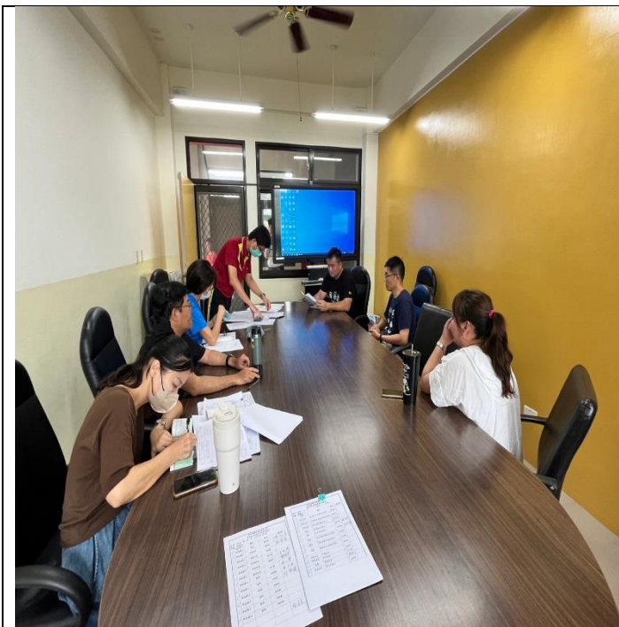
照片說明：召開教科書評選會議。