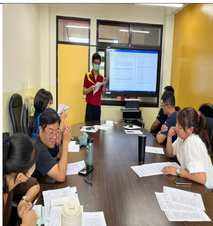
照片說明：各年級、各領域進行討論與分析。