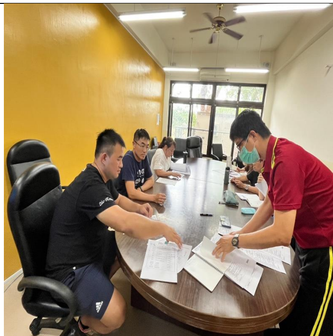
照片說明：請各領域召集人了解各版本特色，填寫評選表。