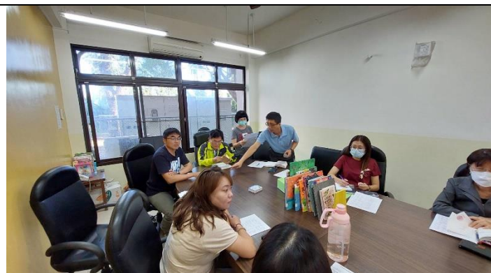
照片說明：各年級、各領域進行討論與分析。