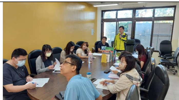
照片說明：報告會議內容。