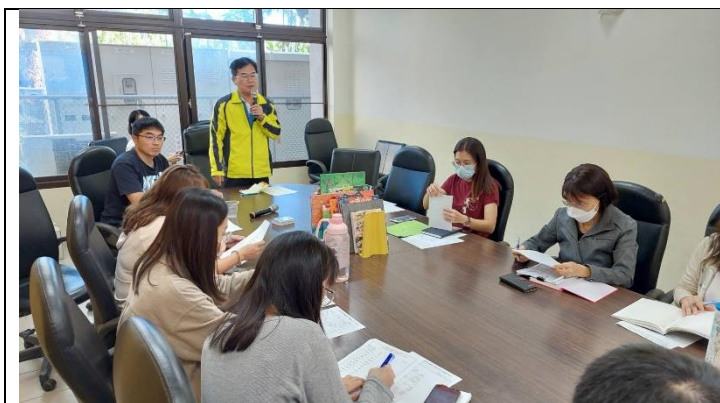
照片說明：召開教科書評選會議。