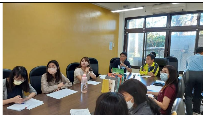
照片說明：請各領域召集人了解各版本特色，填寫評選表。