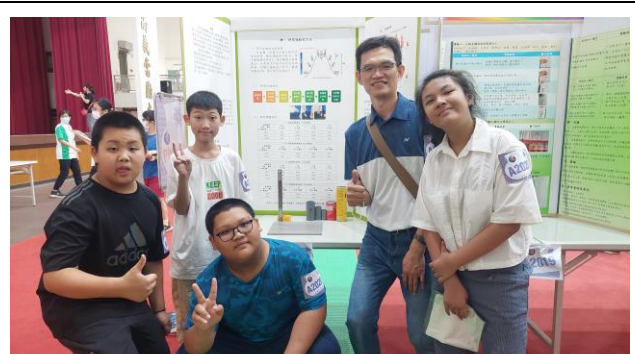
說明：參加科展，驗證真實現象。