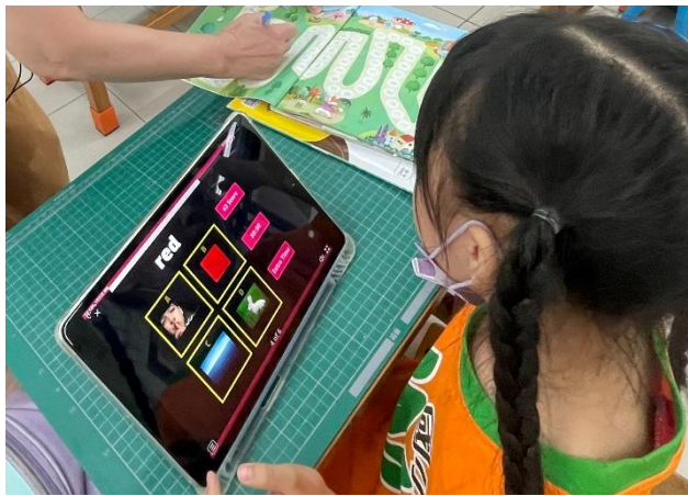
說明：利用教育帳號學習英語