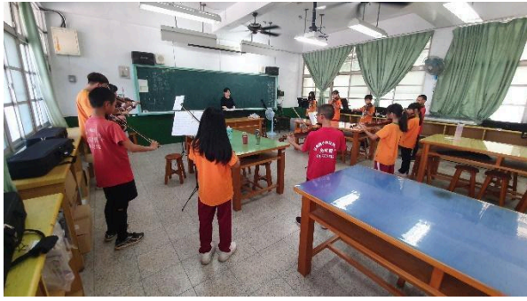
說明: 期末驗收, 與大家一起合奏