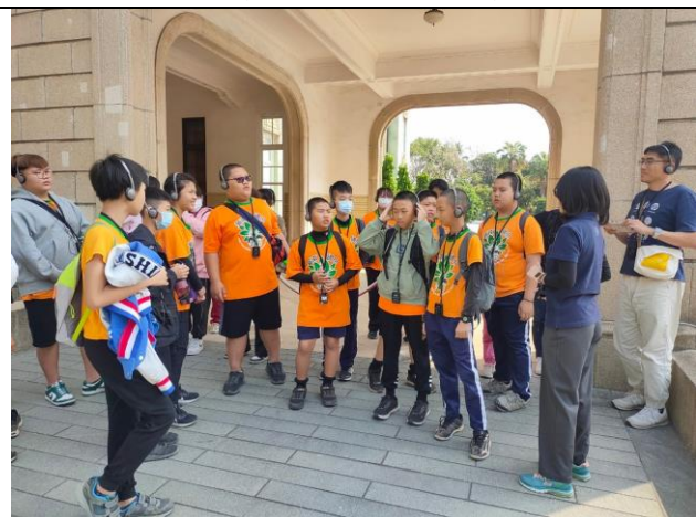
說明：走進歷史場館，驗證所學內容。