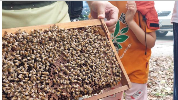
說明：學生從觀察蜜蜂習性，品嚐真實蜂蜜的滋味。