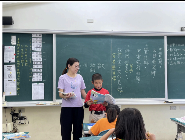
說明：能運用「既然……就……」句型造句