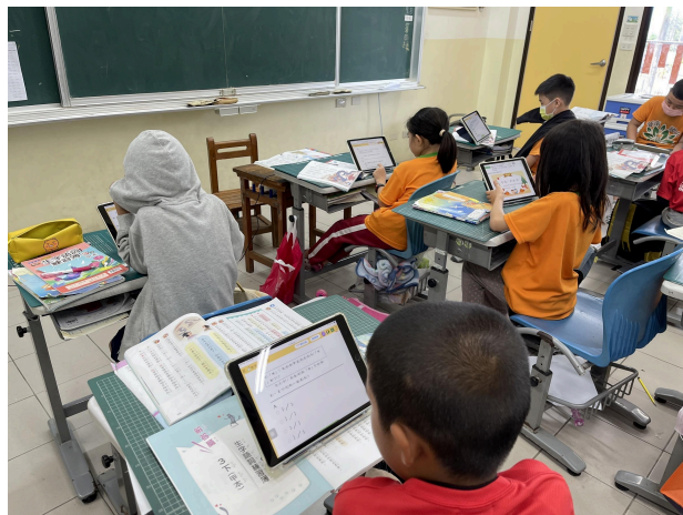
說明：運用因材網等教育網站