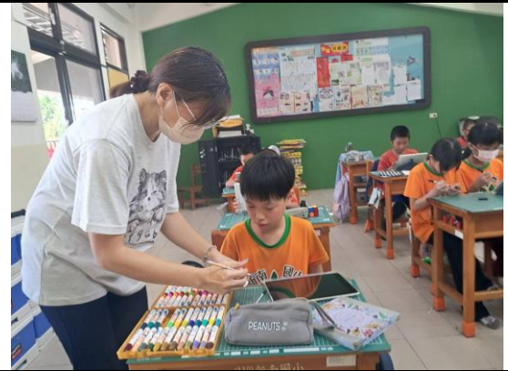
老師指導學生如何製作作品