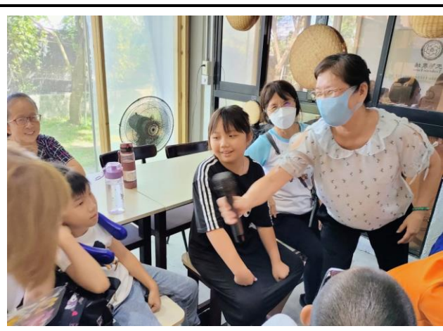
說明：擴展學習場域，深化學習內容。