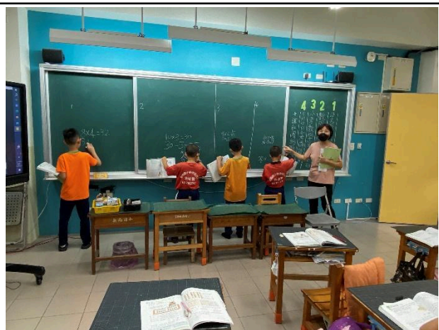
說明：讓學生上台實作並講解迷失之處