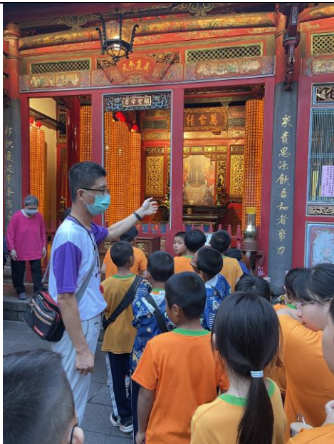
說明：以素養為導向的教學模式