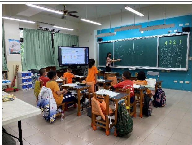
說明：學生踴躍發表