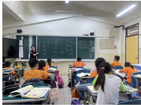
說明：講解易寫錯的字及如何運用