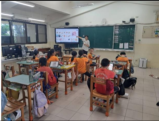
老師解說如何設計繪圖及著色