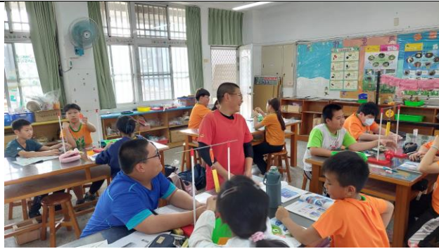
說明：學生操作與生活經驗結合的體驗課程。