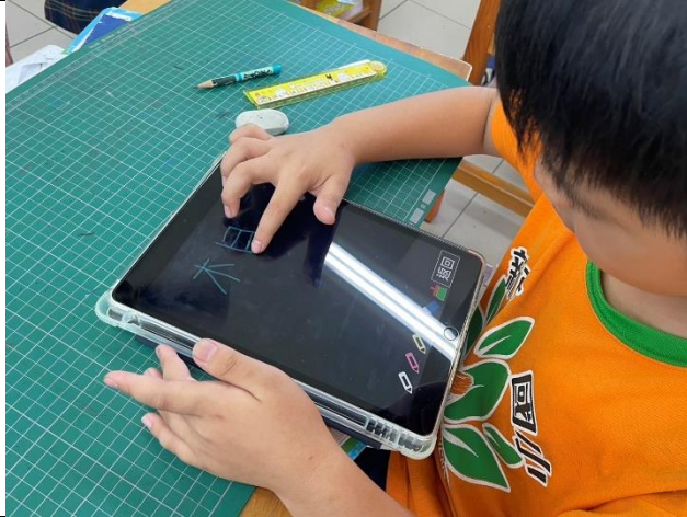
說明：利用語文學習 APP 做生字練習