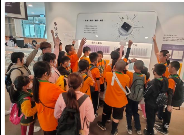
說明：學生操作與生活經驗結合的體驗課程。