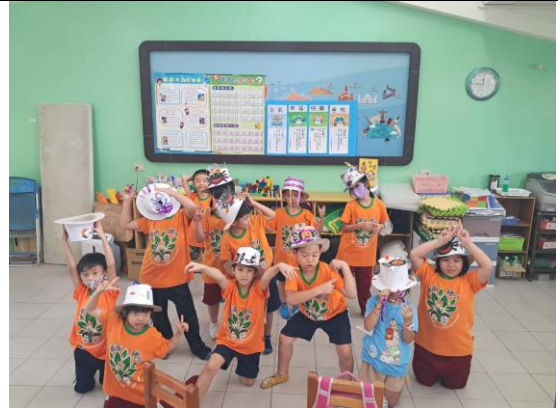
學生展示自己的美勞作品