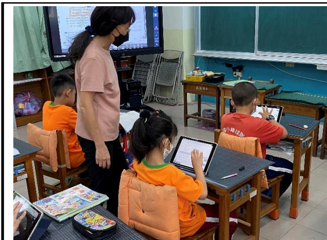
說明：數學課用平板指導學生實作