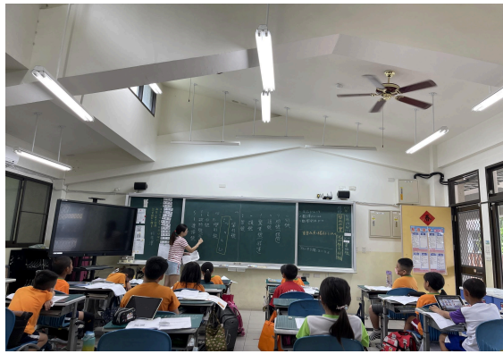
說明：講解標點符號的正確用法