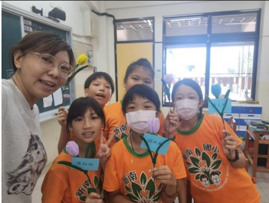
學生展示自己的手作作品