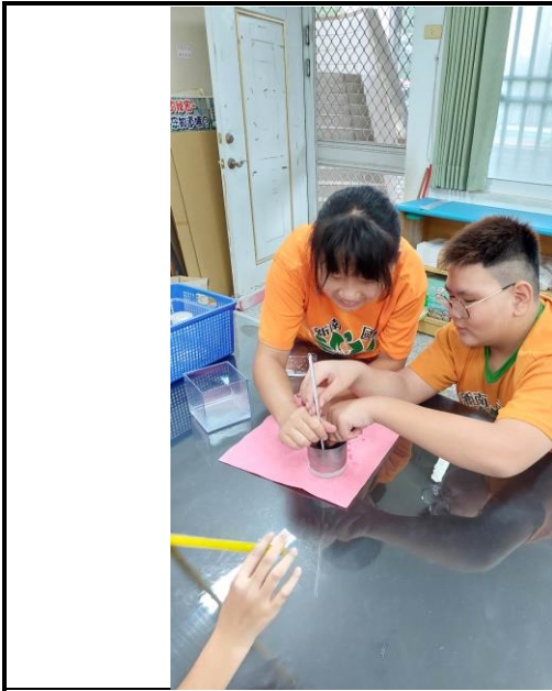
說明：善用教具豐富學習經驗。