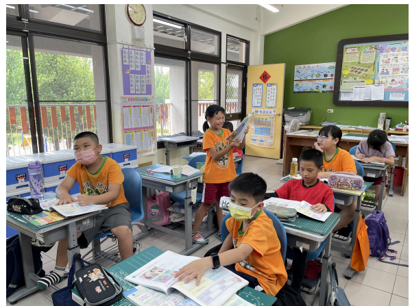
說明：學生踴躍分享自己的造句