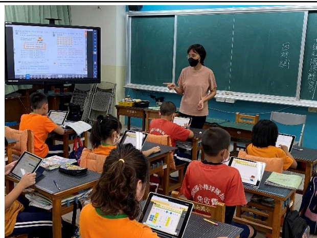
說明：利用平板進行數學教學與實作