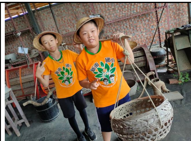
說明：走出戶外體驗課本知識內容。