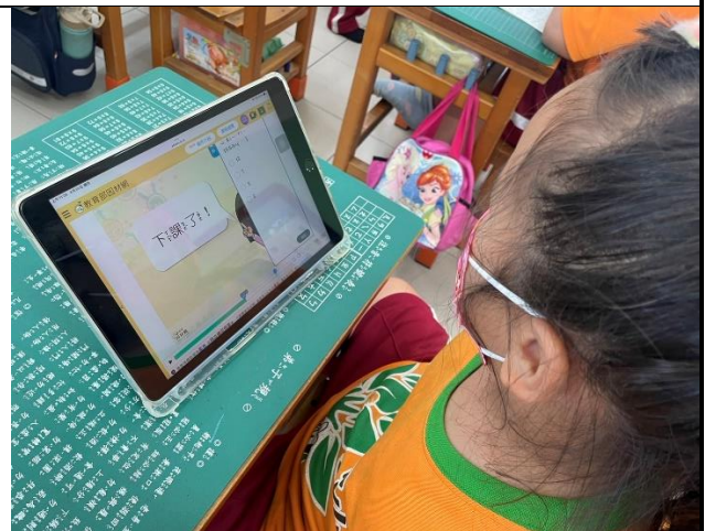
說明：練習利用教育帳號進入教育相關網站