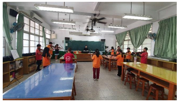
期末驗收, 與大家一起合奏