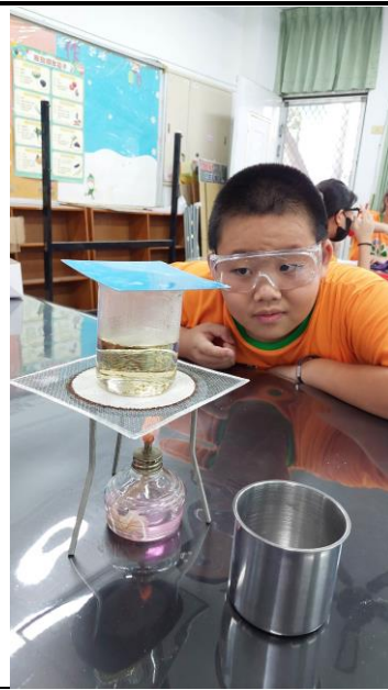
說明：熱漲冷縮實驗與生活經驗相結合。