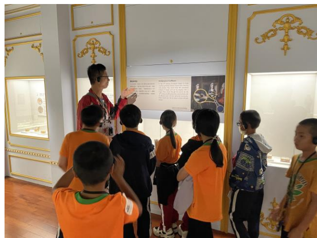
說明：前往故宮，探訪歷史文物。