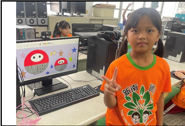
說明：利用小畫家畫出自己的設計