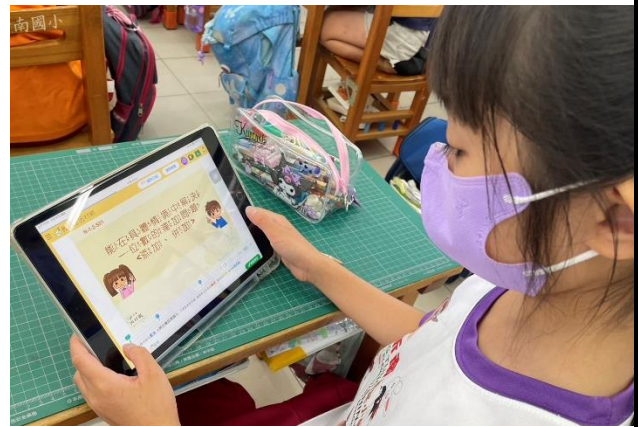
說明：指導學生使用教育帳號登入因材網