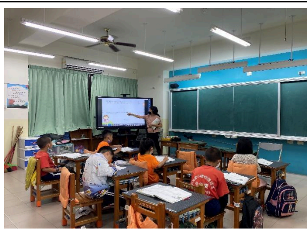
說明：課堂教學上學生認真聆聽