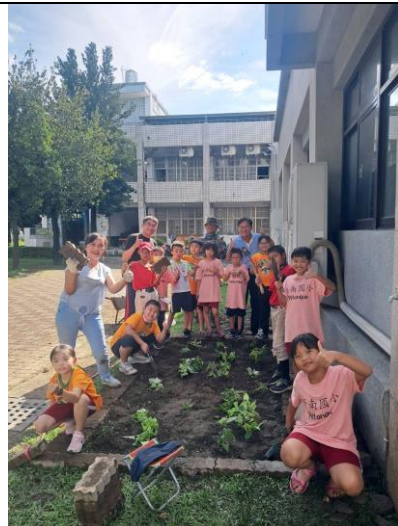
說明：從校園出發的食農教育。