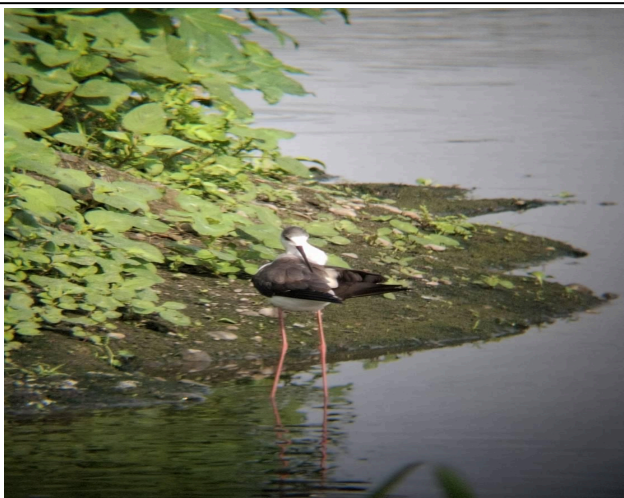
說明：學生從觀察高蹺鴉習性，理解自然。