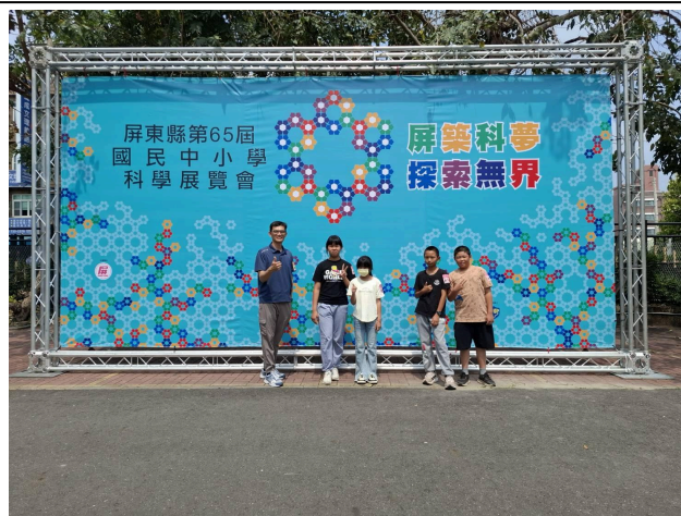
說明：參加科展，驗證真實現象。