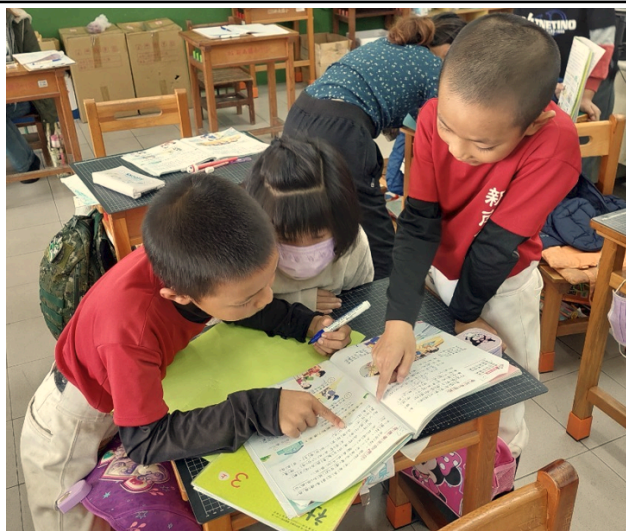
說明：學生互學，從文本中找出關鍵字。