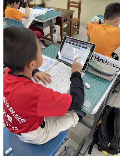
說明：學習運用各類電子資源