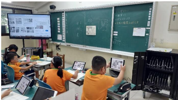
說明：學生在平板上面做學習紀錄。