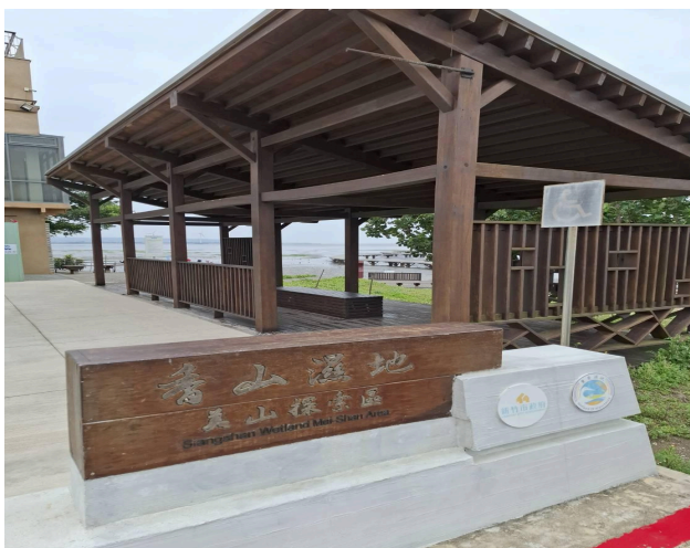
說明：親近溼地豐富學習經驗。