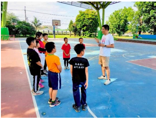
說明：上課前先作規則講解