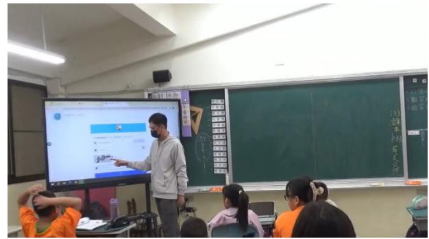
說明：使用數位平台。