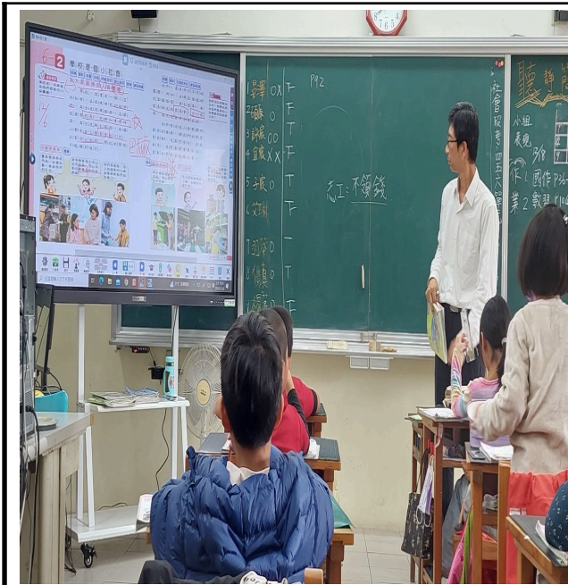
說明：教師進行文本分析。