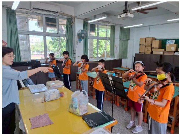
說明：期末驗收，與大家一起合奏