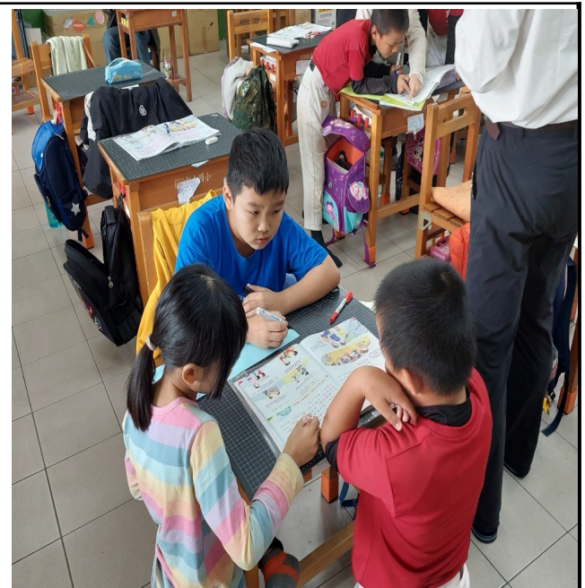
照片說明：課程中，進行形成性評量。