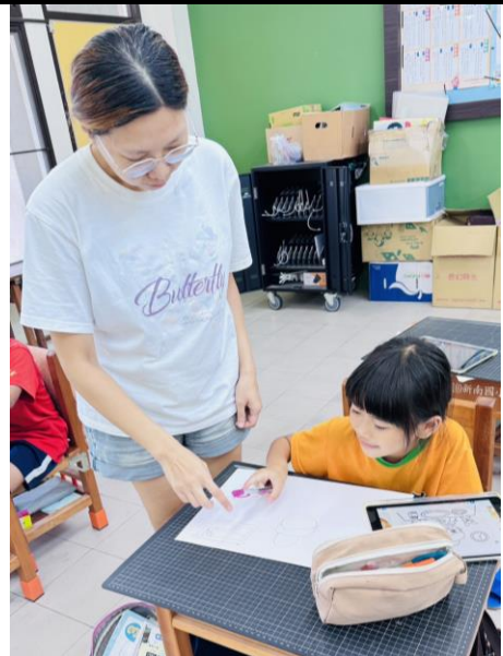
老師指導學生如何製作作品