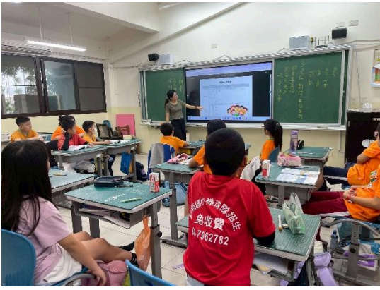
說明：講解九大中文句型