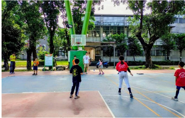
說明：分組進行對抗1