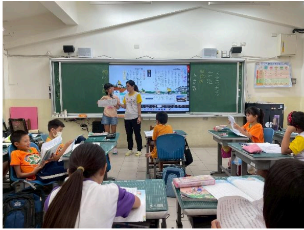
說明：學生上台分享自己的作文