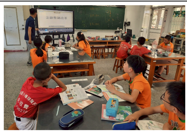
說明：總結金融幣制改革的影響。