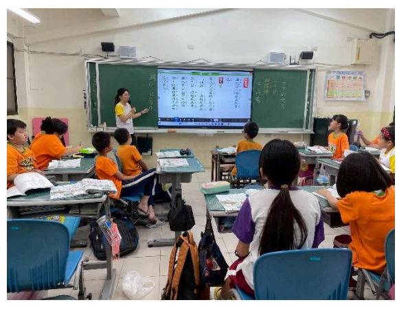
說明：講解修辭法及如何運用