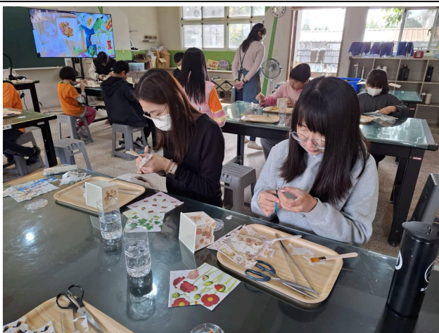
說明：操作與生活經驗結合的體驗課程。