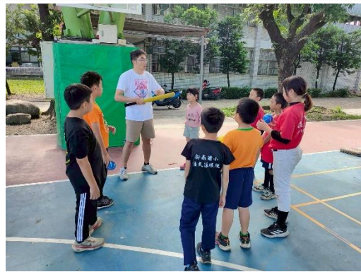
說明：分組分別體驗