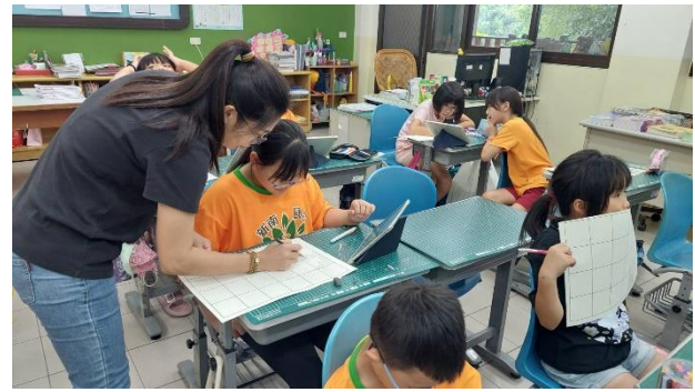
說明：善用學具，豐富學生學習內容。