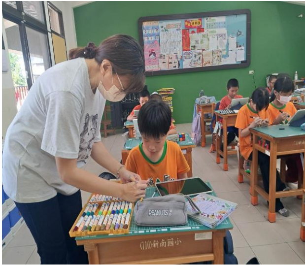
老師解說如何設計繪圖及著色