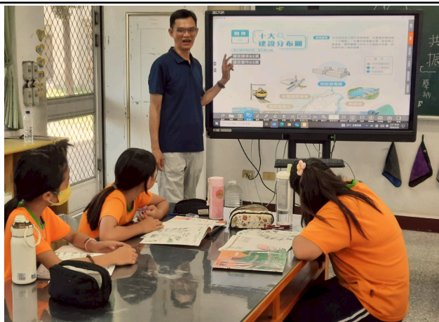
說明：歸納台灣早期的十大建設。