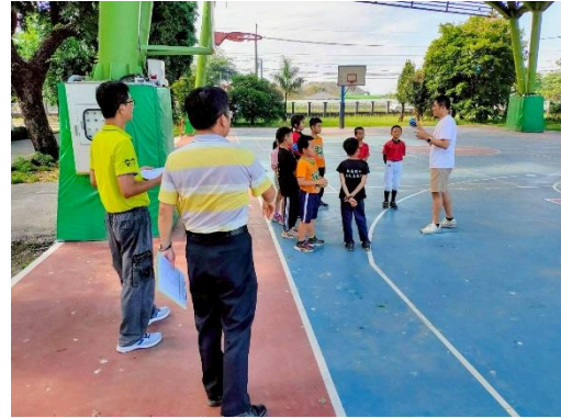
說明：教師於活動後講評與提出注意事項