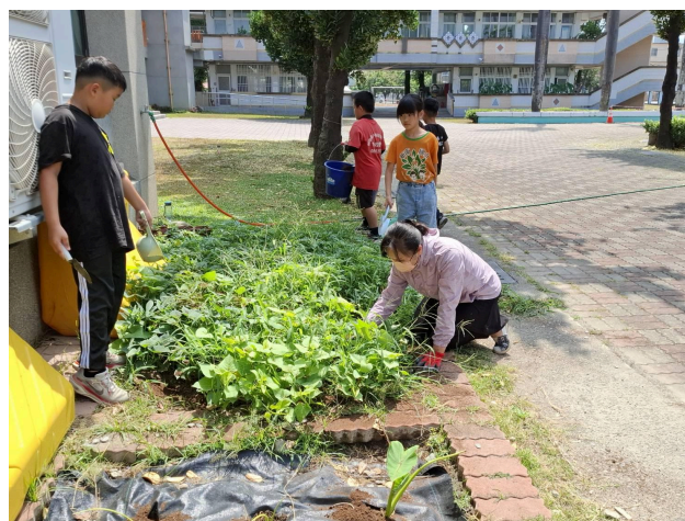
說明：從校園出發的食農教育。