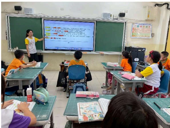
說明：介紹文章文體的特徵