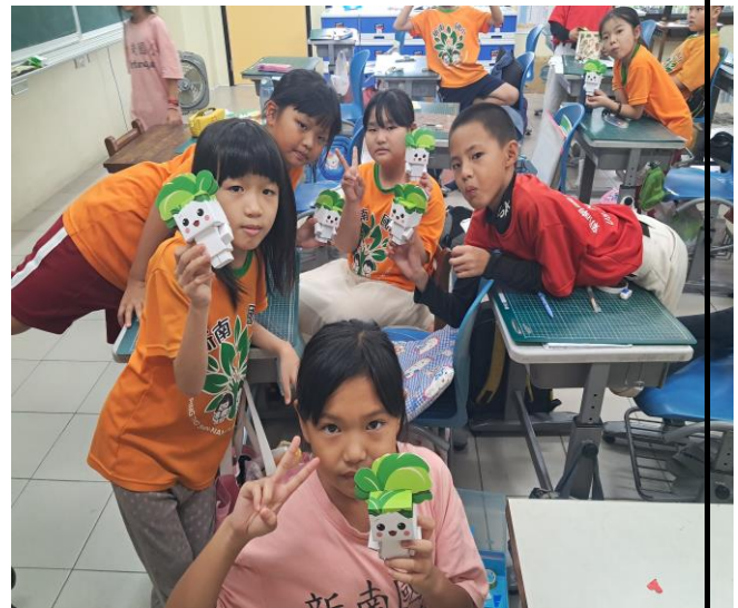
學生展示自己的美勞作品