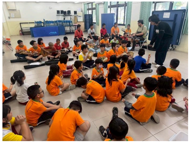
期末驗收，與大家一起合奏