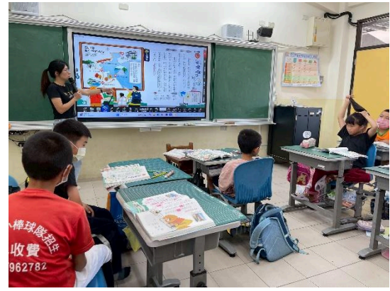
說明：介紹課文中加入地圖的用意