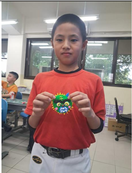
學生展示自己的手作作品