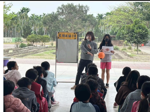
說明：學生表現任務的成果展現