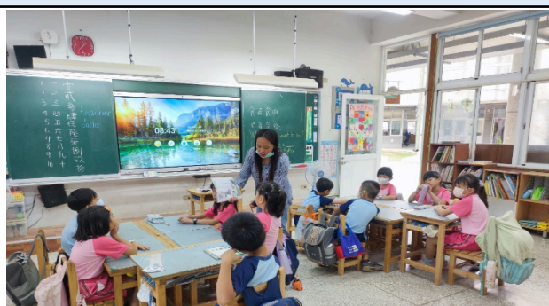
說明：教師指導學生看圖回答問題。