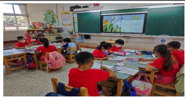
說明：小組完成學習單。