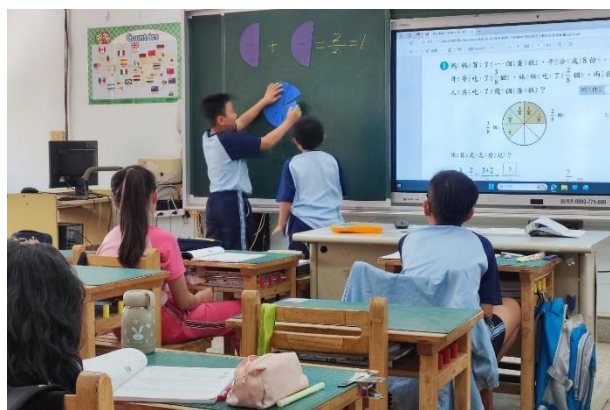
說明：學生上台操作分數板。