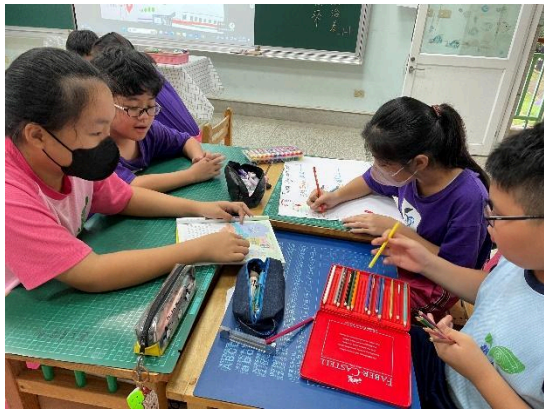
說明：教師的教學策略與教學活動設計能促進學生核心素養與表現任務的達成。