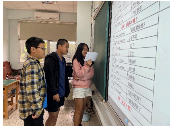
說明：學生透過組間學習，加深印象