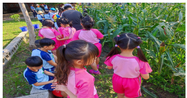
說明：實地觀察作物。