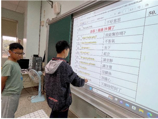
說明：生活美語開口說的推動