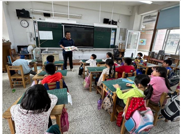
說明：大家都聆聽故事