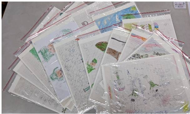
說明：圖文創作傘兵降落的各種情形。