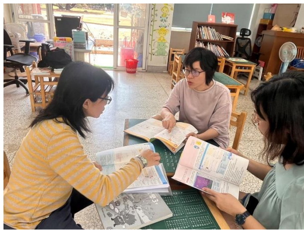
說明：領域會議討論課程。