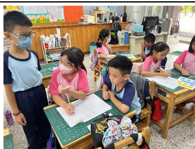
說明：小組分組學習