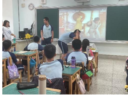
說明：學生從影片中學戲演出技巧