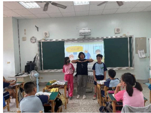
說明：學生的自評與互評