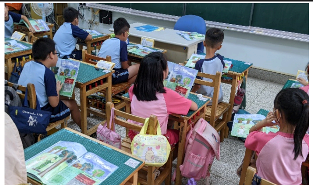
說明：閱讀潮南繪本中關於「旗杆厝」的歷史及來源部分。