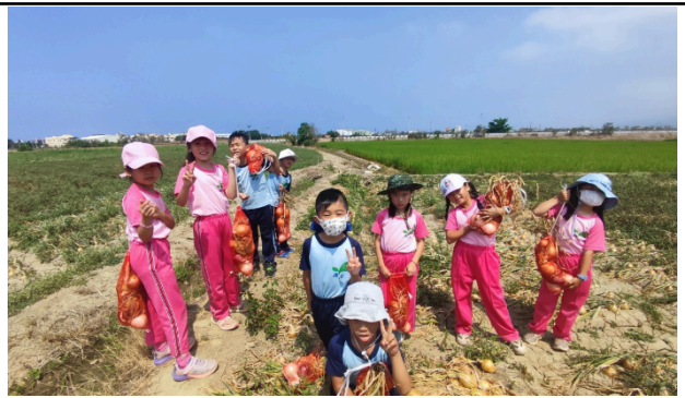
說明：實地參訪洋蔥田。