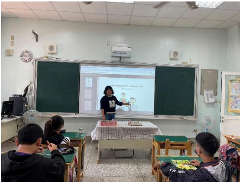
說明：教師的教學策略與教學活動設計能促進學生核心素養與表現任務的達成。