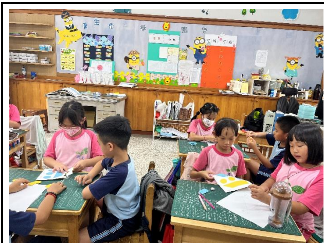
說明：利用附件學習立體概念