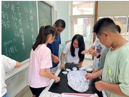
說明：學生表現任務的成果展現