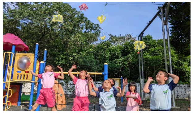
說明：投擲跳傘玩具，感受「跳傘趣」。