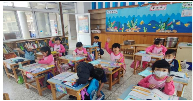
說明：教師佈題，學生搶答。