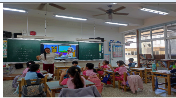
說明：教師說明教學主題。