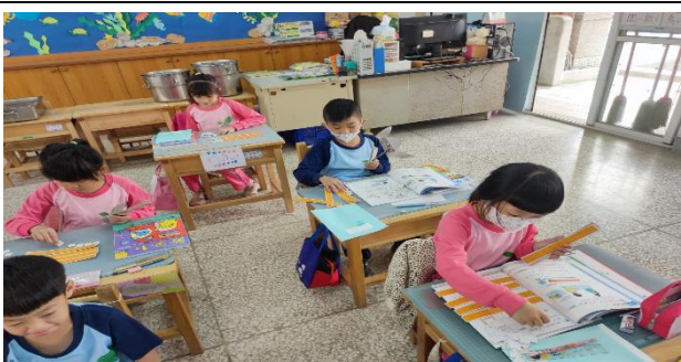
說明：算一算有多少。