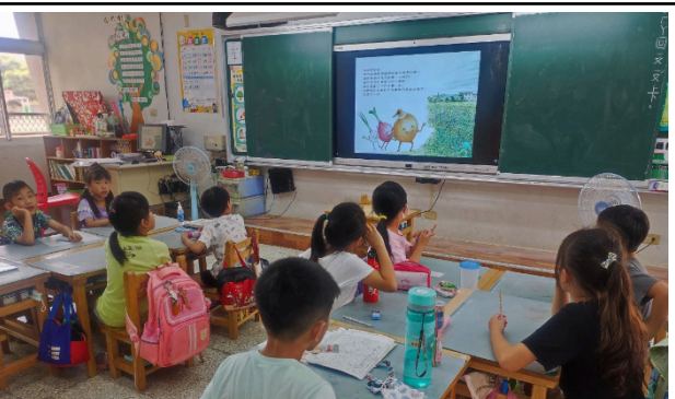
說明：繪本動畫欣賞-愛吹風的洋蔥。