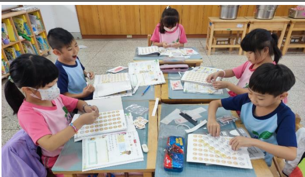
說明：認識錢幣，撕附件。