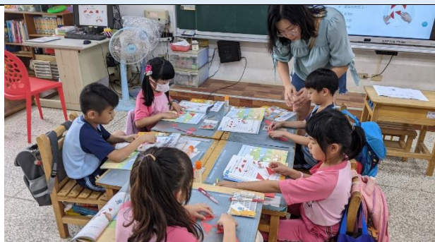
說明：練習拼出圖形。