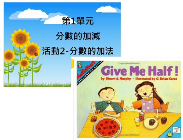
說明：英文繪本融入數學主題。