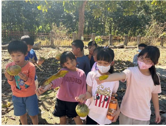
說明：走出教室尋找校園的植物