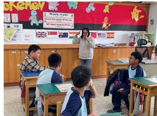
說明：與外籍教師的口語練習