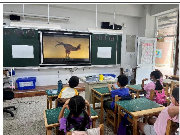
說明：欣賞傳統戲曲