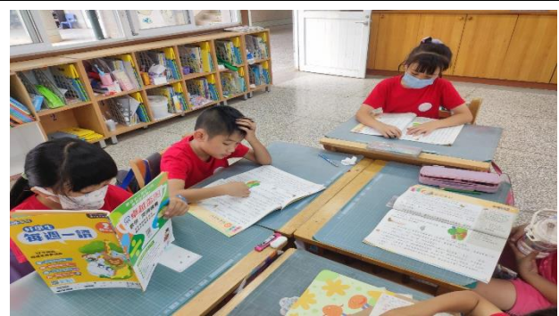
說明：文章閱讀理解。