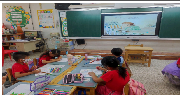
說明：觀看繪本動畫後開始創作。