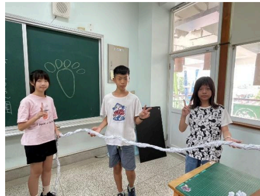
說明：學生分組準備道具