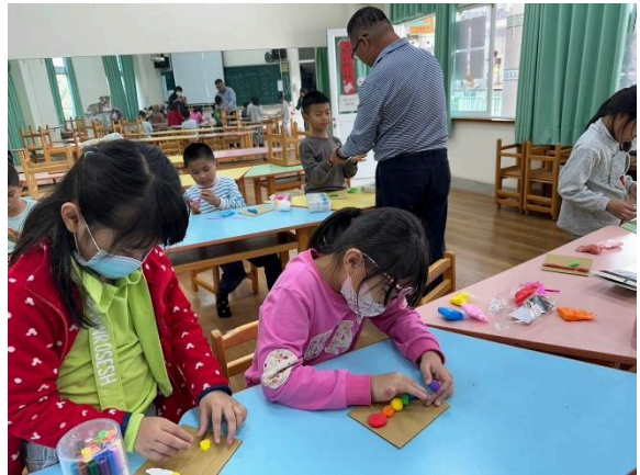
說明：繪本延伸教學活動