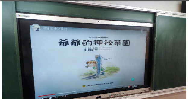
說明：欣賞繪本動畫，認識作物的種類與生長方式。