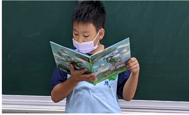
說明：閱讀分享繪本《哦！飛向左啊！飛向右》