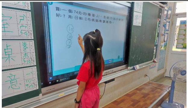
說明：學生上台解題。