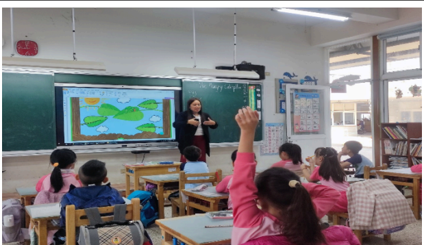
說明：依據圖片回答老師的問題。