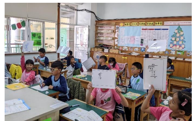
說明：利用數學小白板答題。