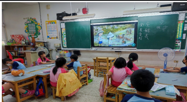
說明：藉由繪本動畫，了解不用農藥除蟲的方法。