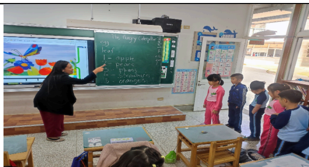
說明：進行課堂遊戲。