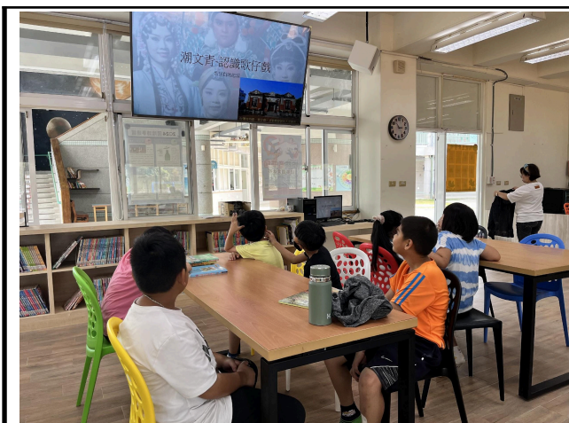
說明：認識傳統戲曲