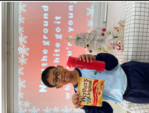
說明：融入西方節慶，促進學生學習成。