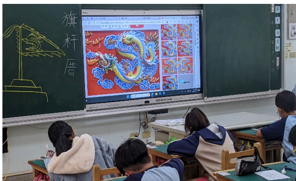
說明：解釋「旗」和「杆」的意義，並畫出常見的旗杆。