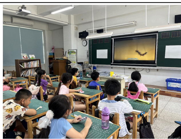
說明：欣賞傳統皮影戲