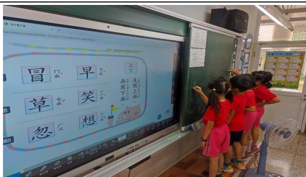
說明：寫出上下組合而成的生字。