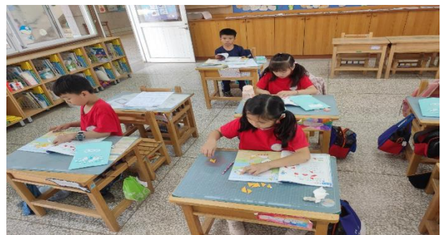
說明：找出一共要用幾個三角形才能完成圖形。