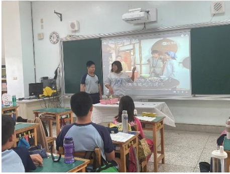
說明：透過多媒體素材讓學生加深印象