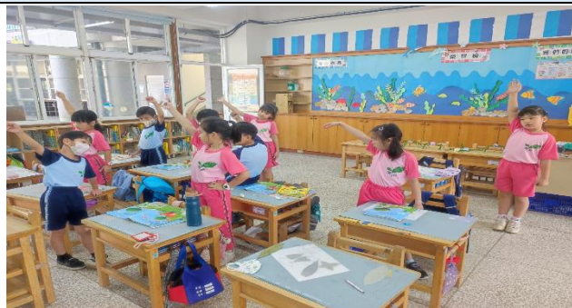
說明：練習音調辨認。