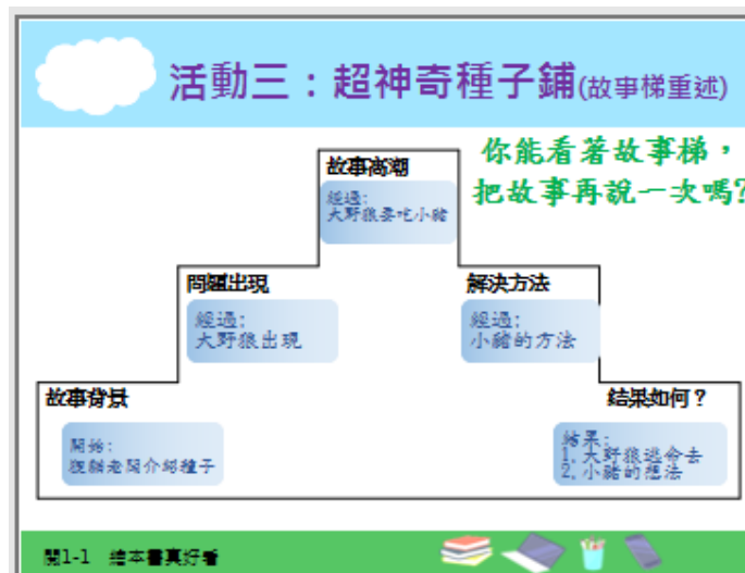
圖六超神奇種子鋪(故事梯重述)