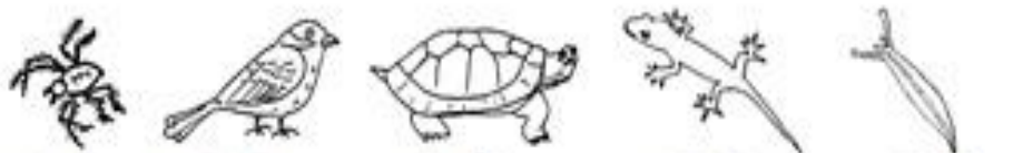
蝎(子) 麻(雀) 烏(龜) 壁(虎) 姑(娘)