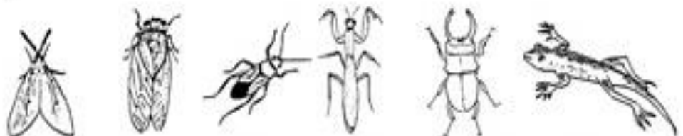
蟬 蟬 蝎(子) 獨(角)仙 獨(角)仙 蜥(蜴)