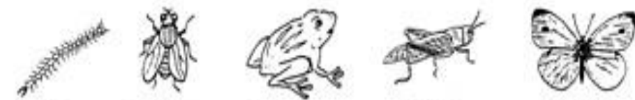
蜈(蚣) 蒼(蠅) 青(蛙) 蝗(蟲) 蝴(蝶)