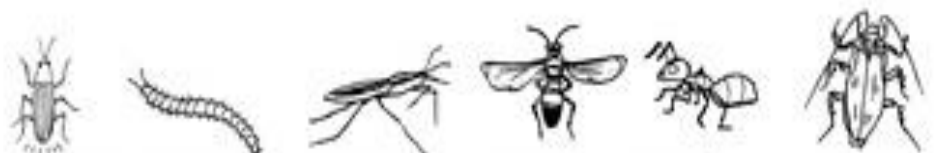
螢(火)蟲 蜈(蚣) 水(龜) 胡(蝶) 螞(蟻) 蟬(螂)