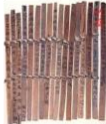
用竹子或木頭做的簡牘