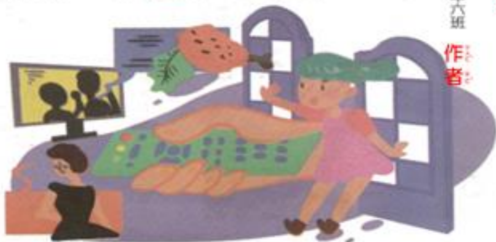
圖3-1-1 覺察不同媒體的運用時機

放。我希望媒體可以帶給我們歡樂與平安的力量，那些不好的人事物，切莫強力放送，好讓社會充滿善良風俗。