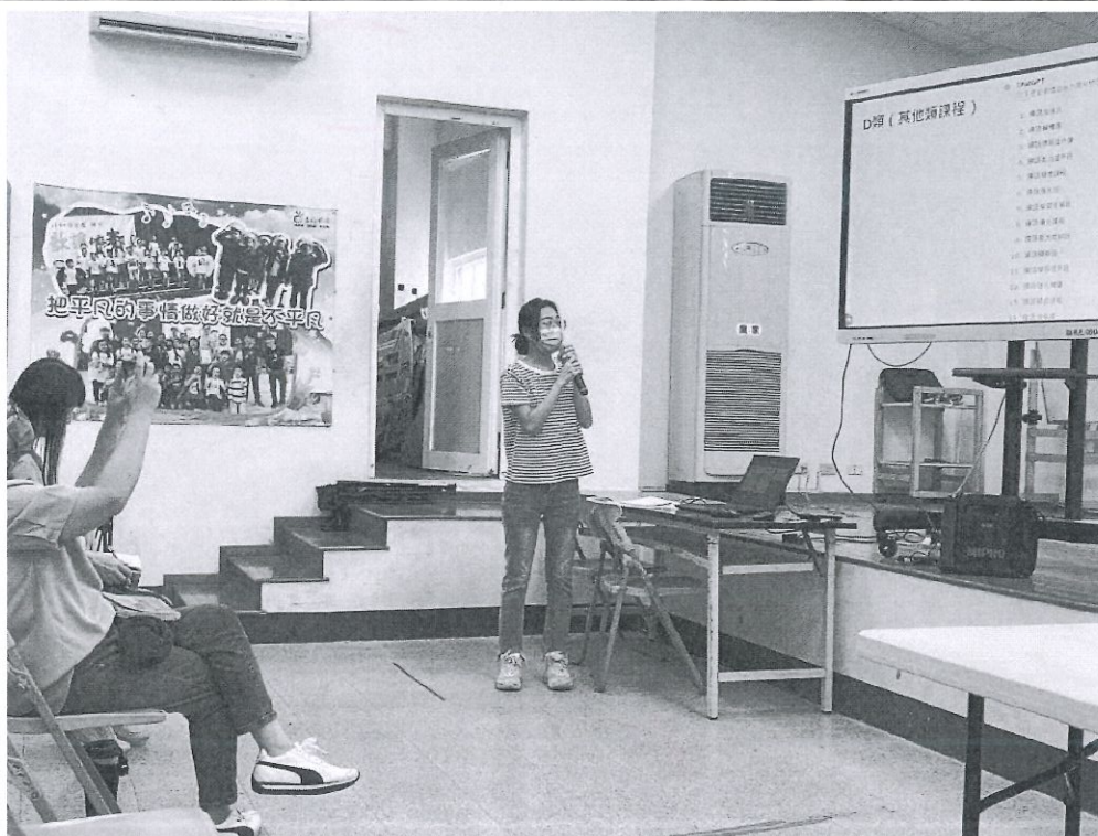
檢視彈性學習課程內容與討論