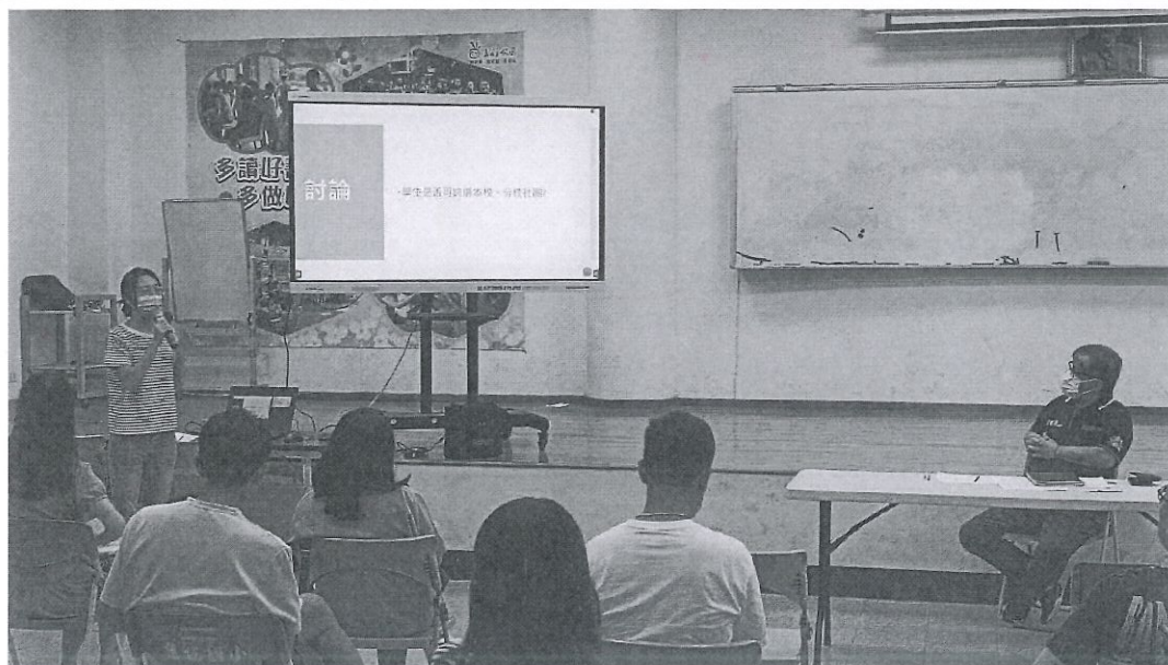
討論社團課程實施狀況