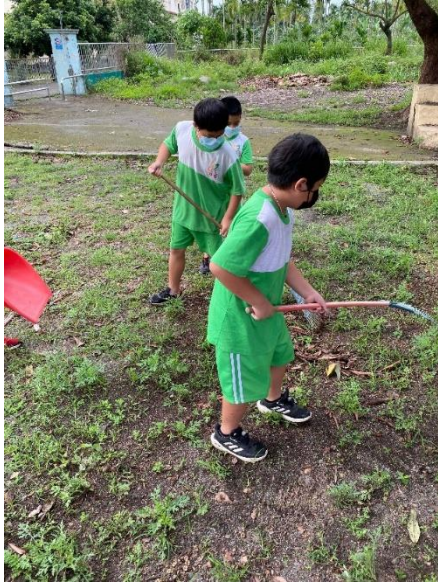
說明：維護環境整潔