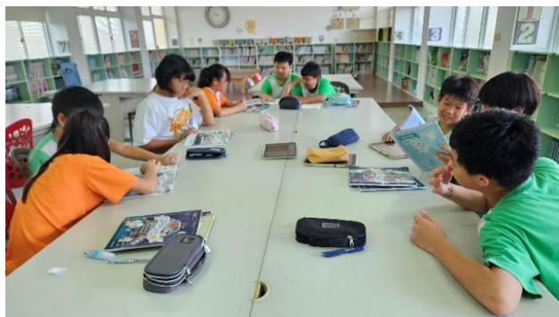
說明：分組學習討論