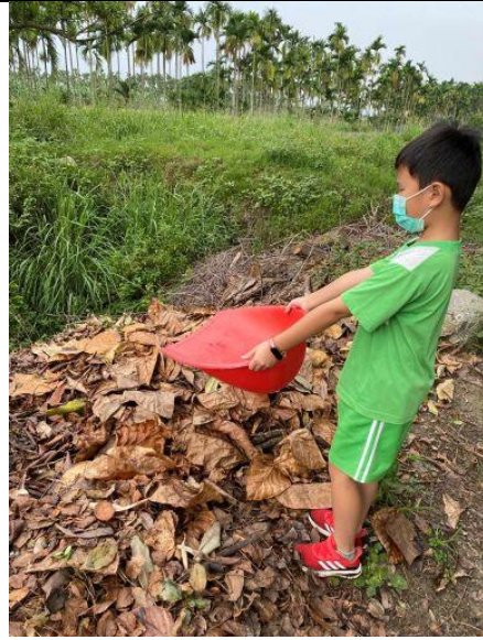
說明：做好落葉堆肥