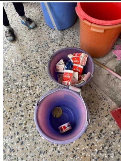
說明：垃圾分類可以達到垃圾減量