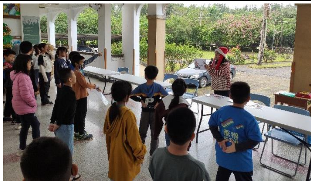
說明：配合聖誕節英語闖關活動