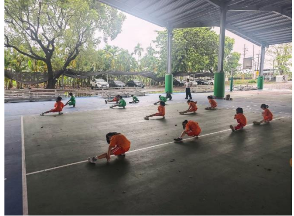
說明：教師指導學生熱身運動