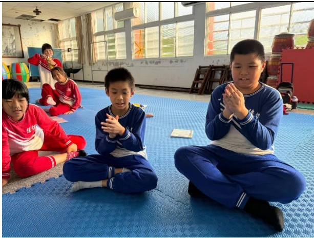
說明：分組練習直笛吹奏