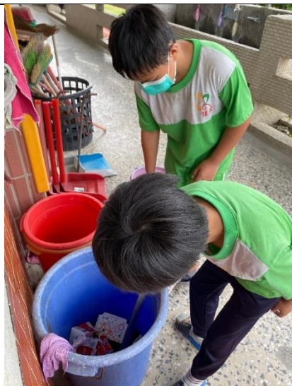
說明：做好資源回收