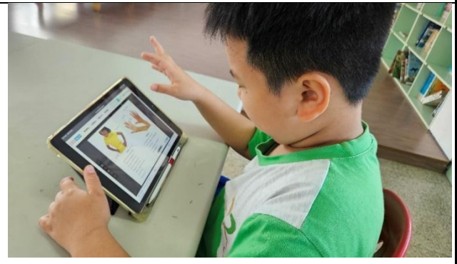
說明：酷英任務執行中