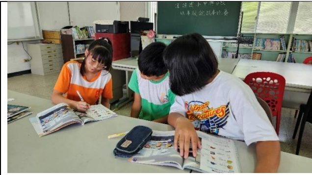
說明：分組學習(強帶弱)