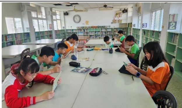
說明：單元課程上完派任務，實測學習效果