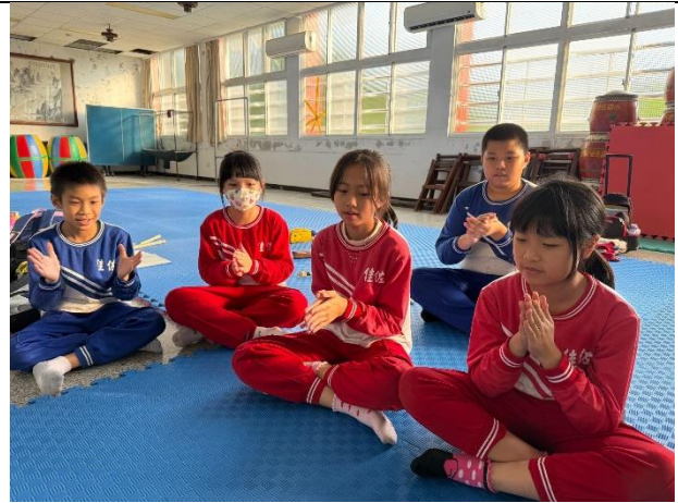
說明：直笛合奏練習