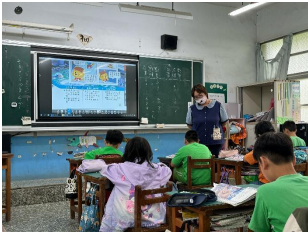
說明：教師巡視學生作答