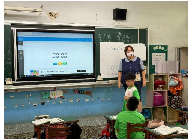
說明：教師檢討各組答案