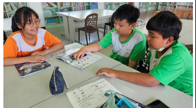
說明：分組學習(強帶弱)