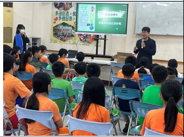
說明：節能電器如何選購