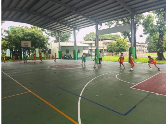
說明：課程中進行躲避球的比賽