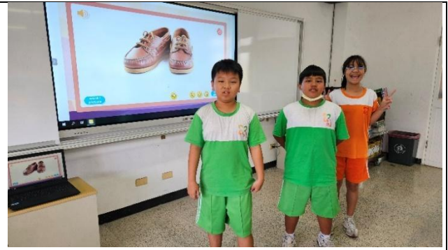
說明：分組上台演示學習成果