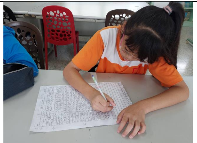
說明：完成一篇寫作。