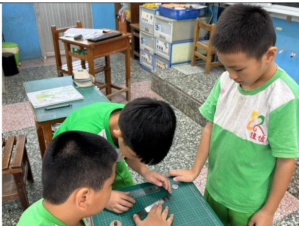
說明：學生分組實作量長度