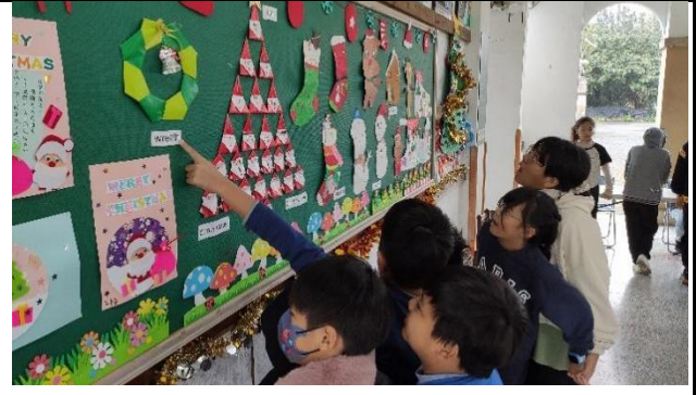
說明：聖誕節英語單字拼讀大賽