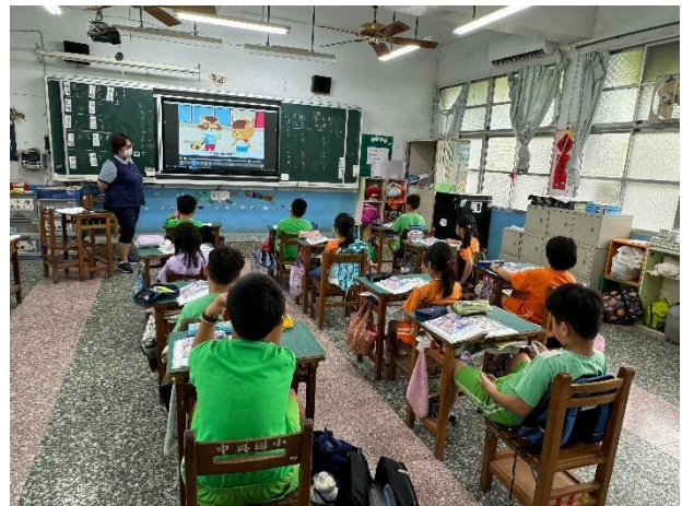
說明：教師解說學習重點知識