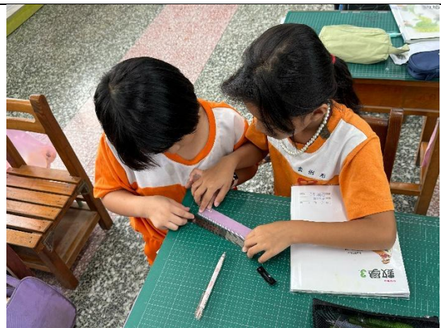
說明：學生分組實作量長度