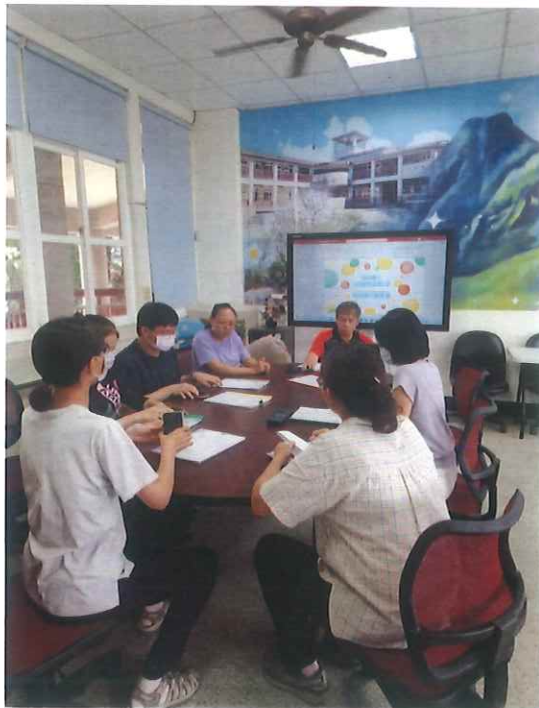
說明：校長主持特推會