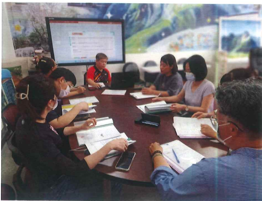
說明：114 專團申請、114 教助申請