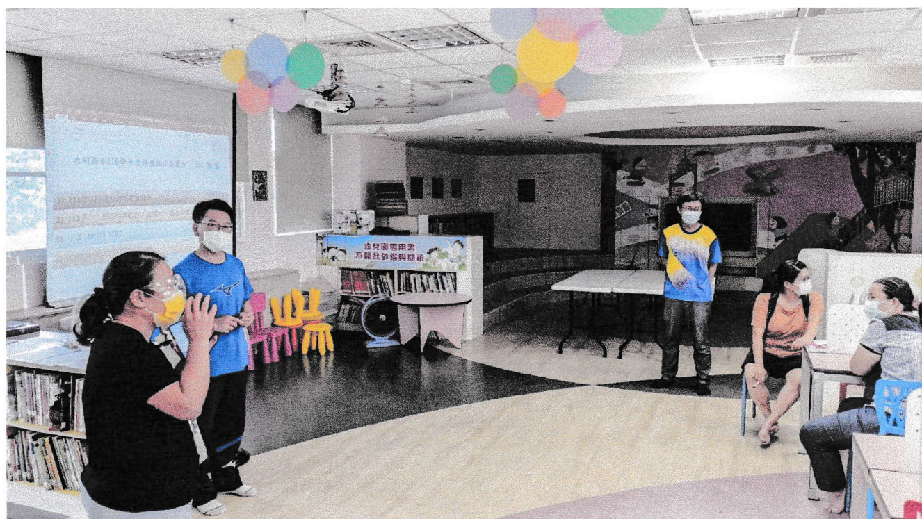
說明：特教老師引導討論相關議題