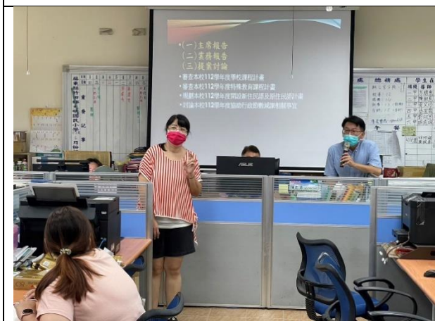
說明:教務組長說明本土語言開課事宜