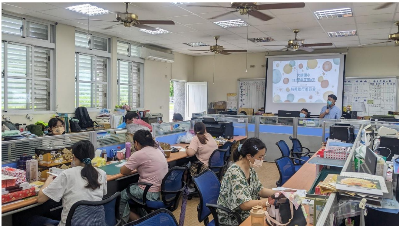
說明：校長主持特推會