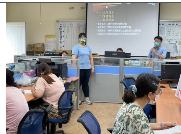
說明:教導主任說明彈性課程的安排