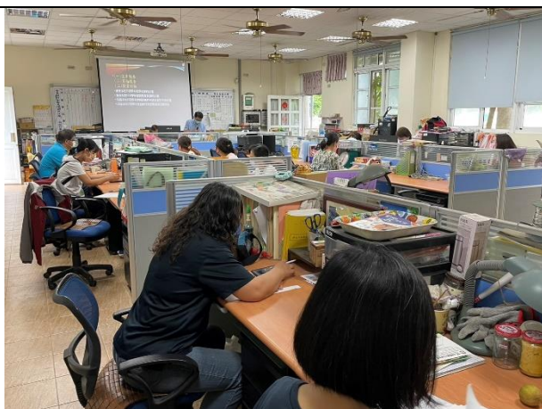
說明:校長說明減課事宜