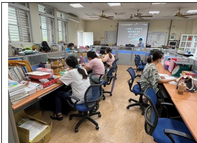
說明:校長主持會議