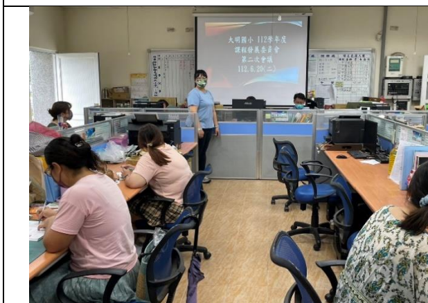
說明:教導主任說明校本課程