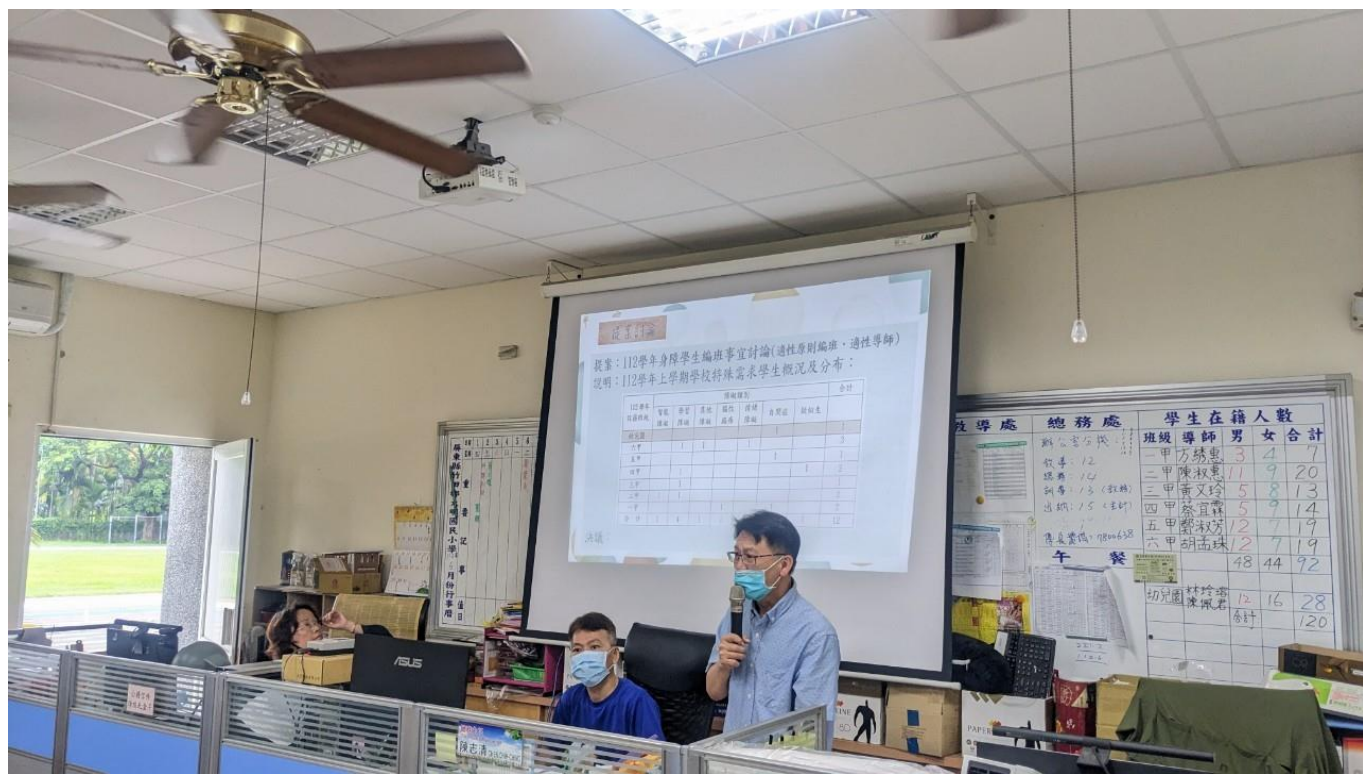
說明：審議 112 學年度身障生編班事宜及適性導師