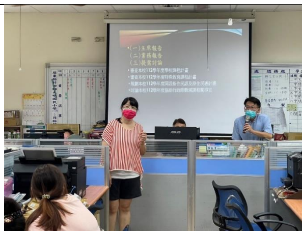
說明:審核112學年度課程計畫