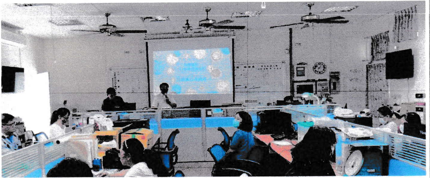
說明：校長主持特推會