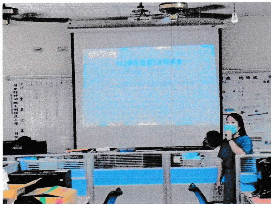
說明：113 專團申請教助申請