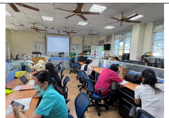
說明：老師們審核114學年度課程計畫