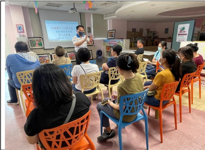
說明：校長主持會議