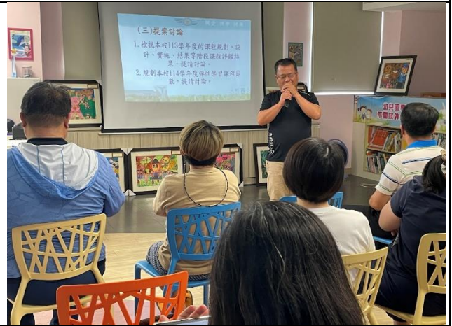
說明：教導主任說明課程計畫的書寫注意事項