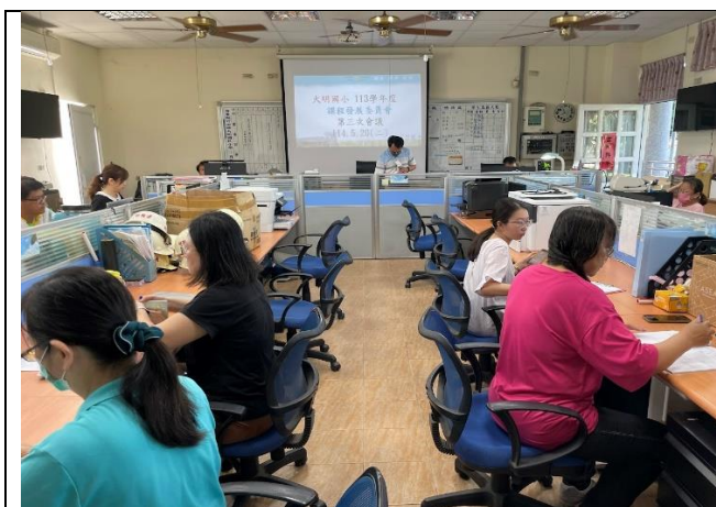
說明：校長主持會議