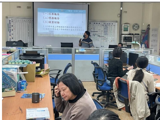
說明:校長說明此次課發會重點