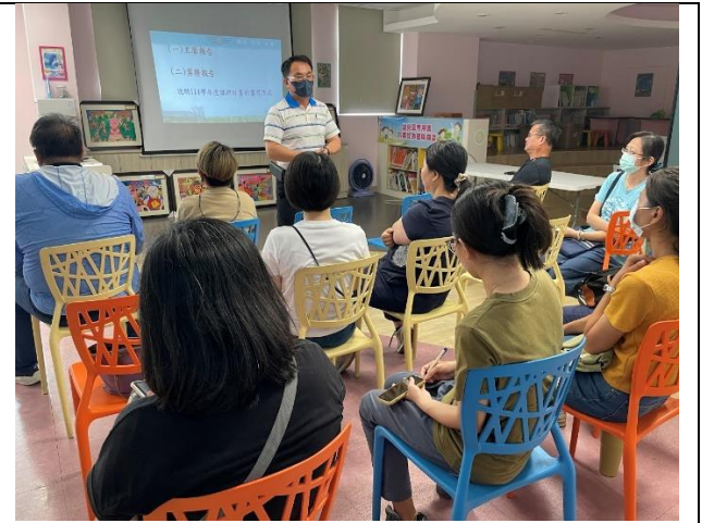
說明：主席說明本次習寫重點