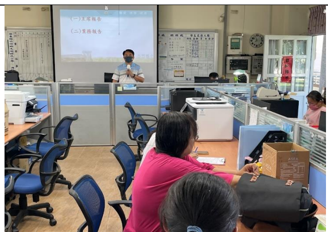
說明：主席說明本次討論重點