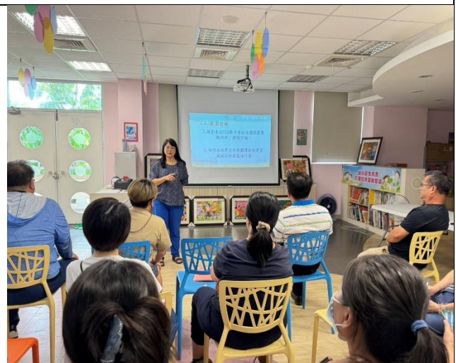
說明：教學組長說明法規議題的改變