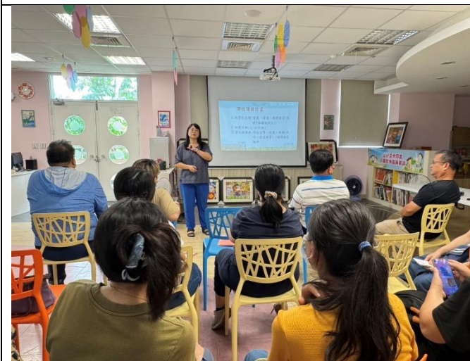
說明：老師與教學組長討論校本課程