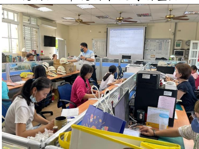
說明：老師們參與課程評鑑討論