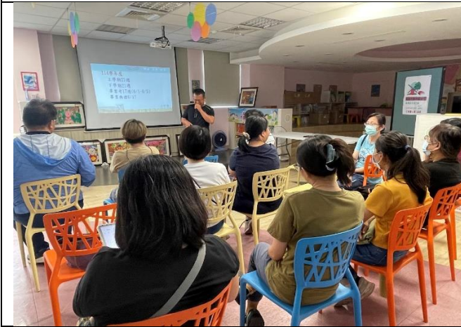
說明：教導主任說明114學年度上課週次