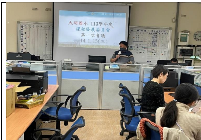
說明:校長主持會議