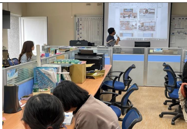
說明:校長帶領全校老師一起研討