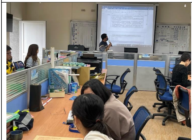
說明:老師能參與討論