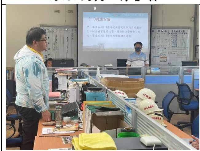
說明：訓育組長說明課程計畫交通安全統整性主題的課程