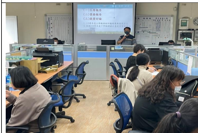
說明:校長帶領老師一起討論健康促進議題