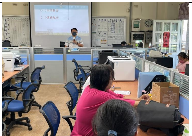
說明：主席說明本次討論重點