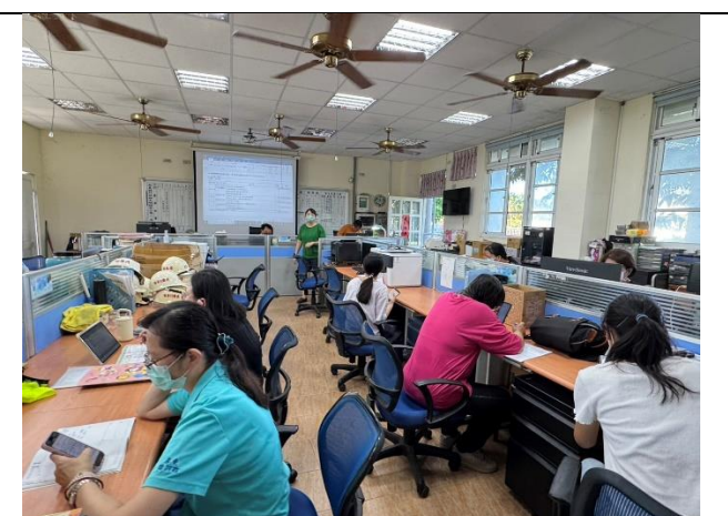
說明：老師們審核114學年度課程計畫