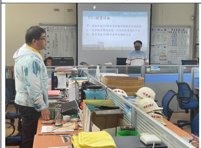
說明：訓育組長說明課程計畫交通安全統整性主題的課程