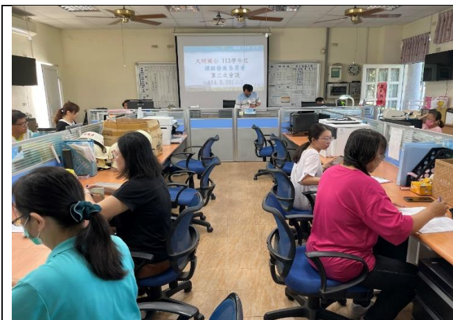
說明：校長主持會議