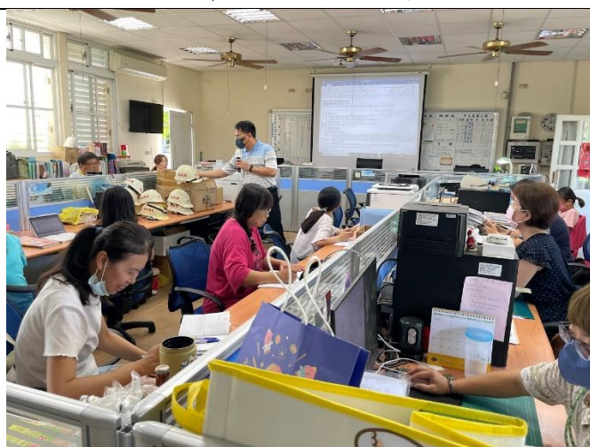
說明：老師們參與課程評鑑討論