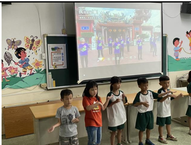
說明：各班代表上台表演食物拼盤歌曲