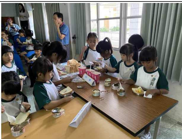
說明：學生根據指示按照順序拿六大類食物