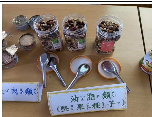
說明：實施食物彩色拼盤活動