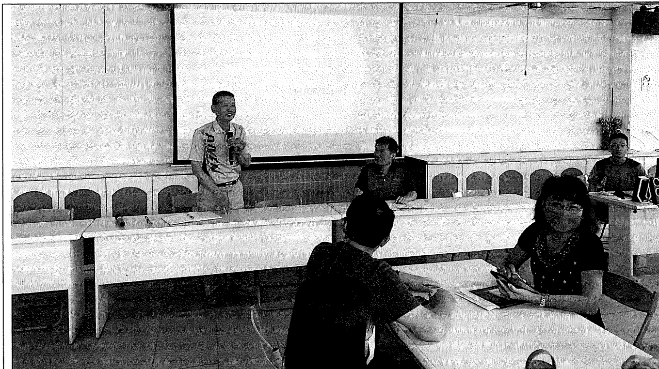
說明：校長說明此次議題。