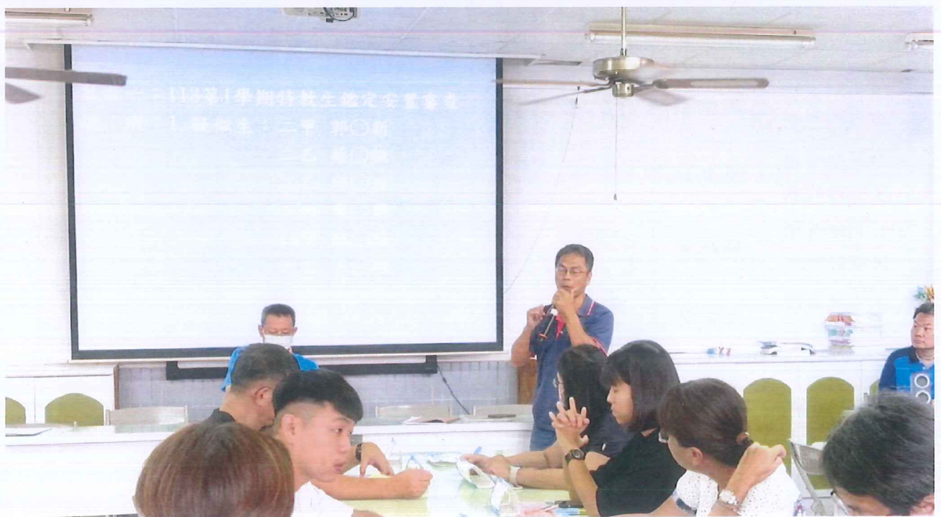
說明：特教老師說明提出鑑定安置學生情形