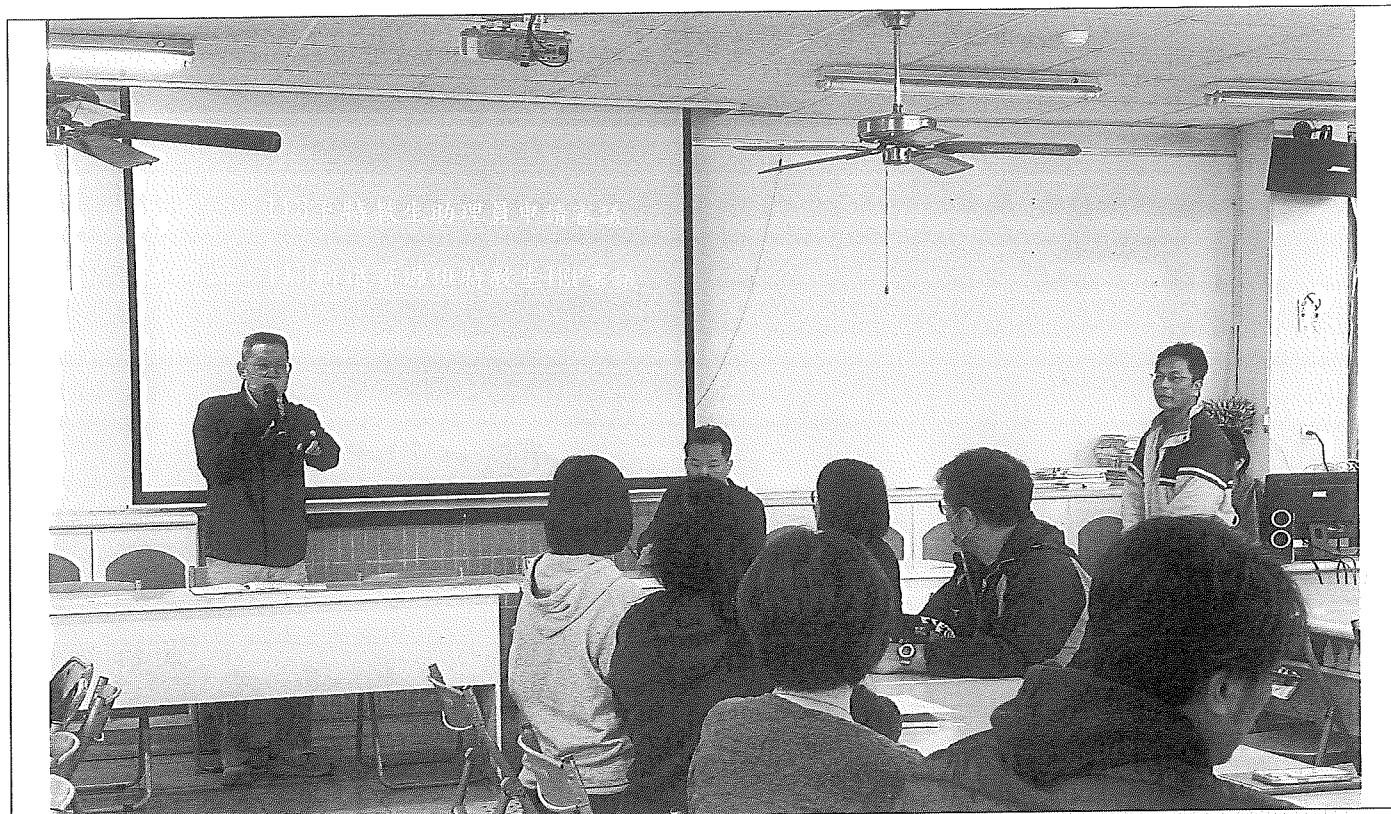
說明：校長說明此次議題。