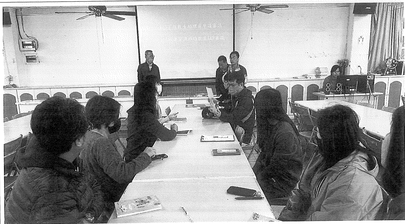
說明：家昌老師說明 113 學年度資源班新進學生名單。