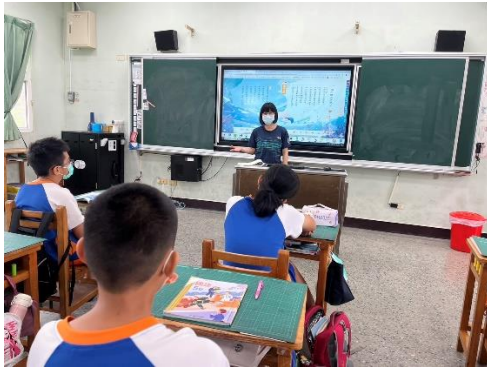
說明：學生認真參與