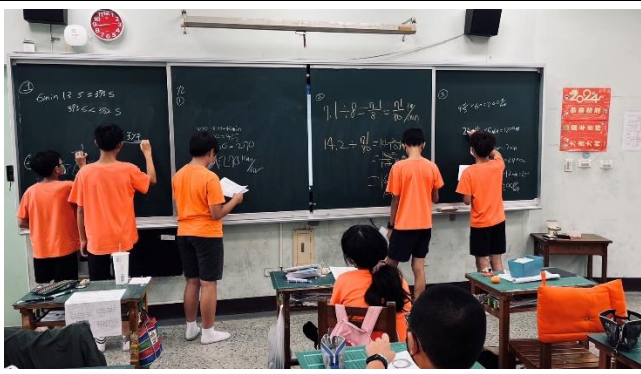
說明：學生上台演算數學題目