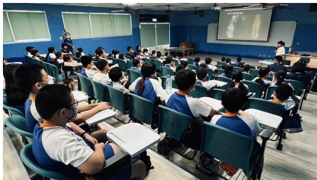
說明：參加小琉球保護海龜課程