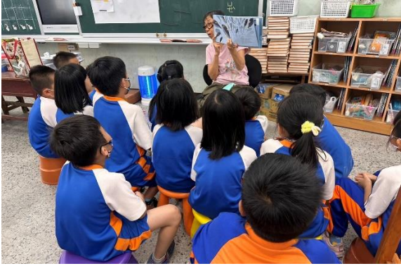
說明：「黑鮪魚的旅行」繪本導讀