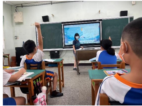
說明：針對課文內容提問