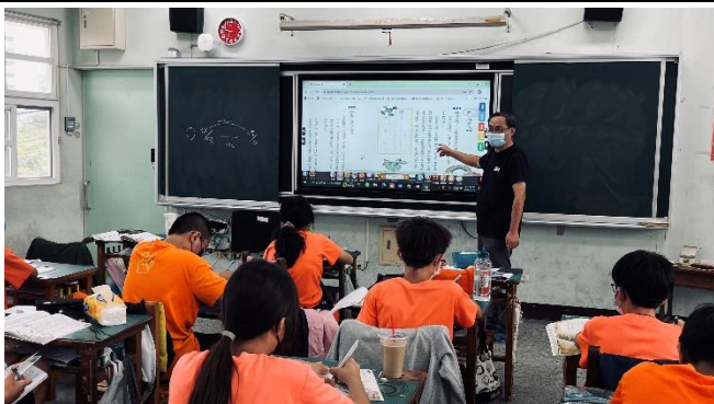
說明：老師做課本內容的教學