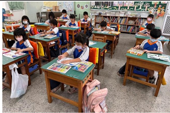
說明：學生分辨與創作鮪魚圖樣