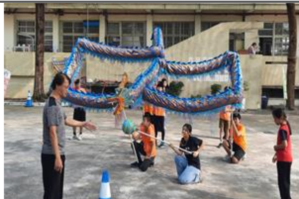
說明：教練講解與動作練習