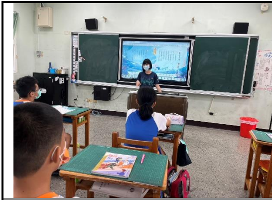
說明：課文內容講解