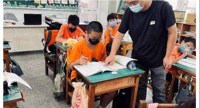
說明：老師指導學生撰寫習作題型