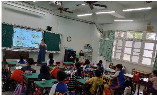
說明：與醫師、藥師配合用藥