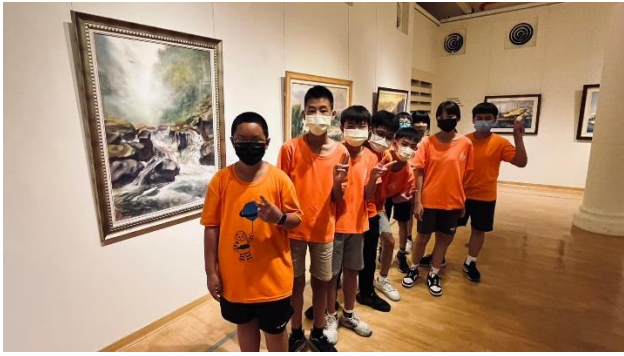
說明：參觀美術館油畫畫作展覽