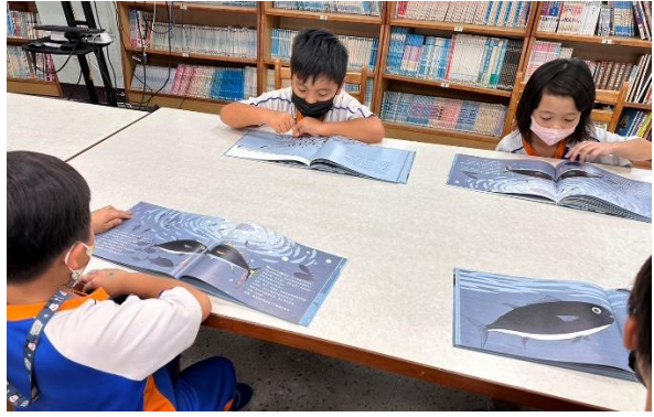
說明：「黑鮪魚的旅行」繪本閱讀