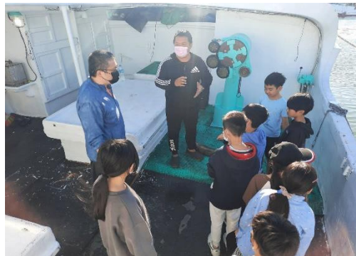
說明：船員說明漁船上的器械