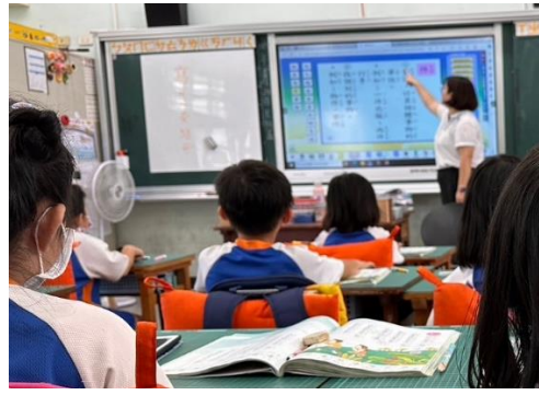
說明：字義教學，情境舉例