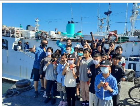
說明：學生難得的體驗。