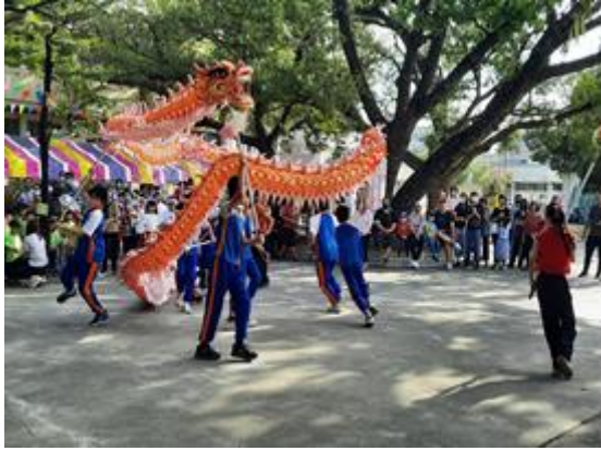
說明：校慶踩街定點表演