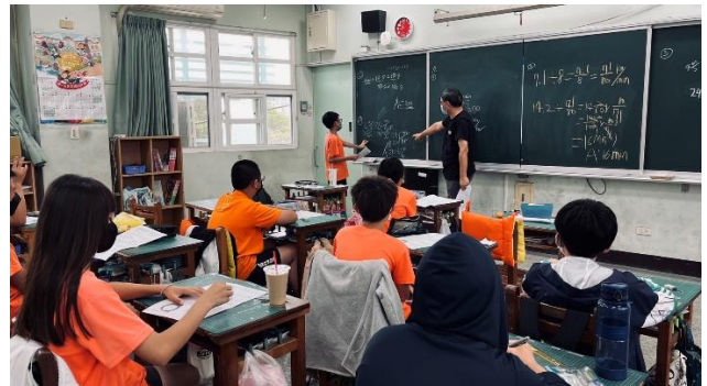
說明：老師讓學生自行說出解題方式