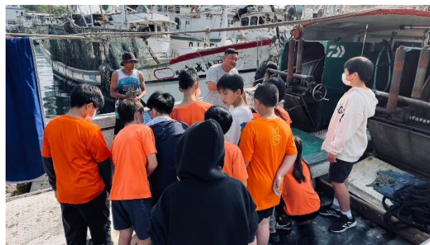
說明：參觀漁船了解漁業發展的困境