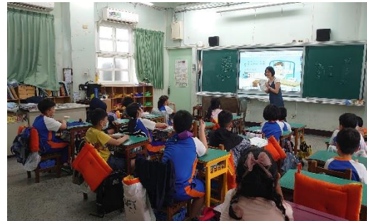
說明：藥袋上的資訊