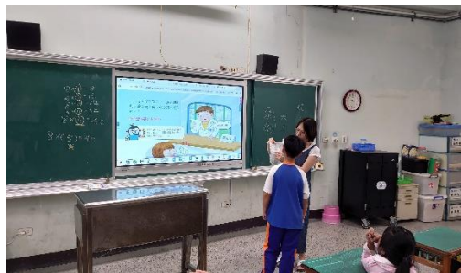
說明：請學生分享自己的藥袋