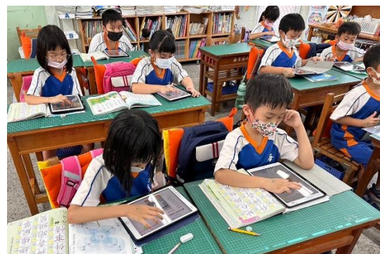
說明：學生進行課前筆順網預習