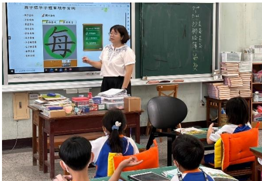
說明：筆順網操作教學