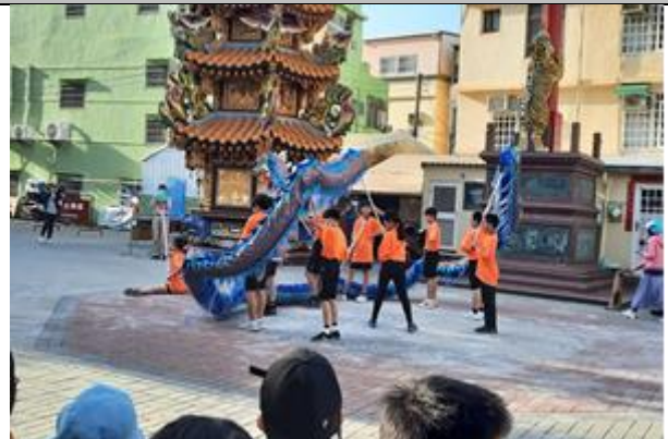
說明：校慶踩街定點表演