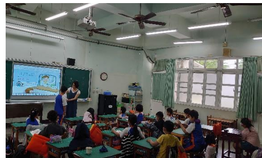
說明：請學生分享藥袋上的訊息