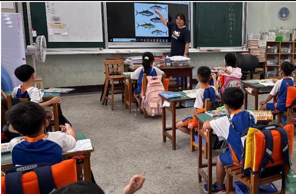
說明：東港常見鮪魚種類介紹