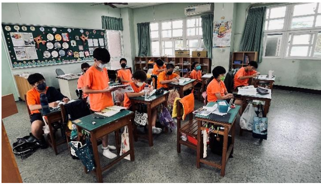
說明：學生朗誦課本內容