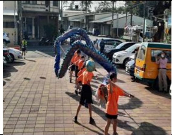
說明：校慶開幕表演