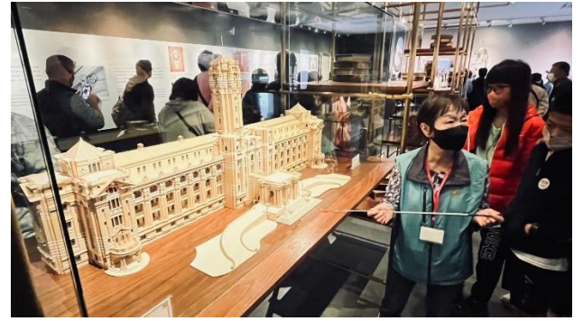
說明：參觀總統府欣賞其建築物之美