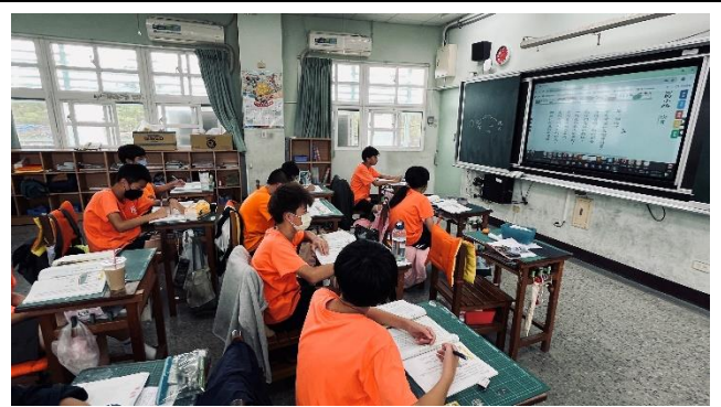
說明：學生先閱讀了解課本段落意涵