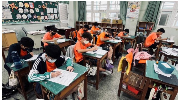
說明：學生練習數學題目