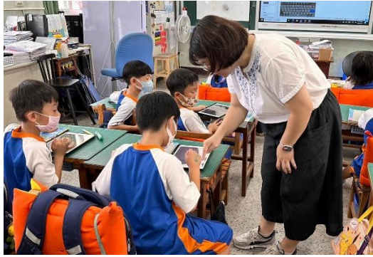
說明：個別指導學生