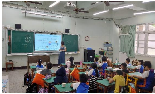
說明：詢問學生用藥經驗