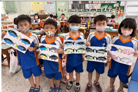
說明：學生創作鮪魚圖樣