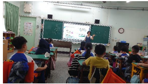
說明：說明用藥原則