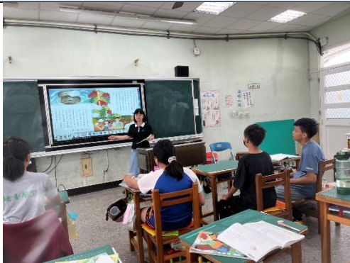
說明：課文內容講解