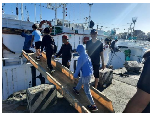
說明：配合校本課程學生登上漁船參觀。