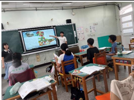
說明：學生認真參與