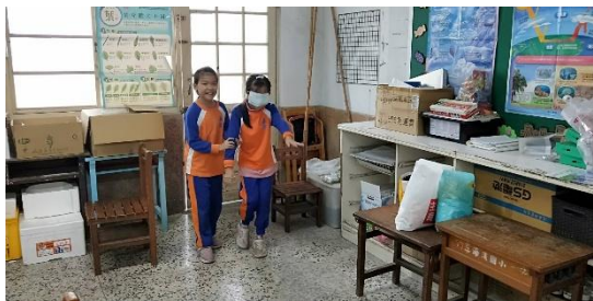
說明：體驗視障者走路