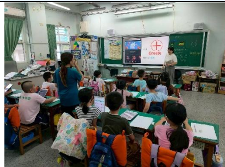
說明：講解製作動畫軟體