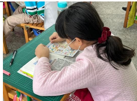
說明：構思架構，完成一篇剪報心得。