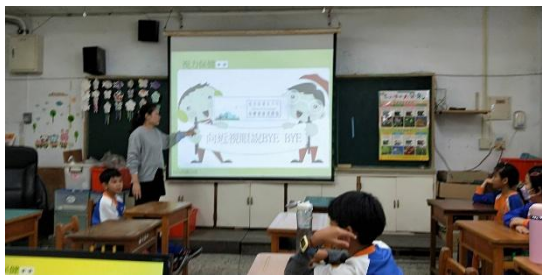
說明：講解視力保健的重要性