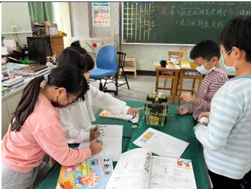
說明：小組練習重量平衡的記錄方式