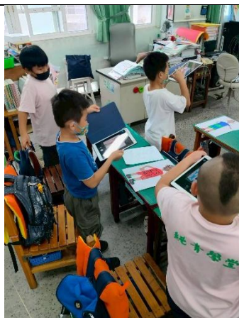
說明：學生利用平板拍自畫像，結合英語自我介紹，完成動畫。