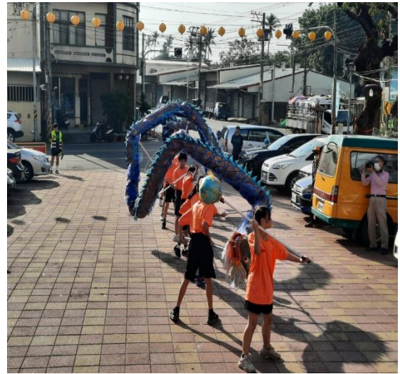
說明：校慶踩街定點表演