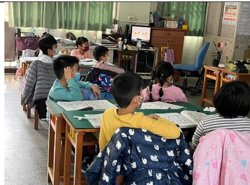
說明：全班共同討論課本練習題。