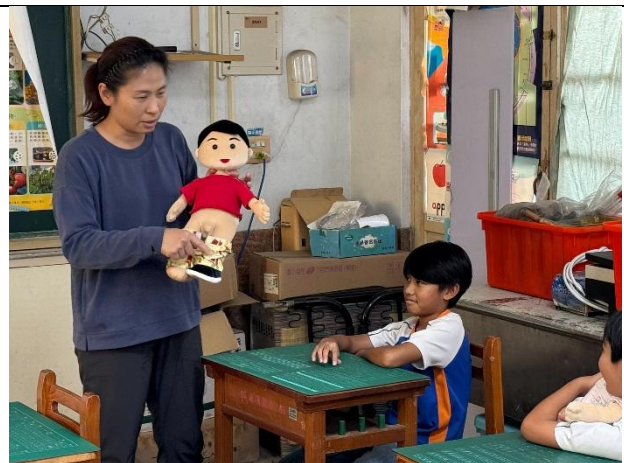
說明：利用娃娃道具介紹男女生殖器官