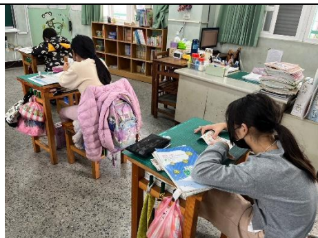
說明：利用漫畫篇來實作。