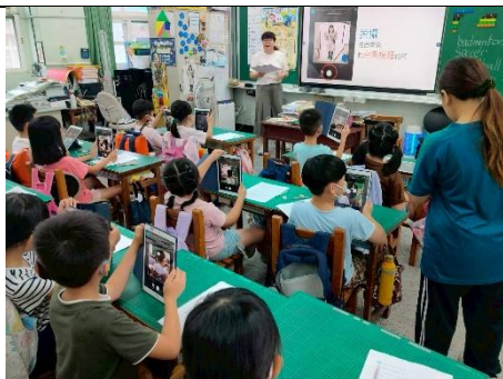
說明：教導如何使用平板拍照