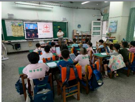
說明：講解製作動畫軟體