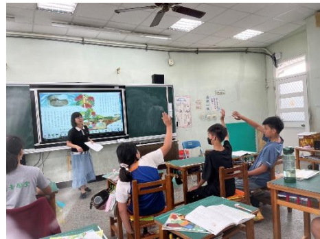
說明：針對課文內容提問