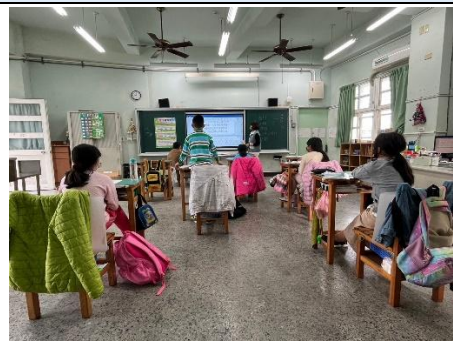
說明：剪報的心得，是造句的延伸。