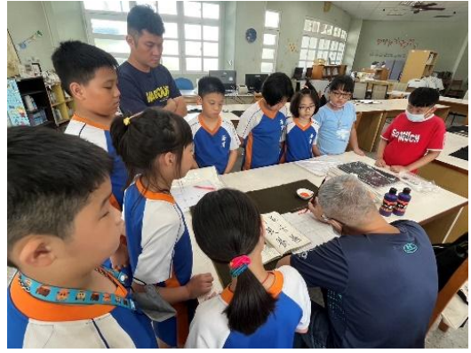
說明：書法老師指導學生寫字