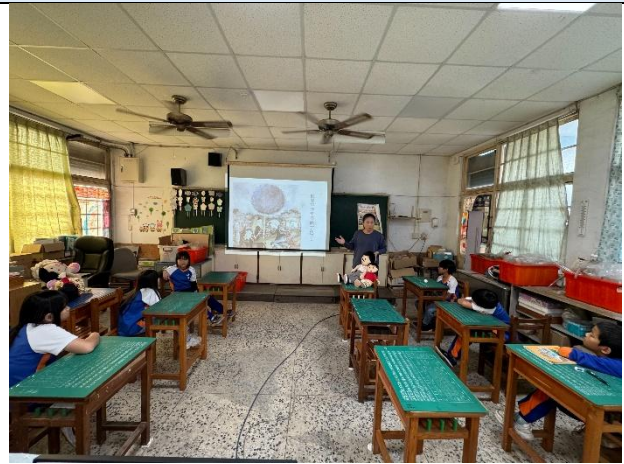
說明：教師繪本講述