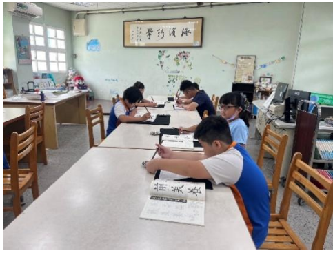
說明：學生自己練習寫