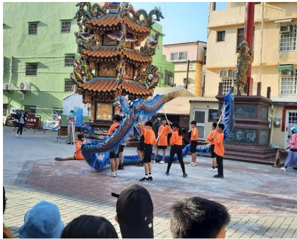
說明：校慶踩街定點表演