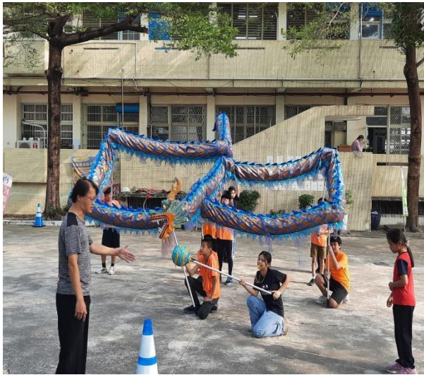
說明：教練講解與動作練習