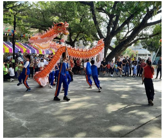
說明：校慶開幕表演