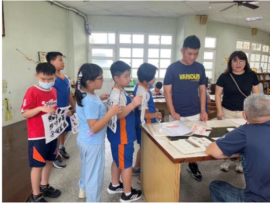
說明：書法老師指導字的架構