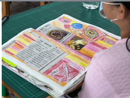
說明：複習剪報元素。