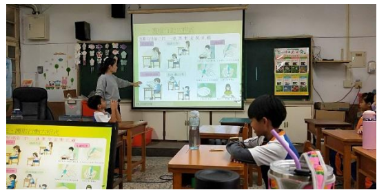
說明：護眼行動六招式