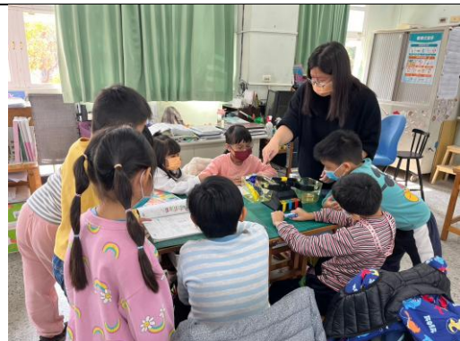
說明：學生實際操作後，教師進行歸納統整。