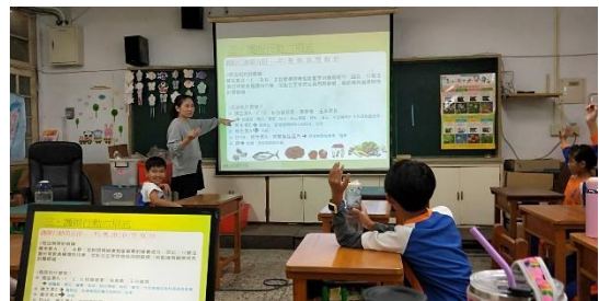
說明：護眼行動六招式