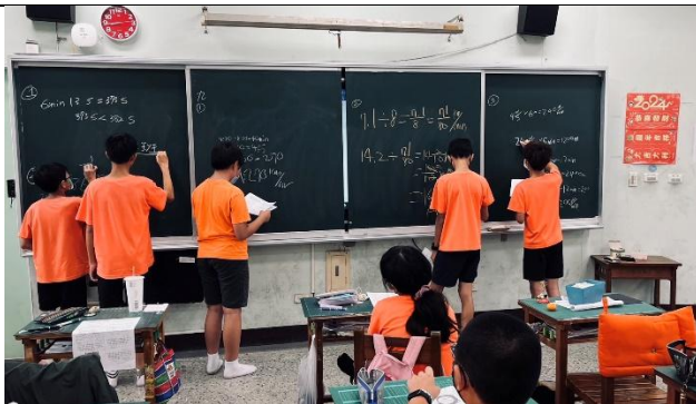
說明：學生上台演算數學題目