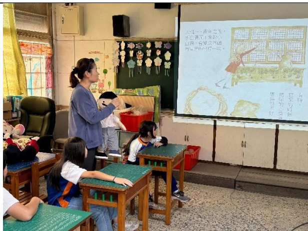
說明：教師講述青春期的知識