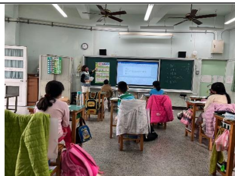
說明：作文的書寫要素。