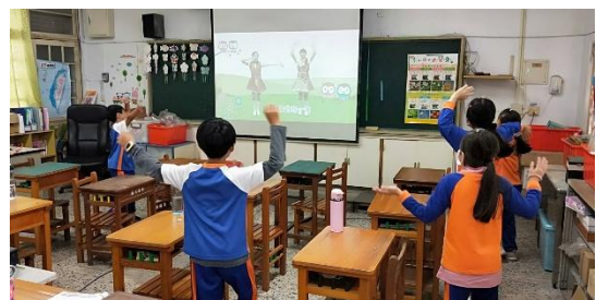
說明：練習跳護眼操