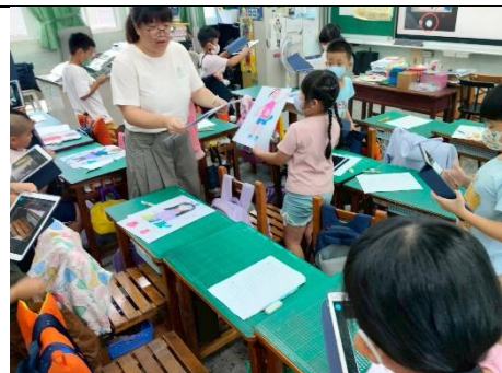
說明：將自畫像發給學生