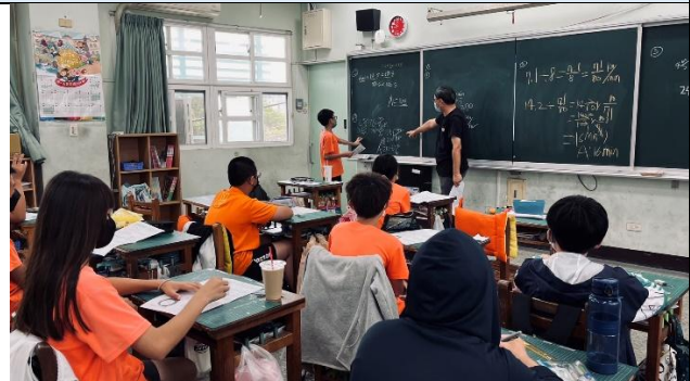
說明：老師讓學生自行說出解題方式