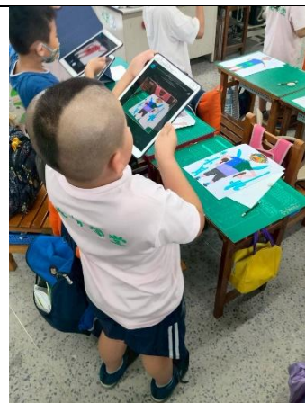
說明：學生利用平板拍自畫像，結合英語自我介紹，完成動畫。