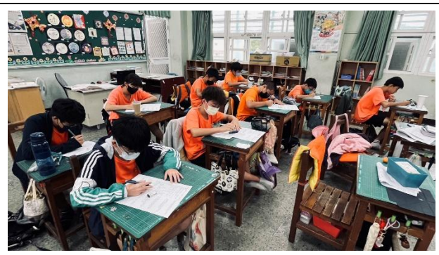
說明：學生練習數學題目