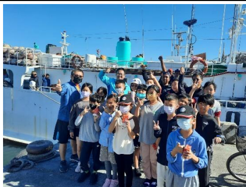
說明：學生難得的體驗。