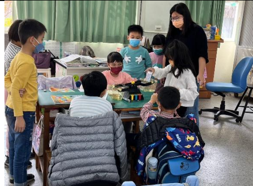
說明：教室尋寶，利用教室物品設法讓天平平衡。