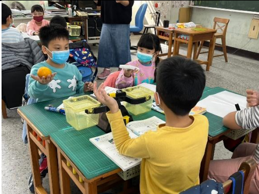
說明：學生掂量重量，培養量感。