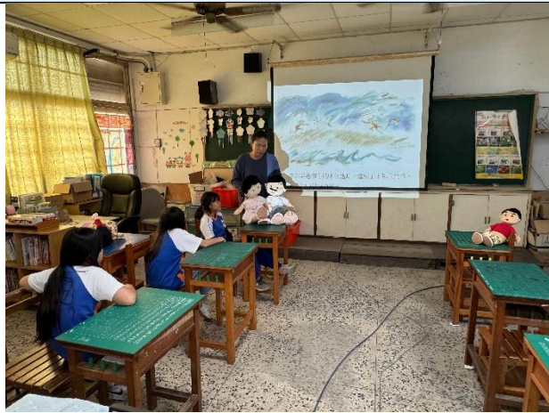
說明：利用道具教學說