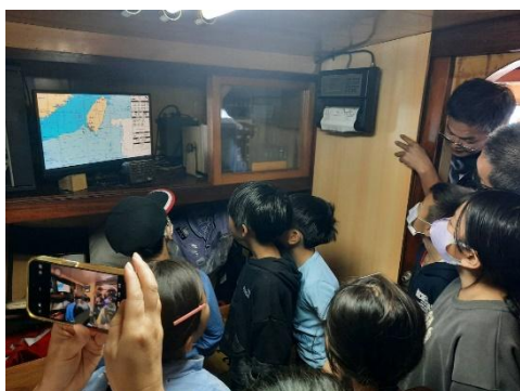
說明：船長說明科技運用於船隻航行及捕魚作業。