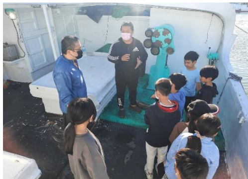
說明：船員說明漁船上的器械