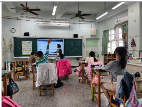
說明：作文是心得的延伸。