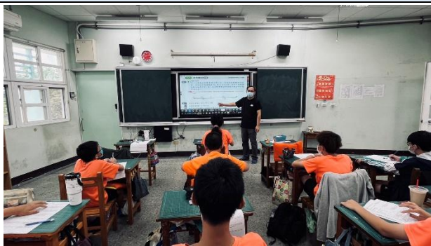
說明：老師剖析課本題目的內容