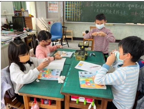
說明：學生使用黏土，設法讓天平平衡。