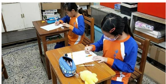
說明：請學生寫前後側