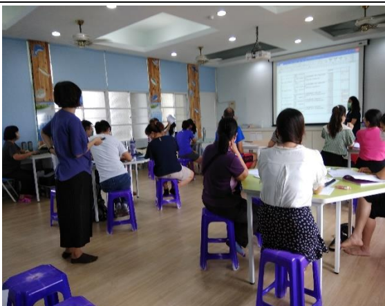
說明：課程計畫各年段審查