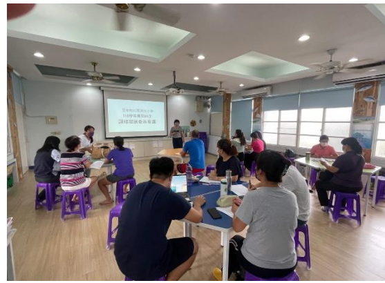
說明：第四次課程發展委員會審查業務說明及提案討論