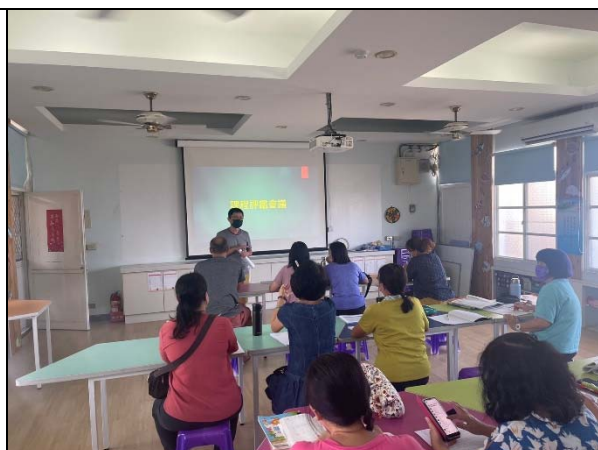
說明：第四次課程發展委員會審查業務說明及提案討論