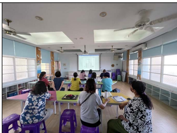
說明：課程計畫各年段審查