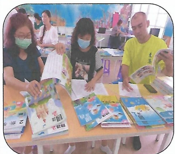
說明:雅華主任主持教科用書評選會議、各領域教師進行教科用書評選