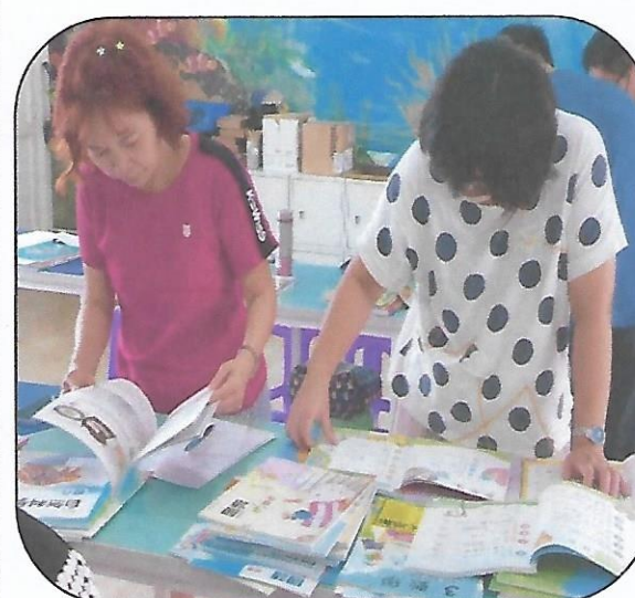
說明:各領域教師進行教科用書評選