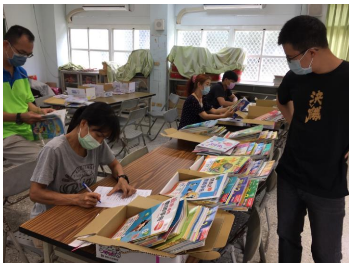
說明：教師檢閱教科書進行評選