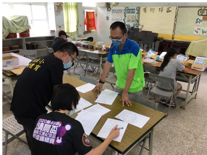
說明：教師檢閱教科書進行評選