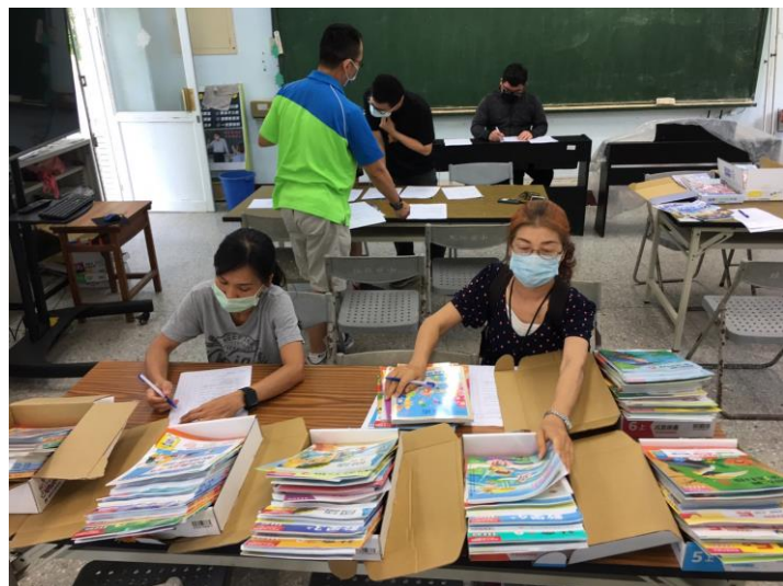
說明：教師檢閱教科書進行評選