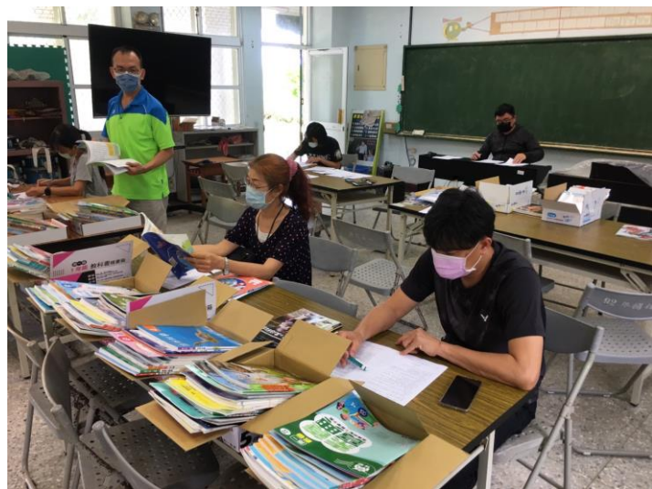
說明：教師檢閱教科書進行評選