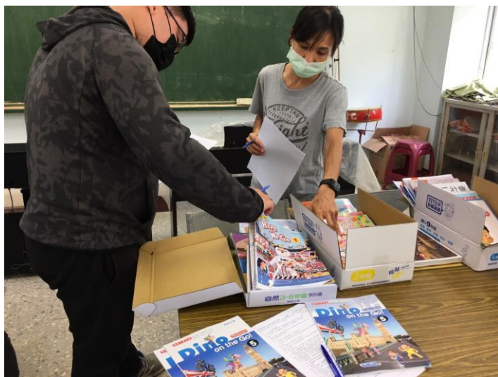
說明：教師檢閱教科書進行評選