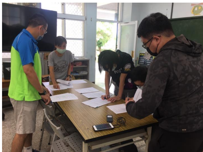
說明：教師檢閱教科書進行評選