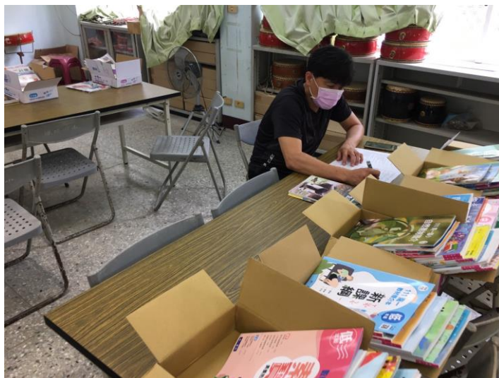
說明：教師檢閱教科書進行評選