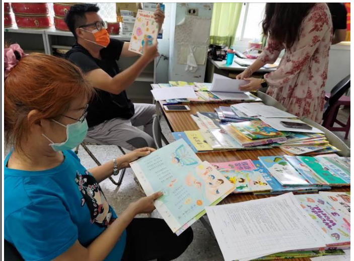
說明：教師檢閱教科書進行評選