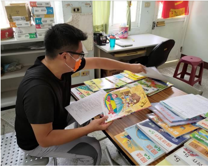
說明：教師檢閱教科書進行評選