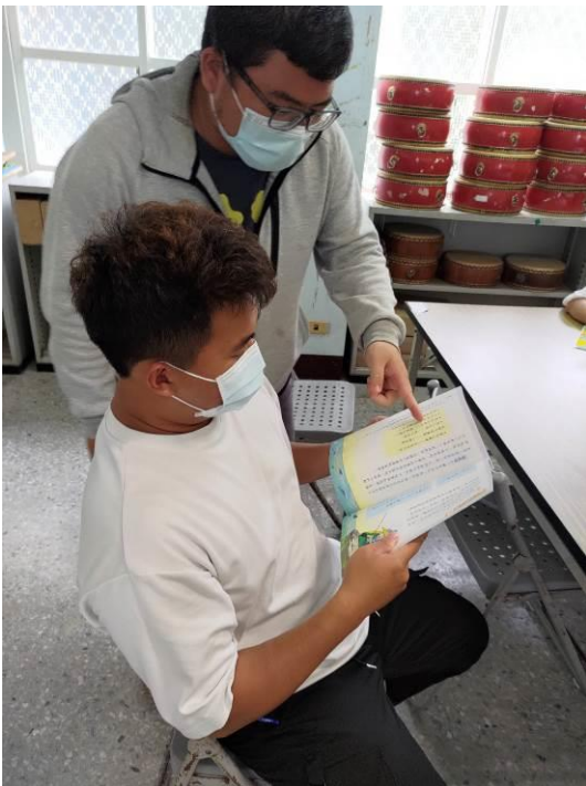
說明：教師檢閱教科書進行評選