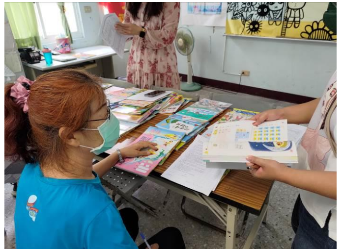
說明：教師檢閱教科書進行評選