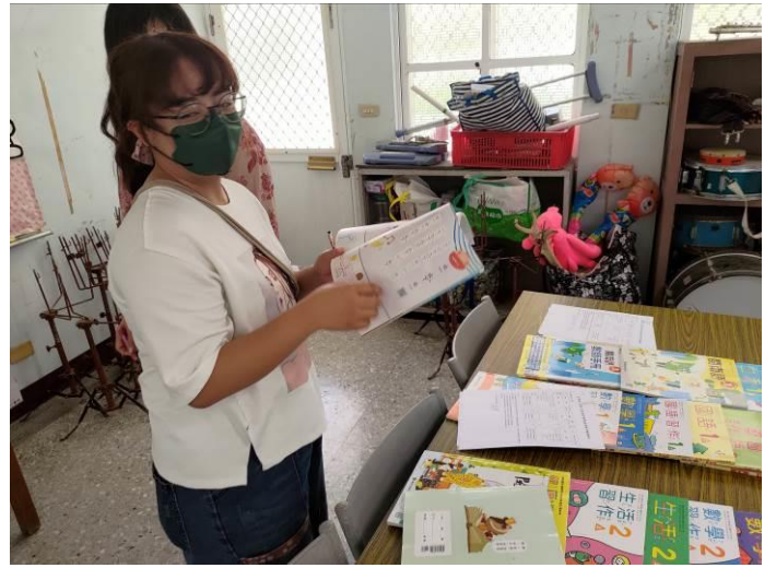
說明：教師檢閱教科書進行評選