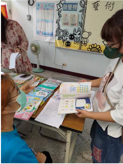
說明：教師檢閱教科書進行評選