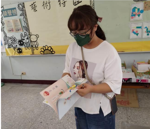
說明：教師檢閱教科書進行評選