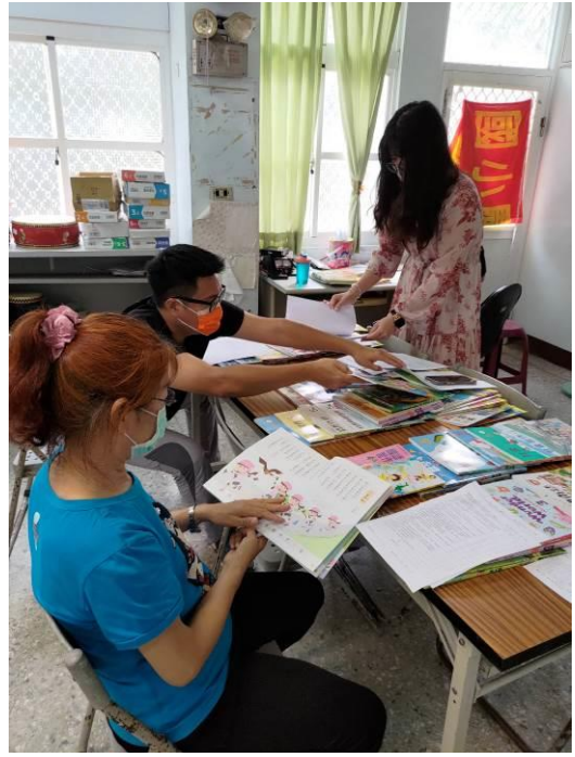
說明：教師檢閱教科書進行評選