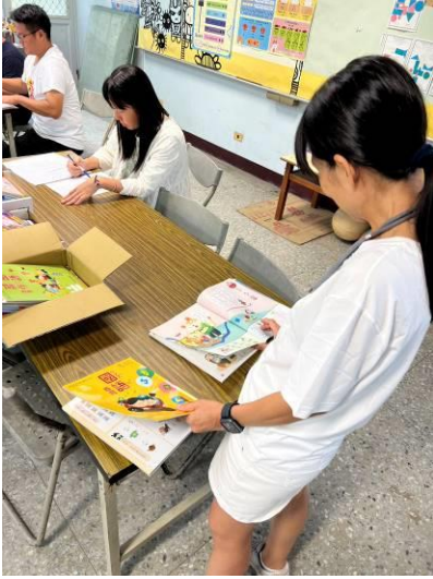
說明：教師檢閱教科書進行評選