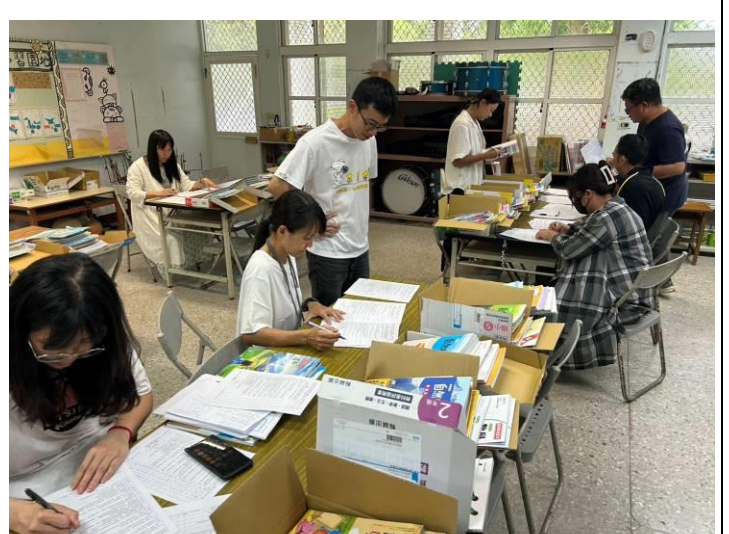
說明：教師檢閱教科書進行評選