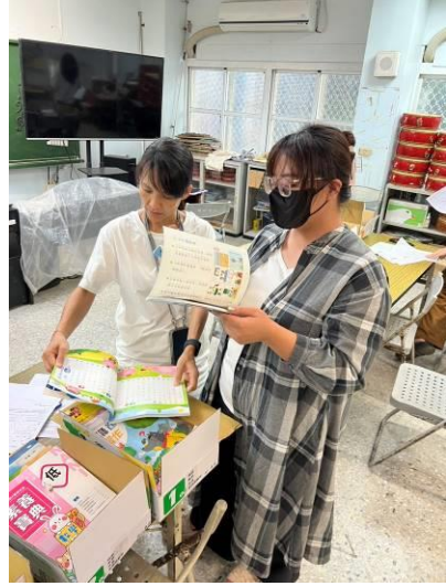
說明：教師檢閱教科書進行評選