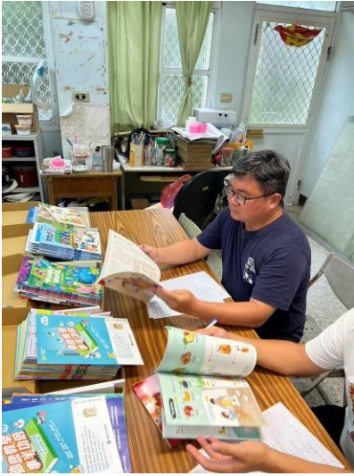
說明：教師檢閱教科書進行評選