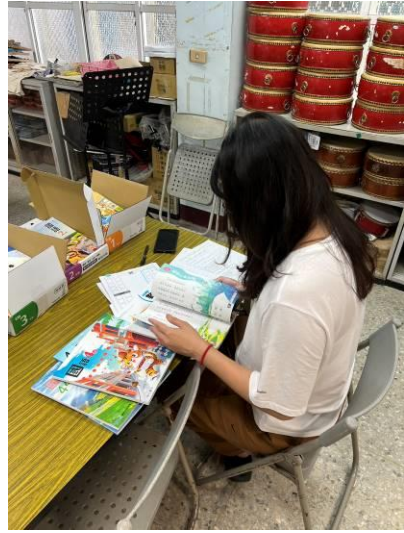
說明：教師檢閱教科書進行評選