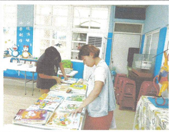
教師進行教科書評選